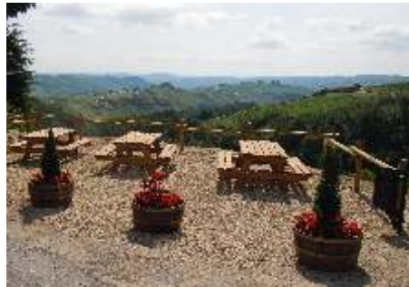
Area panoramica "Vistaest"