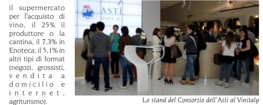
Lo stand del Consorzio dell'Asti al Vinitaly