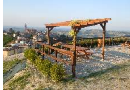
Area panoramica "Crava"