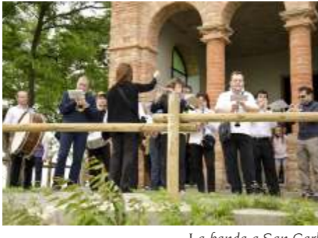
La banda a San Carlo