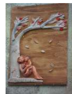
"All'ombra di un melo" opera di Manuela Incorvaia