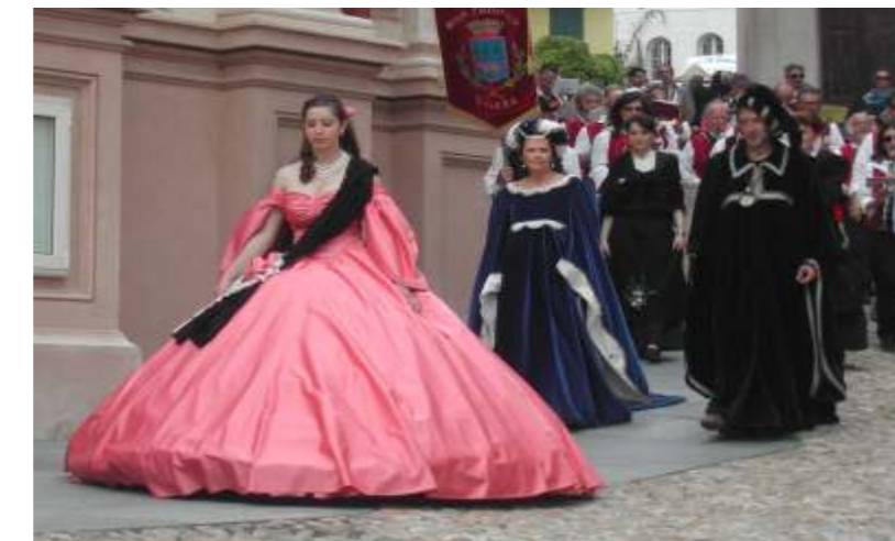
Sfilata della Contessa di Castiglione a Castagnole delle Lanze

della sera. La nostra Contessa, nel frattempo, è comparsa in una domenica di maggio alla festa che il paese di Castagnole Lanze ha dedicato alla Barbera, partecipando alla S. Messa nella parrocchiale e sfilando nel pomeriggio insieme ad altri personaggi, accolta come sempre con molta ammirazione.