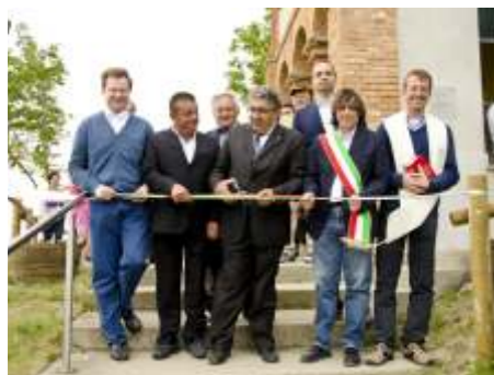
Taglio del nastro con le autorità a San Carlo