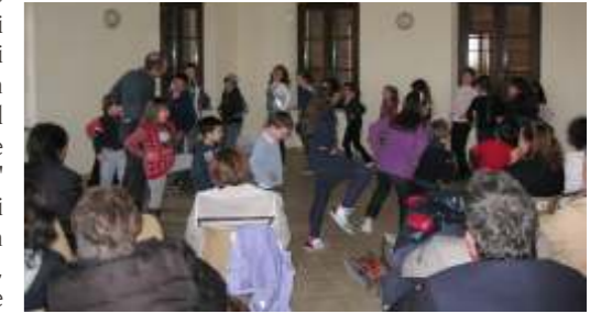
I bambini coinvolti nel progetto Ludori'

Sono stati una ventina i bambini delle scuole del paese che hanno partecipato alla tappa castiglione del progetto Ludori', domenica 18 marzo nelle ex scuole elementari al santuario. Il progetto Ludori' è nato nel 2001 su iniziativa dell'associazione culturale