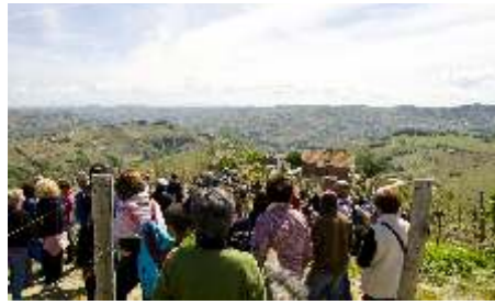
Il gruppo in cammino