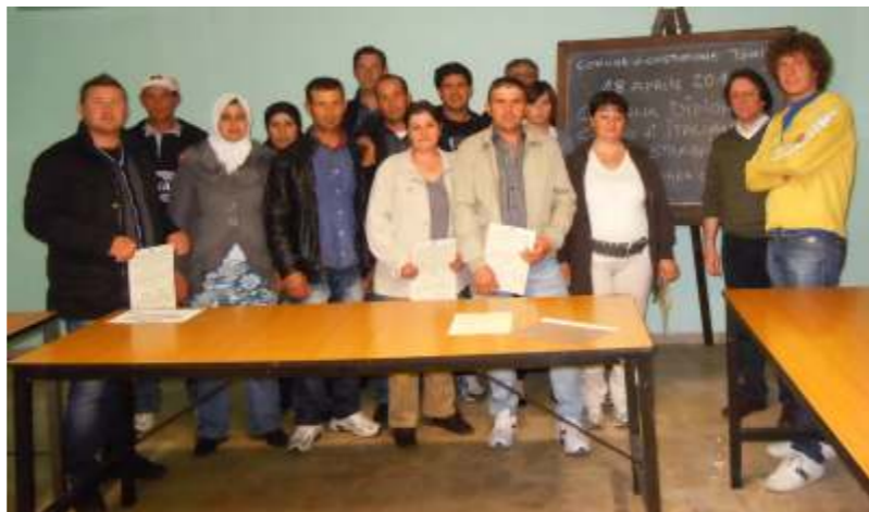
Foto di gruppo di fine corso