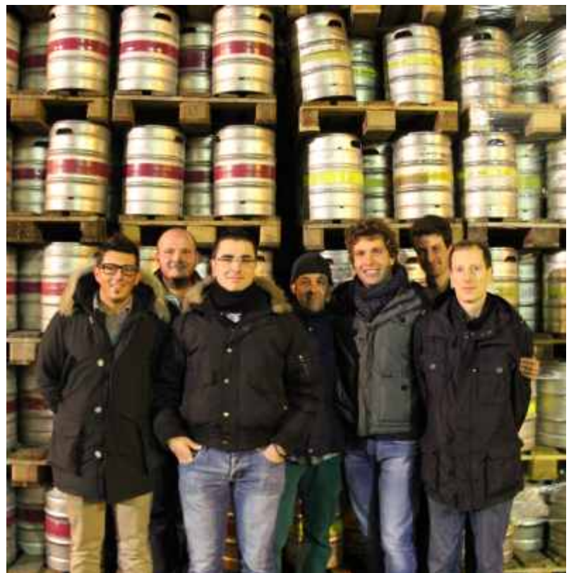
I ragazzi del direttivo in scadenza di mandato

Questo è il terzo ed ultimo anno del nostro mandato: dal prossimo servirà un nuovo direttivo. Gli anni passano e mutano le situazioni personali, nuovi compiti, nuove persone hanno bisogno di un po' del nostro tempo e così ne rimarrà meno per l'associazione. Sarebbe bello un ricambio generazionale, nuove leve libere dagli impegni propri di chi ha un'età più matura che volessero assumersi qualche responsabilità per il paese, così come abbiamo fatto noi tempo fa; anche se non verrebbero lasciati soli. E comunque serviranno energie nuove per dare un seguito alla pro loco ed alle sue attività.