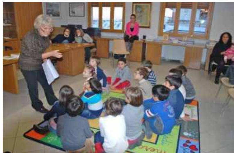
La "lezione" ai bambini