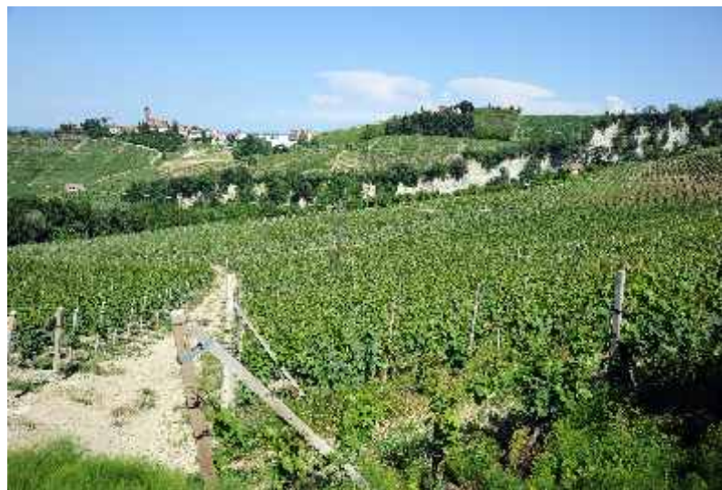
Vigneti di Moscato in Località Brosia

Probabilmente molti produttori non la iscriveranno tra le annate di grande soddisfazione a causa della grandine, avversità parassitarie o produzione solo a tratti soddisfacente in termini quantitativi. Ma sarà una buona annata per la qualità dei vini.