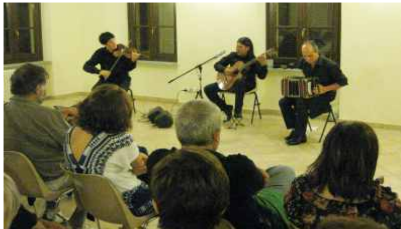
Serata di tango nelle ex scuole del Santuario