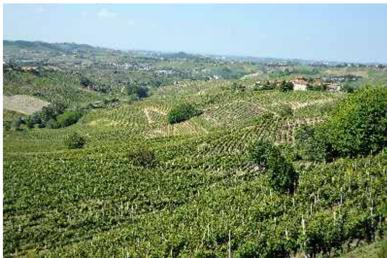
Vigneti di Moscato in Valle Leproglia e Neirano

Il vitigno Moscato è originario del bacino medio-orientale del Mediterraneo, inizialmente viene diffuso in Italia meridionale dai greci e probabilmente è l'uva più antica coltivata nella nostra penisola. In seguito, si diffonde al nord nel medioevo e in Piemonte nei primi anni del XIV secolo. La coltivazione si diffonde rapidamente perché sostenuta dal ceto più abbiente, ma di contro i viticoltori, vista la difficoltà nel produrre il vino che all'epoca era un passito, non accettavano di buon grado. Si capì subito che le nostre colline erano l'habitat ideale per la produzione del Moscato, infatti già nel 1600 era ben delineata la zona e nel mondo si parlava di un Moscato bianco del Piemonte. Nel 1800 Canelli, che fin dall'epoca medievale era uno dei più importanti centri di commercio legato all'attività vitivinicola, diventò il centro della produzione del vino noto come Moscato bianco di Canelli. In questa realtà territoriale, che a metà del XIX secolo era ben collegata da strade e dal 1857 dalla ferrovia con le maggiori città (Genova, Asti, Alessandria), le cantine con tutte le attività collegate, trovarono la sede ideale. Di conseguenza il legame tra i produttori di uva Moscato e le aziende