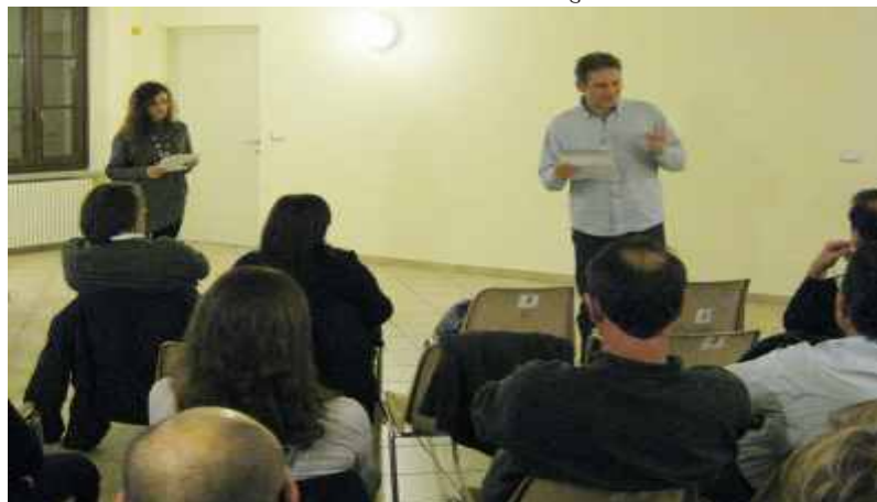
Progetto Metapolis, Comizi d'Amore