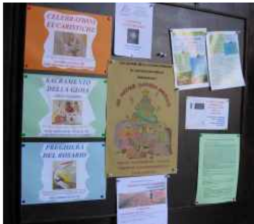
Gli appuntamenti del Santuario