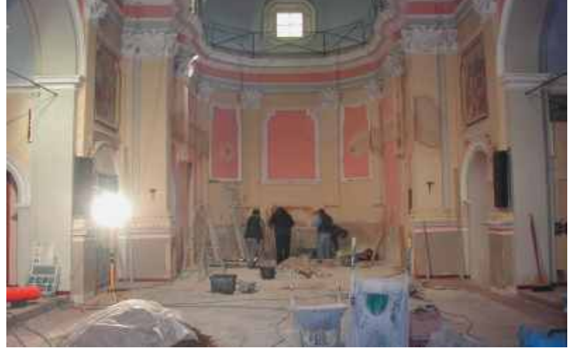
Lavori nella vecchia parrocchiale

Dopo gli importanti interventi di asfaltatura realizzati in estate su diversi tratti di strade comunali per un totale di circa 3 chilometri, proseguono ora i lavori all'interno della nostra vecchia chiesa parrocchiale seguendo l'iter di intervento previsto dal progetto di ristrutturazione che il Comune sta portando avanti con il contributo della Fondazione CRC. Sono invece terminati ormai da qualche mese i lavori relativi ai servizi igienici nell'edificio scolastico, per la scuola primaria e per la palestra, comprese le chiusure con finestrini dei locali seminterrati che saranno oggetto di prossime sistemazioni: anche questi realizzati con un contributo della Fondazione CRC. Si stanno concludendo anche i lavori al cimitero che hanno riguardato il rivestimento dei muri di perimetrazione e l'ingresso della parte nuova oltre all'illuminazione dei due piazzali, mentre sono iniziati gli interventi previsti su strada Rittano-Cocito dove è già stato steso il nuovo asfalto. Prossimamente si svilupperanno gli altri interventi previsti nelle diverse zone del territorio comunale, compresa la nuova asfaltatura di strada San Carlo-Marini.