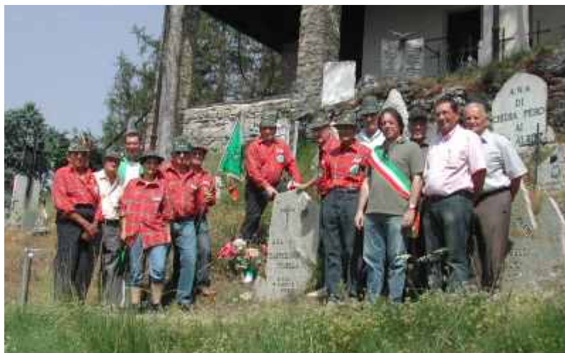
La pietra commemorativa

Gli alpini hanno organizzato anche la tradizionale castagnata autunnale dedicata ai bambini delle nostre scuole che quest'anno si sono ritrovati per l'occasione nella casa di riposo S. Andrea, offrendo una bella compagnia agli anziani ospiti, coinvolgendoli nel momento di festa. Dopo l'annuale raccoglimento al monumento rivolto ai caduti di tutte le guerre celebrato la prima domenica di novembre, con la neve di dicembre si è anche svolto il rito della Bagna Cauda che gli alpini hanno organizzato nel salone del Santuario in frazione Balbi grazie alla disponibilità di Don Filippo. Un servizio catering ha servito la nota "Bagna" piemontese alle circa ottanta persone intervenute.