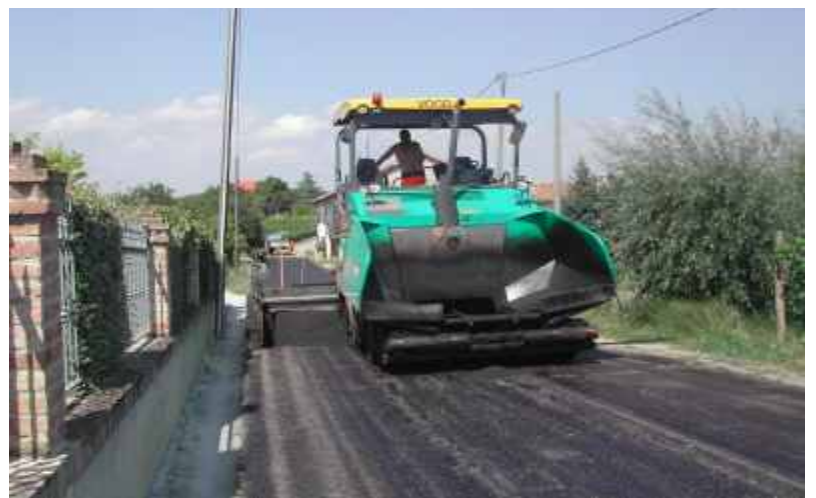
Asfaltatura in strada San Martino