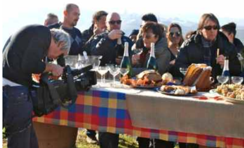
Le riprese Rai