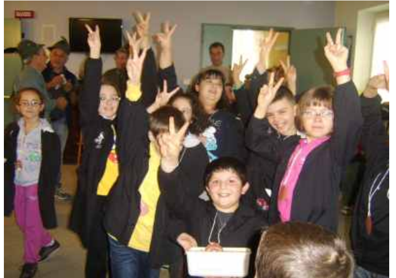
I bambini durante la castagnata degli alpini