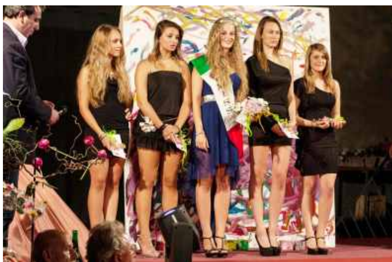
Miss Contessa 2013 con le altre partecipanti