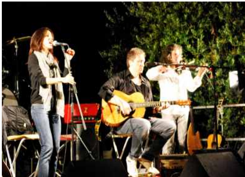
Amemanera in concerto

La rassegna musicale estiva "Un palco tra le Vigne" si è aperta con l'affollato concerto del gruppo "Amemanera" che ha presentato un bel progetto dedicato al canto piemontese; è poi proseguita con il concerto del noto chitarrista jazz Andrea Allione (purtroppo scomparso lo scorso mese di ottobre per una meningite fulminante che l'ha colpito appena arrivato da una tournée londinese), concludendosi con le note del tango di Carlos Gardel dallo spettacolo "Muy Lindo Tango". Villa Fogliati è stata poi nuovamente invasa dal pubblico in occasione del "Virginia Day" che quest'anno ha eletto la prima Miss Contessa, Clara Borio di Alba. Il puntuale concerto di settembre allestito accanto alle celebrazioni religiose del nostro Santuario ha visto il successo del gruppo "Miguel Angel Acosta Trio" che ha regalato al pubblico le appassionanti sonorità del tango e delle milonghe argentine. Alle ex scuole di frazione Balbi è tornato anche il Teatro della Forma per proporre "Comizi d'Amore" e l'ultima veglia-incontro del progetto "Metapolis".