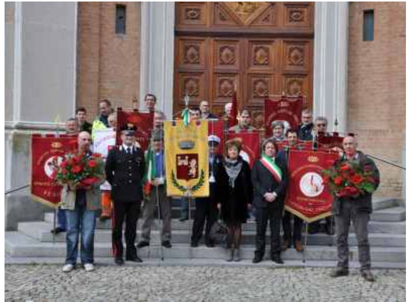
Foto di gruppo al termine della S.Messa

PROSSIMO APPUNTAMENTO: 22 dicembre ore 80,30 - 11 sempre presso Casa di Riposo