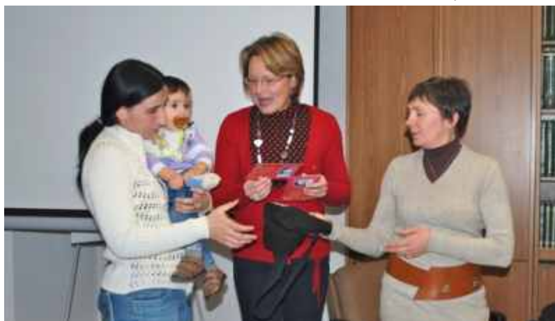
La consegna delle tessere