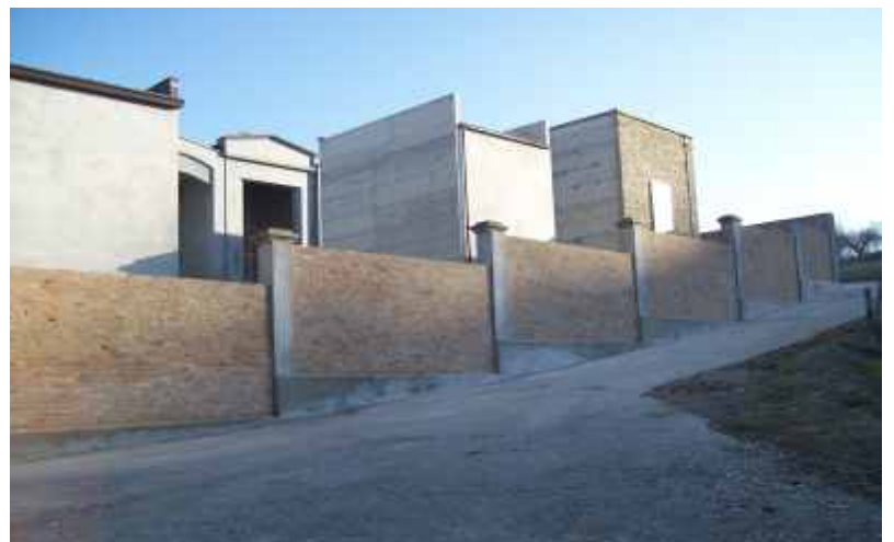
Lavori al cimitero