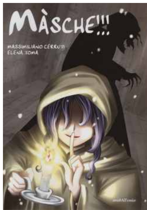
La copertina del fumetto