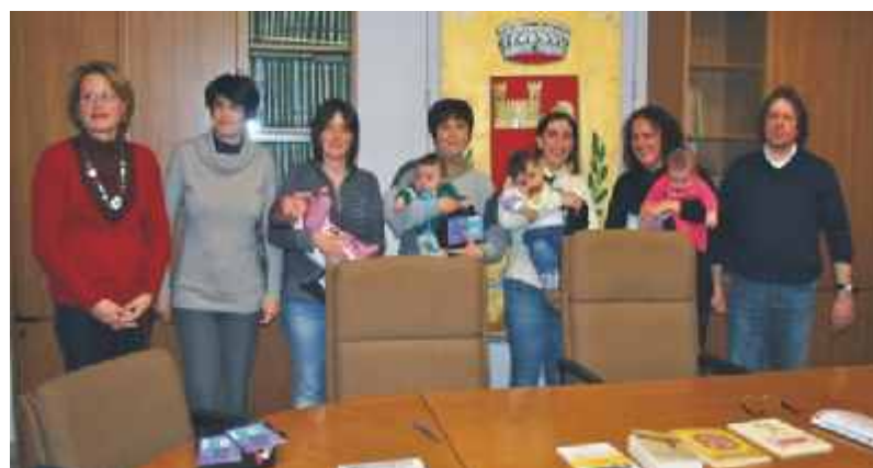
I nuovi nati con le mamme