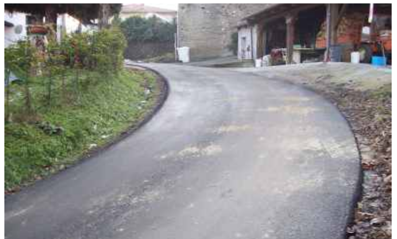
Nuovo asfalto in Strada Rittano