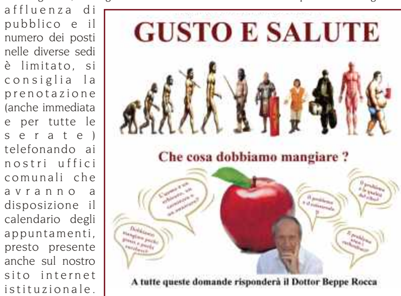
La locandina degli incontri