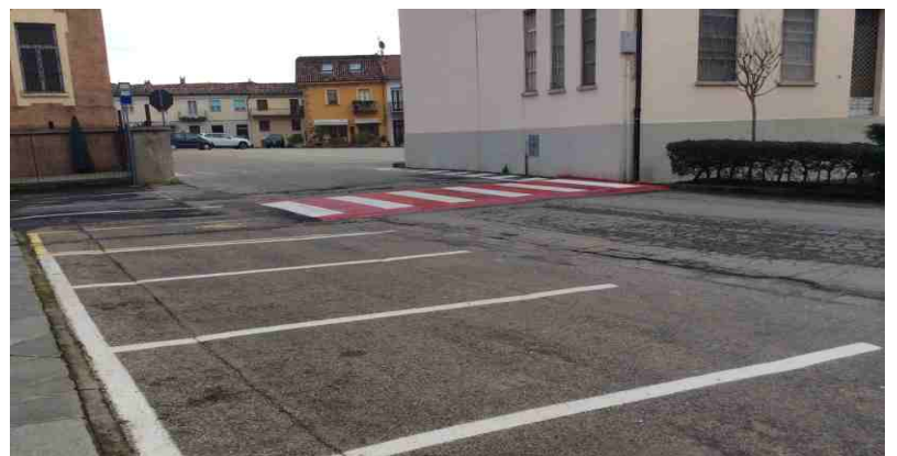
Le nuove strisce in paese

Nei mesi scorsi l'amministrazione comunale ha realizzato il previsto dosso con strisce pedonali in prossimità del nuovo parco giochi, ha ridisegnato tutte le altre strisce pedonali e i parcheggi sulla piazza del paese allargandoli di circa 20 cm per renderli più comodi. Si è ripassata tutta la segnaletica a terra degli incroci, in particolare quelli verso le strade provinciali e si sono posizionati diversi cartelli sul territorio comunale, dove erano mancanti o da sostituire: segnali di Stop in prossimità di incroci e anche indicatori con i numeri civici nella zona della frazione Balbi.