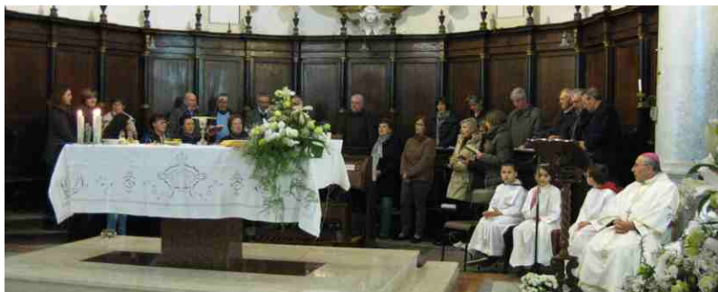
La cantoria durante la S. Messa