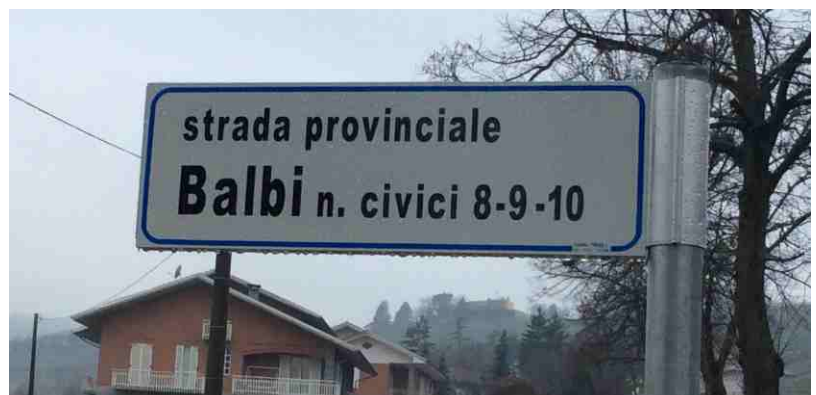
Le nuove indicazioni con i numeri civici