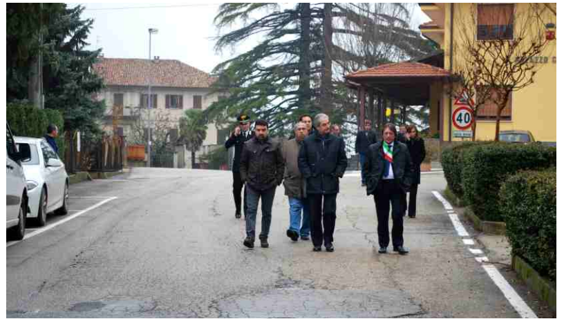
Il prefetto visita il concentrico