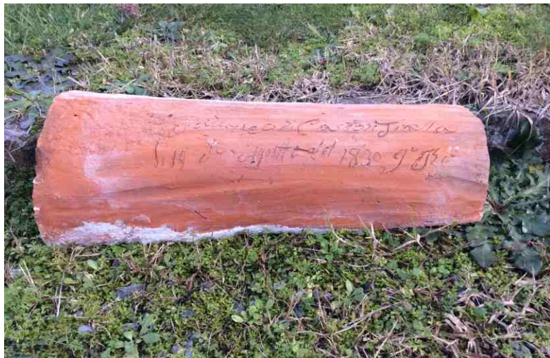
Il coppo ritrovato

Come si dice: due elementi possono fare una prova. Mentre riporto a galla il ricordo delle parole di mia madre che mi parla di una fornace a Castiglione, a Cossano Belbo viene ritrovato un vecchio "coppo" che porta incisa una scritta curiosa. Un impresario edile cossanese, già amministratore comunale, ristrutturando una vecchia cascina sulle colline della valle Belbo è intento a rimuovere la copertura quando si trova in mano un coppo con una scritta: "Castione Tinella, 19 agosto del 1830". Prontamente, scatta una foto con il telefono cellulare e la mostra al sindaco di Castiglione. Ogni volta che si svelano tracce del tempo, nelle parole, nelle opere o nei materiali viene in mente l'importante valore della Storia, soprattutto se è per noi legata ai luoghi di appartenenza.