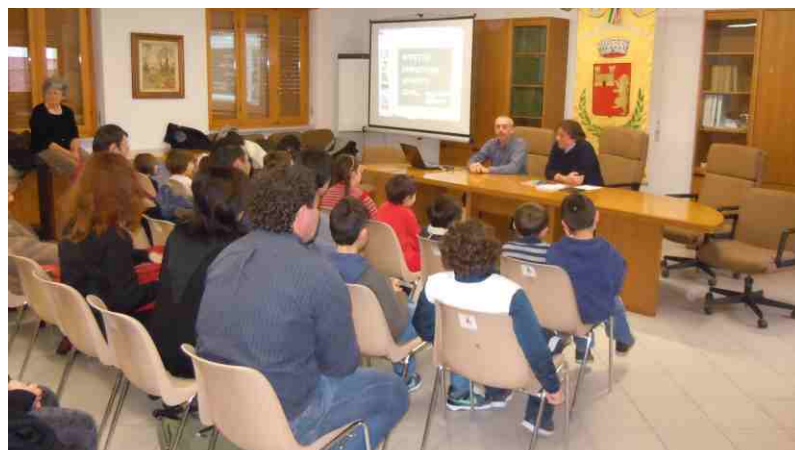
La presentazione del libro "Effetto Christian"