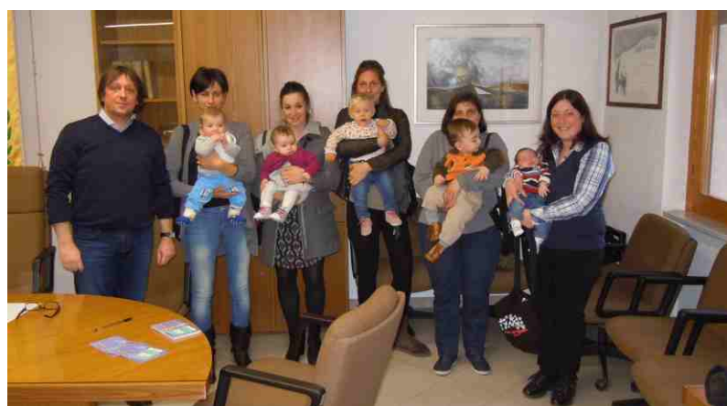
I bimbi nati a Castiglione Tinella nel 2014