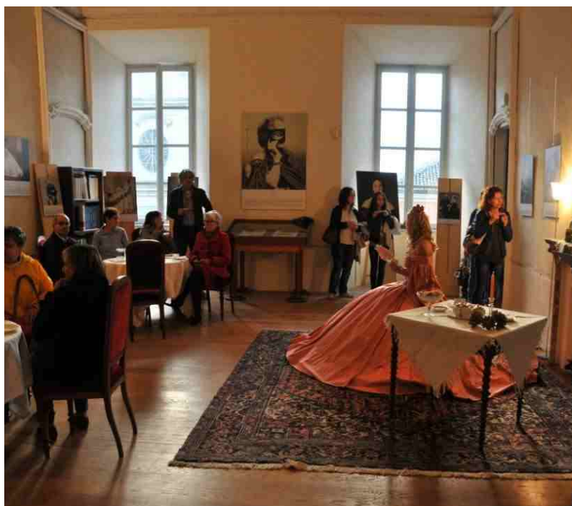
Il tè con la contessa