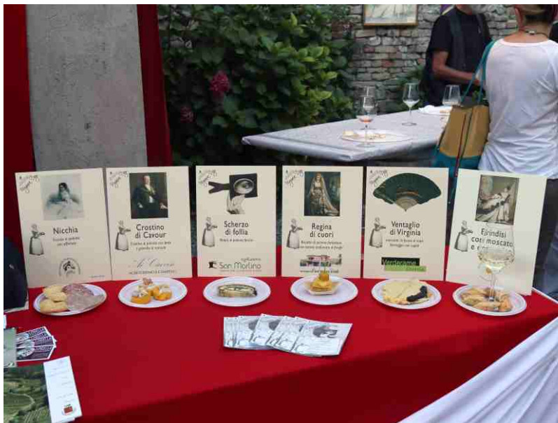
I piatti preparati dai ristoranti castiglionesi per il Virginia Day