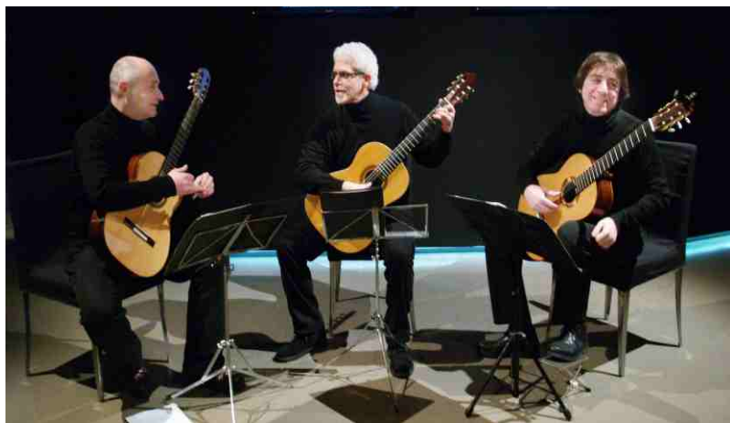
"Vivaldi Guitar Trio" in concerto alla rassegna musicale