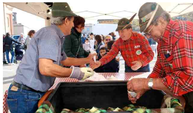
La "Castagnata" per le scuole