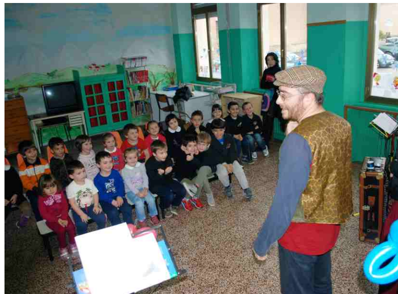
Animazione nelle scuole