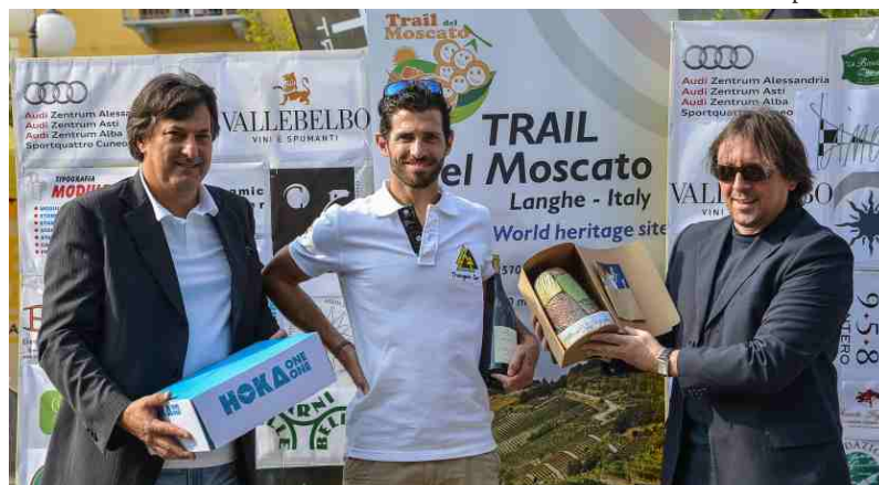
Il vincitore del "Gran Premio Colline di Castiglione Tinella"