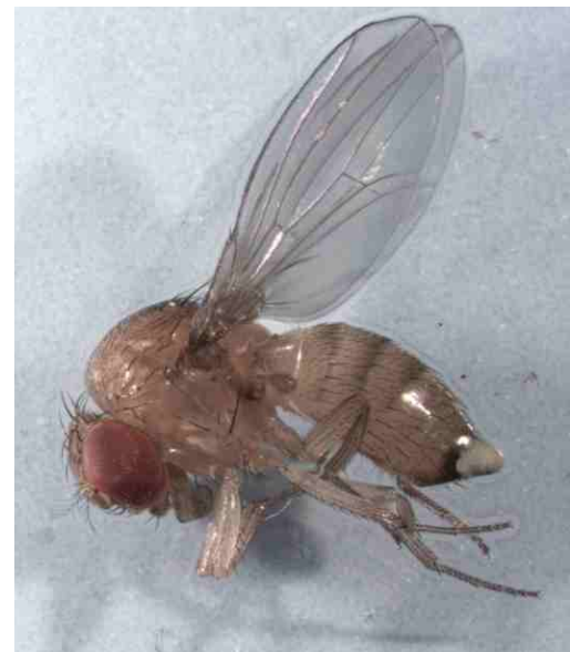
La Drosophila Suzukii

(indicativamente nel mese di aprile), completano lo sviluppo, si impupano e danno origine alla prima generazione di adulti nel mese di giugno. Secondo quanto riportato in bibliografia occorrono circa 30 - 40 giorni per compiere un ciclo completo (da uovo ad adulto). Nei confronti di questo insetto non risultano ancora registrate per l'impiego specifiche sostanze attive particolari. E' preferibile scegliere prodotti a basso impatto ambientale in grado di preservare quanto più possibile l'integrità dell'ecosistema, anche allo scopo di favorire il naturale controllo dell'infestante. Prodotti come il Bacillus thuringiensis var. Kurstaki o come i regolatori di crescita sono in grado di fornire risultati apprezzabili senza creare gravi alterazioni dell'equilibrio ambientale. Per assicurare l'efficacia del trattamento occorre intervenire nei confronti di larve giovani sulle quali i prodotti si rivelano maggiormente efficaci. Sono disponibili trappole sessuali per la cattura degli adulti che consentono, attraverso il monitoraggio del volo delle farfalle, di posizionare correttamente gli interventi.