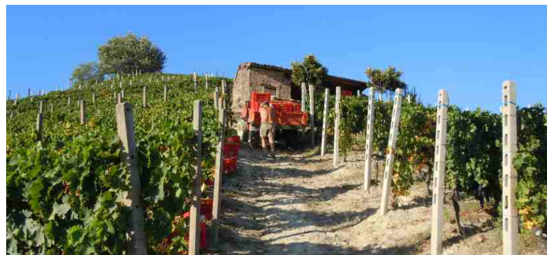
La fatica della vendemmia

L'annata 2014 non sarà ricordata tra le migliori, né in Piemonte e, piccola consolazione per noi, né in Italia e ne in Europa.