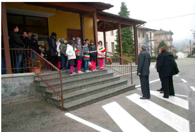
I bambini delle scuole accolgono il Prefetto