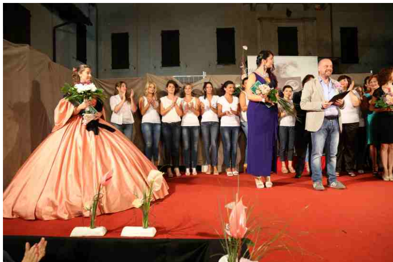
Le ragazze e le ospiti della sfilata