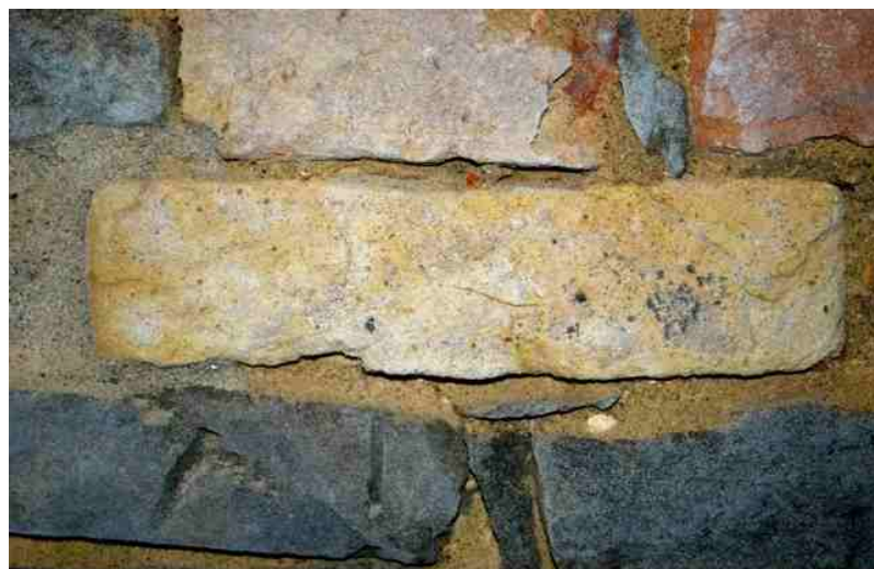
Particolare dei mattoni

Inizia la ricerca ed ecco cosa svelano le pagine del libro "Castione": seguendo la storia della nostra vecchia chiesa parrocchiale, Fermo Cerutti trova notizie risalenti al 1719 quando si pensa di ricostruirla viste le continue riparazioni che richiede e siccome servono molti coppi e mattoni si pensa proprio di costruire una fornace in paese. L'impianto sorse "sotto" il paese, sul versante est della collina che lo ospita, in una larga area posta a metà della vecchia "strada comunale del solito" che attualmente viene utilizzata dai nostri agricoltori e dai turisti. I mattoni