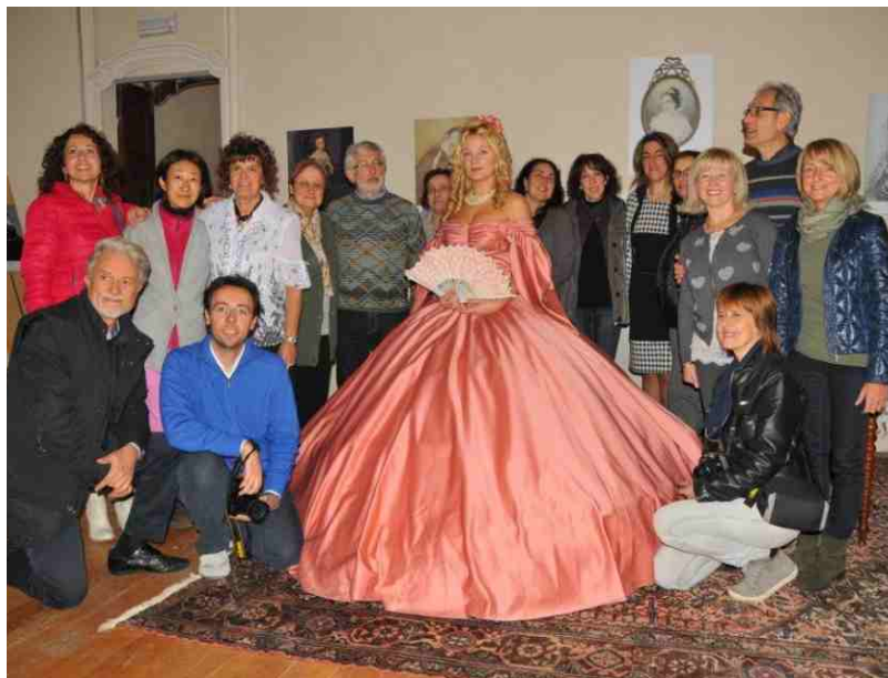
Foto di gruppo con la contessa