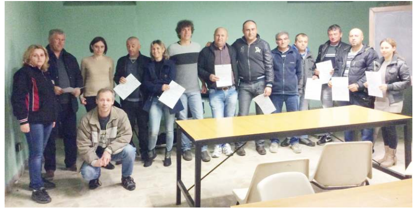
La consegna dei diplomi