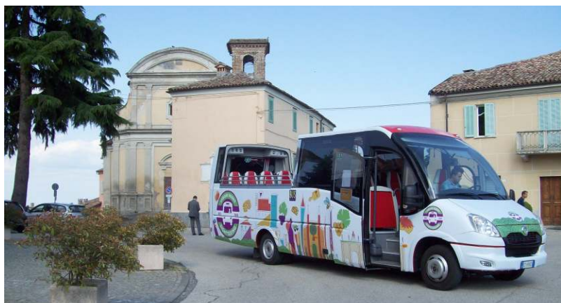
Il bus turistico