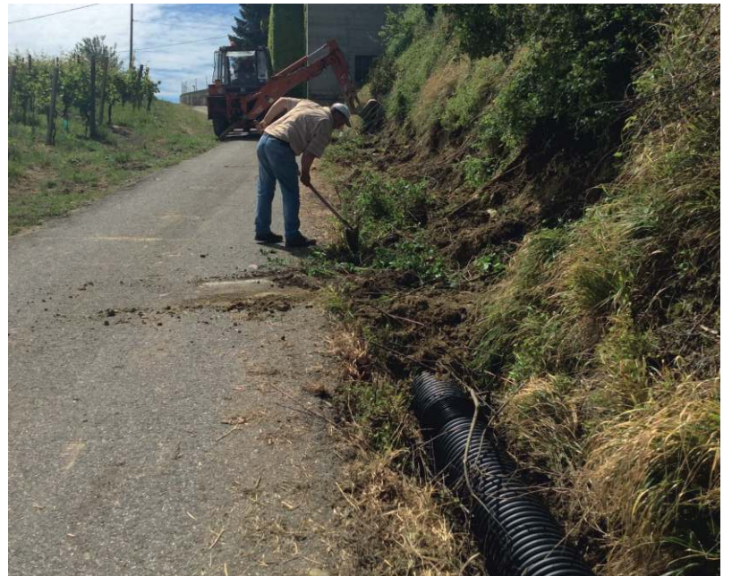
Posa dei tubi a San Carlo