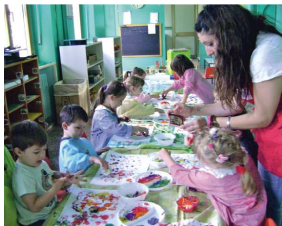
Attività a scuola

Oltre alle attività curricolari, nelle nostre scuole dell'infanzia e primaria, molte sono state le iniziative ed i progetti realizzati. Per quanto riguarda la scuola primaria i bambini a gennaio hanno ricordato la giornata della memoria con cartelloni, poesie e con la lettura, da parte del Sindaco, di brani sul tema. In occasione della festa della bandiera e