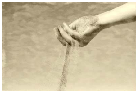
Polvere di terra

seguito a osservazioni dei filari di vite coltivati ai margini delle carreggiate questa malattia sembrava meno aggressiva. Questa fine polvere di terra argillosa e calcarea veniva miscelata con calce spenta, acido fenico e in alternativa con zolfo. Come rimedio rimase giustamente lo zolfo, in particolare quello in polvere, visto