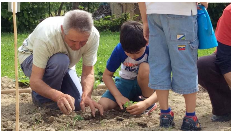
I bambini delle nostre scuole nell'orto didattico-biologico a Villa Fogliati