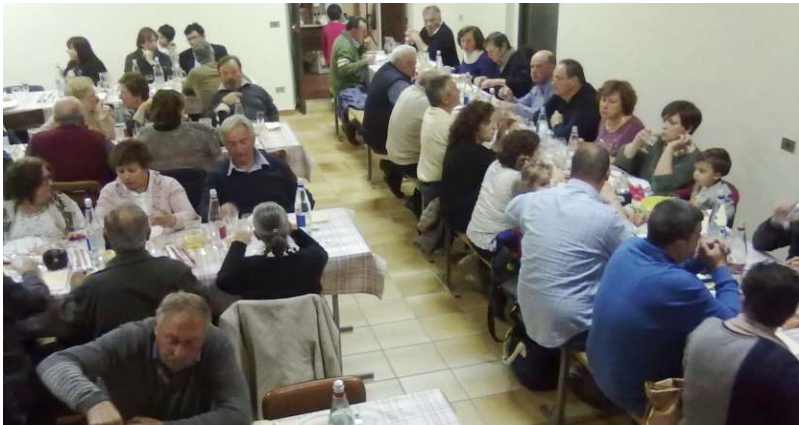
La cena del fritto misto

all'evento religioso, la festa popolare ha ospitato la presentazione del libro "Ce l'ho messa tutta" di Mauro Aimassi, il tradizionale spettacolo dialettale con la Compagnia della Associazione per gli studi su Cravanzana che ha presentato "Da