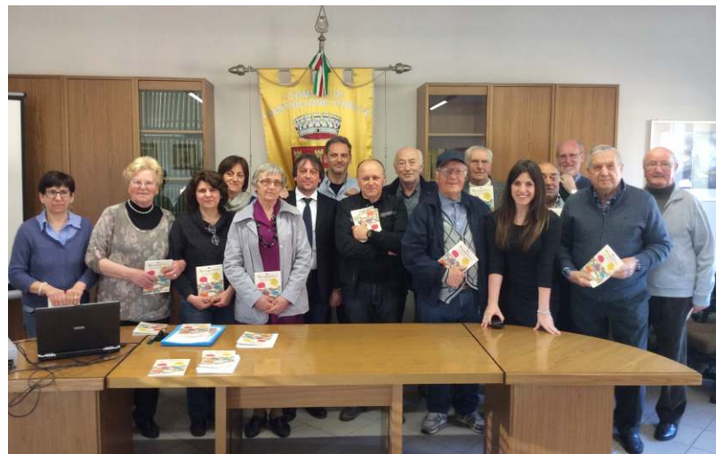
I protagonisti del progetto Metapoli(s)