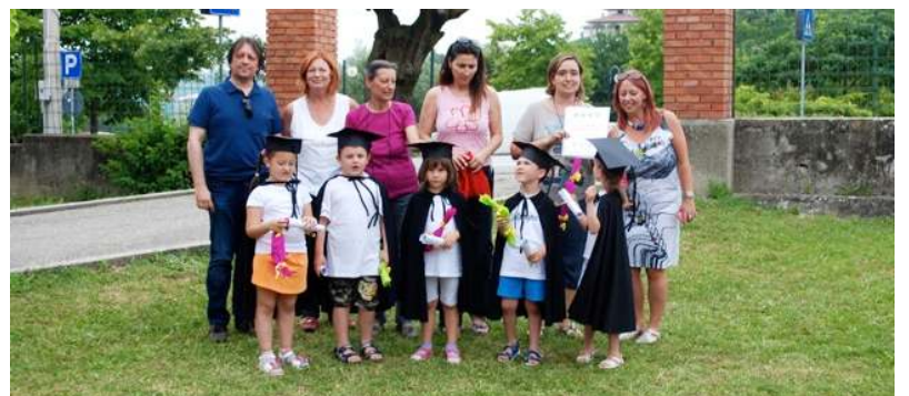
Festa di fine anno

sempre, in occasione della Festa dei Nonni i bambini si sono recati tutti alla casa di riposo dove hanno giocato e cantato assieme agli ospiti. I bambini della scuola dell'infanzia hanno avuto il piacere di lavorare con un'animatrice che opera nell'ambito del progetto "Ludoù", impegnandosi e divertendosi a stampare con diversi tipi di verdure gli elaborati che poi hanno portato a casa alle famiglie. I piccoli dell'infanzia hanno avuto altresì due momenti di continuità con gli alunni della scuola primaria, partecipando alle lezioni della prima e seconda elementare. Il cartellone dell'iniziativa e dei lavori prodotti è stato appeso nei locali della scuola. Un secondo momento è stato condiviso nei locali della scuola dove tutti assieme i bambini hanno giocato e cantato. In conclusione è avvenuta la festa dei remigini per salutare i bambini che a settembre inizieranno la prima elementare, tale momento di festa si è svolto nel parco del Santuario della Madonna del Buon Consiglio. In questa occasione si sono cantate alcune canzoni, concludendo poi la festa con la consumazione del pasto attraverso un bel pic-nic preparato dalle famiglie e condiviso con tutti i partecipanti. Arriverci a settembre e buone vacanze a tutti!