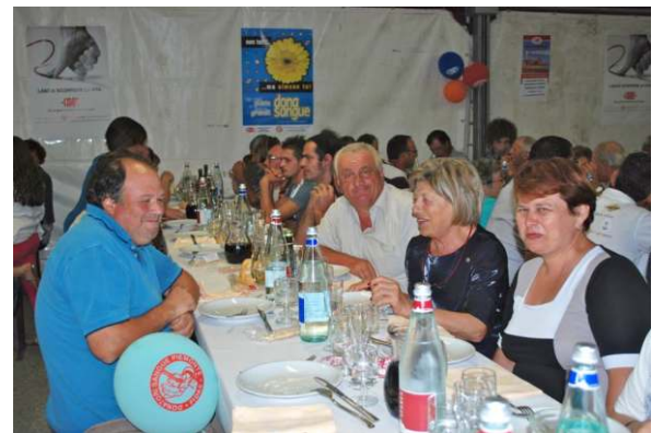
La Cena di S. Luigi

arriveranno a mangiare. La cena è un successo, tutto esaurito, compresa la lotteria interminabilmente ricca, e all'una possiamo andare a dormire. La domenica comincia presto con la corsa "Aspettando il trail del Moscato" e il presidente è tra i più mattinieri anche se non