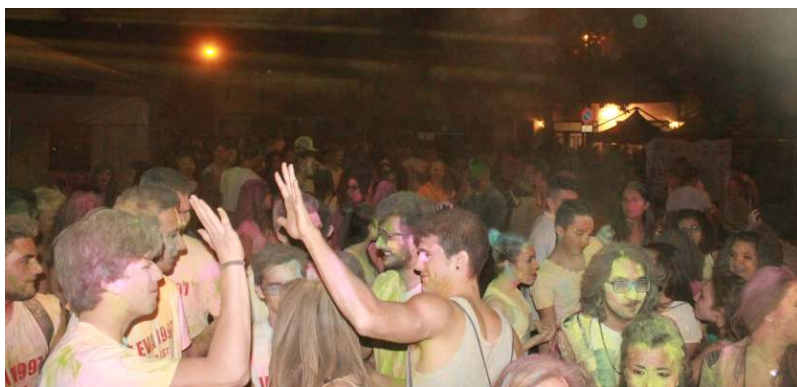
Musica e colori