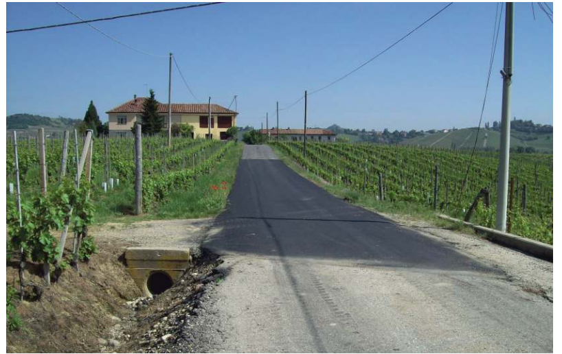
Nuovi asfalti in strada San Lazzaro

insistenti piogge di primavera, si è operato per rimuovere diverse scarpate franate e si è provveduto a segnalare gli smottamenti avvenuti anche su proprietà private con la speranza di recuperare qualche risorsa per le sistemazioni. Più grave è la condizione delle strade provinciali che ad oggi non sono oggetto di manutenzione da parte dell'ente preposto: alcuni interventi d'emergenza necessari su fossi e scarpate sono effettuati dal Comune ma rimangono ferme molte situazioni che richiederebbero lavori di ripristino e di sostegno, soprattutto sul tratto di strada che collega il concentrico con la frazione Balbi.