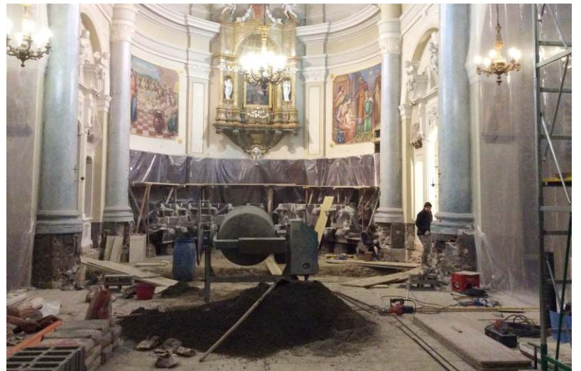
I lavori nel Santuario