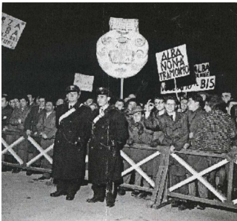
La manifestazione ad Alba