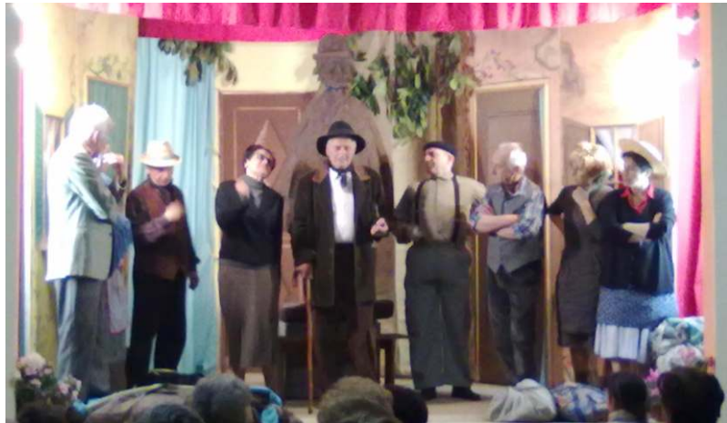
La serata teatrale

Con la tradizionale festa religiosa di aprile al nostro Santuario si è ripetuto il rito del "Triduo in Preparazione", della predicazione, affidata a don Eligio Mantovani, poi la processione lungo la strada provinciale e la S. Messa solenne. Accanto