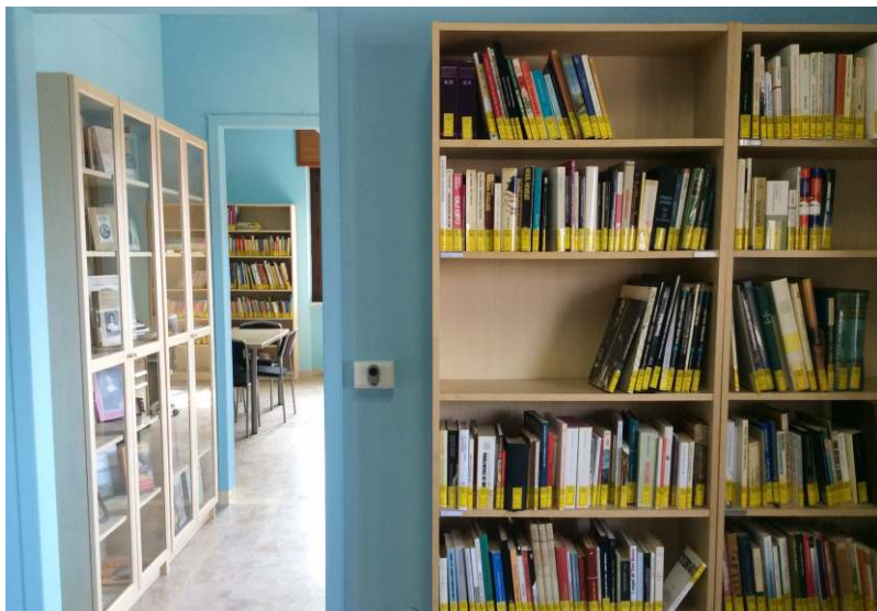
Lo spazio ampliato della biblioteca