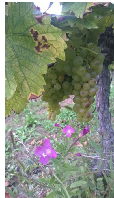
Fiori e Moscato

temuta dai viticoltori perché in grado di ridurre, oltre alla produzione di uva, l'impronta aromatica caratteristica tipica del vino prodotto sul nostro territorio. Infatti, da recenti studi, con un attacco del 40% di oidio sui grappoli si ha una riduzione totale degli aromi dell'uva Moscato, in quanto la buccia dell'acino, compromessa e fessurata dall'oidio, diventa permeabile all'aria e all'acqua, con conseguente ossidazione delle sostanze terpeniche, anche ad opera di conseguenti attacchi di Botritis, soprattutto se l'annata ha un decorso piovoso. Le manifestazioni del "marin bianc" sulla vite sono simili a quelle che si vedono su altre piante come rose, zucchine e alberi da frutto, però generate da oidio di genere diverso e quindi non è trasmissibile tra loro, ma, visto che le condizioni climatiche favorevoli al suo sviluppo sono simili, possono darci un'indicazione su quando iniziare i trattamenti contro questa malattia. Lo zolfo è anche un ottimo ammendante dei terreni calcarei tipici delle nostre zone.