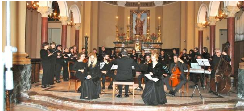
Il concerto spirituale