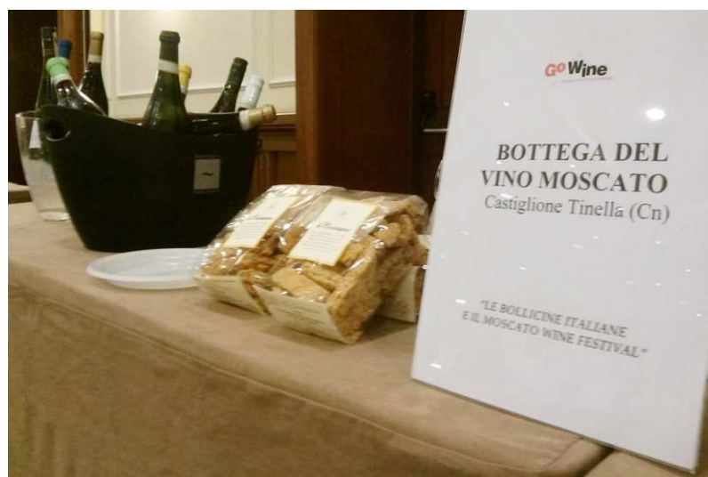
La Bottega al Moscato Wine Festival