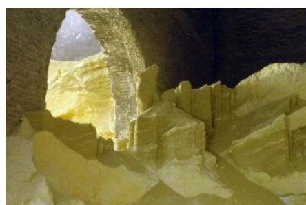
Deposito di zolfo

seguito a osservazioni dei filari di vite coltivati ai margini delle carreggiate questa malattia sembrava meno aggressiva. Questa fine polvere di terra argillosa e calcarea veniva miscelata con calce spenta, acido fenico e in alternativa con zolfo. Come rimedio rimase giustamente lo zolfo, in particolare quello in polvere, visto