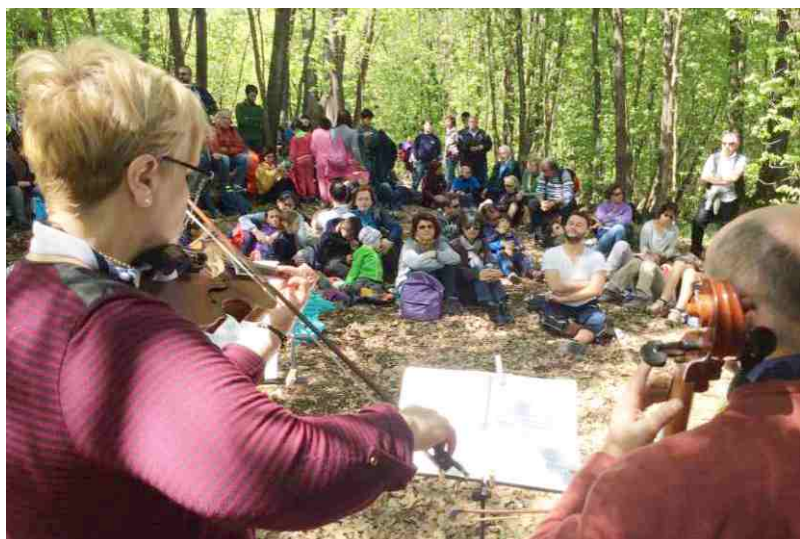
Musica tra gli alberi