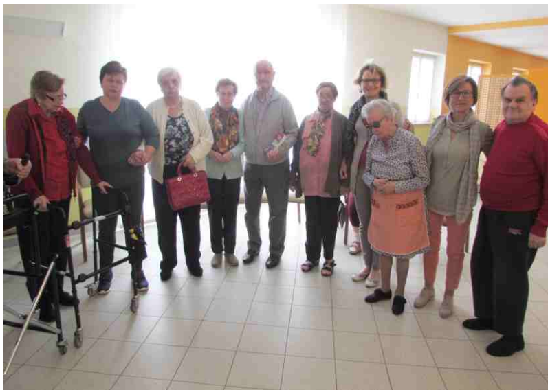
Foto di gruppo