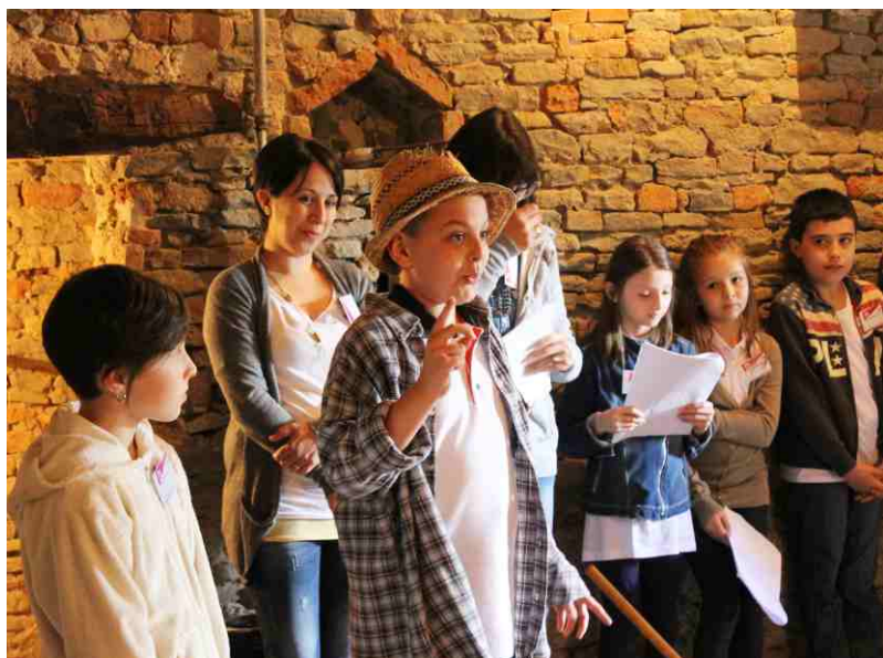
Gli alunni in scena al "Forn 'd Narcis"