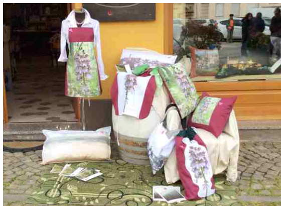
I gadget in vetrina a Castiglione