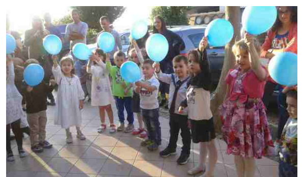
La festa della scuola dell'infanzia