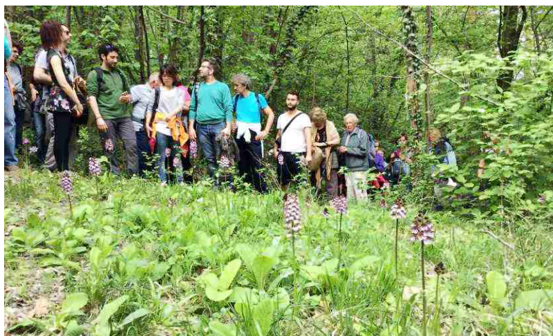
Si ammira la fioritura delle orchidee