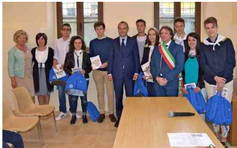
Il ministro Costa con i ragazzi della Leva