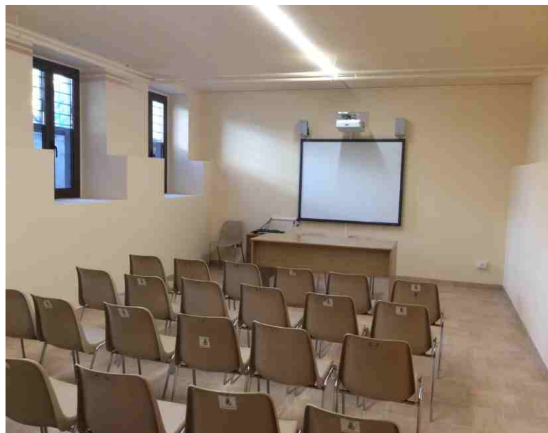
La nuova sala polivalente