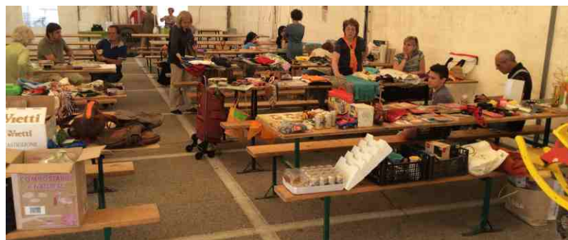
Il "Baratto" alla Patronale di San Luigi

Abbiamo poi organizzato la patronale di S. Luigi, che si è svolta con un bel successo dal 16 al 19 giugno, proponendo il solito ricco programma che ha compreso la gara podistica non competitiva "Aspettando il Trail del Moscato" sfidando il cattivo tempo, i festeggiamenti della Leva 1998 e Preleva 1999 con "American Pie", la "Cena di San Luigi" con quasi 180 partecipanti, la S. Messa della patronale, i giochi per i bambini, la sesta edizione di "Barattando" e la "St. Luis Fest" con i simpatici "Element da Piola".