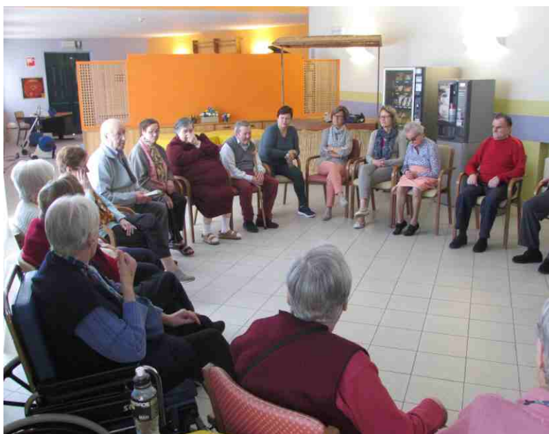
Una seduta di lettura