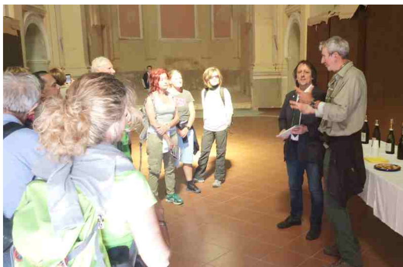
La "consegna" della cartina a Castiglione