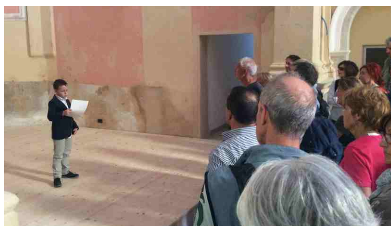
Le letture nella antica parrocchiale