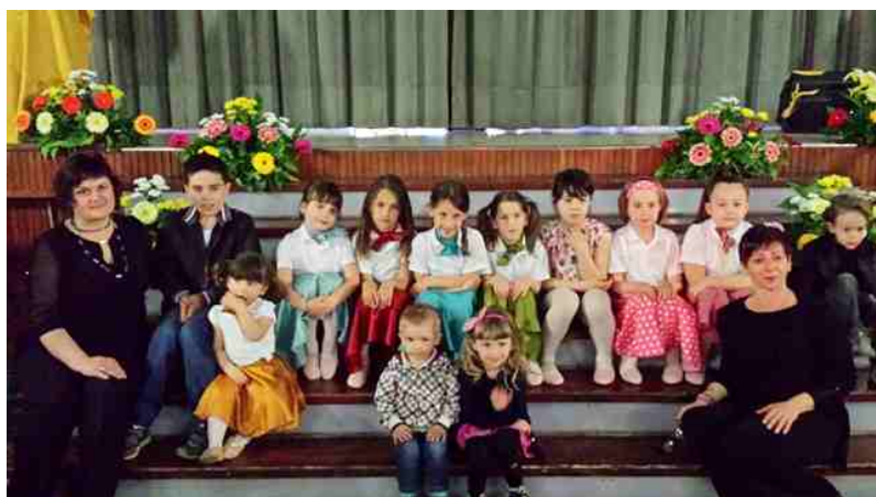
I bambini castiglionesi alla "Nota d'Oro"

Tanti complimenti ai ballerini che, con grande coraggio, si sono esibiti davanti ad un grande pubblico ed alle telecamere della televisione nazionale, ed un grazie di cuore alla maestra che è riuscita in poco tempo ad allestire un così bello spettacolo.