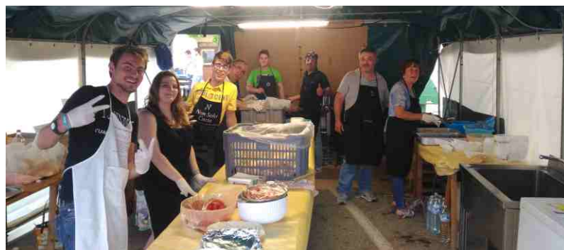
Al lavoro in cucina