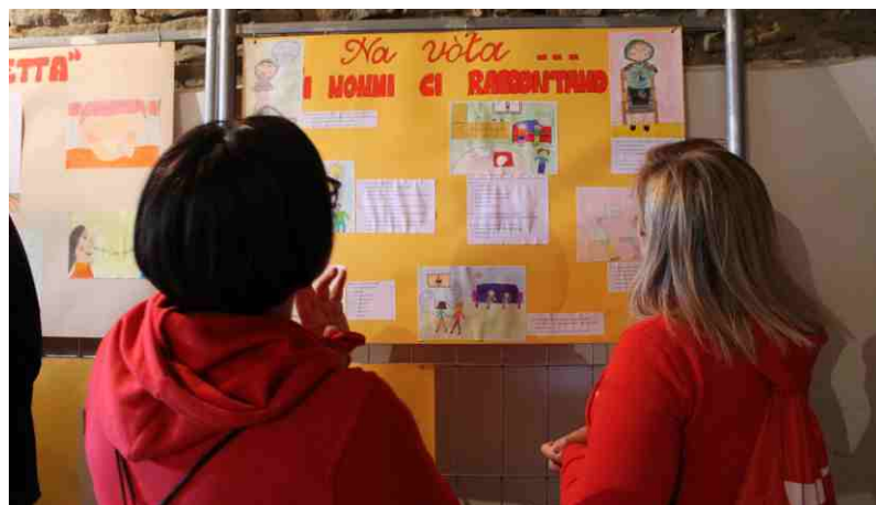
I lavori preparati dagli alunni