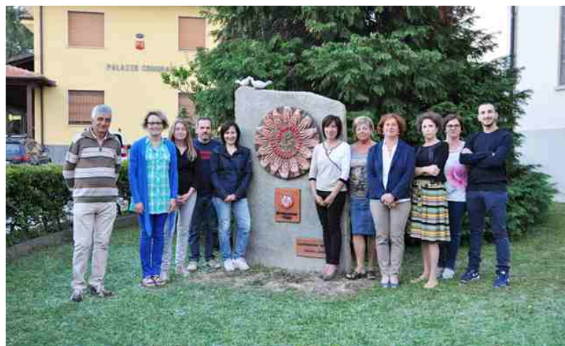
Il nuovo Consiglio Direttivo