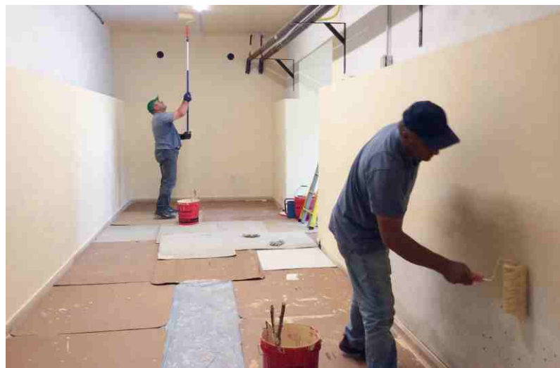
I nostri cantonieri al lavoro