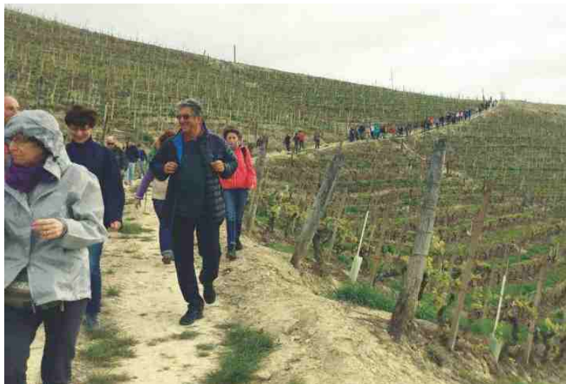
In cammino verso il bosco