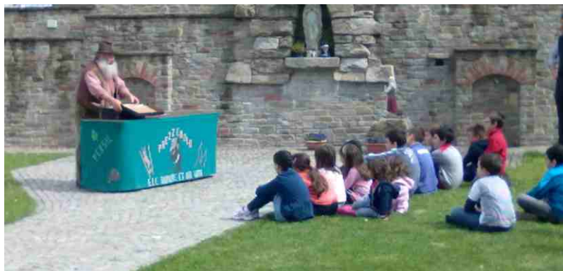
"Prezzemolo" al Santuario