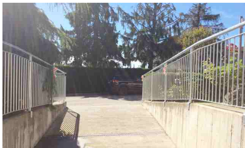
I nuovi parapetti esterni