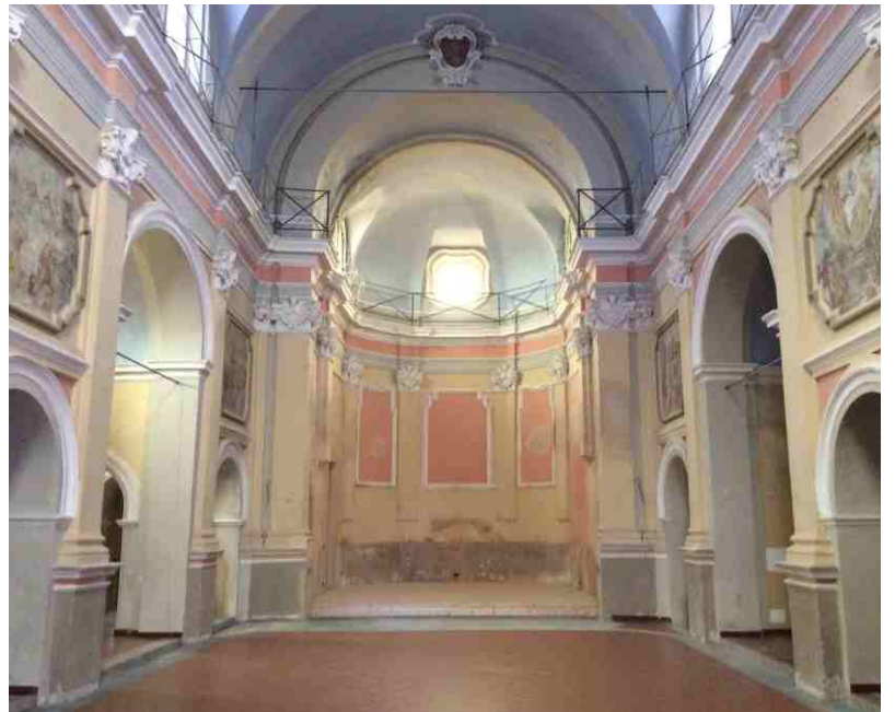
L'interno dell'antica parrocchiale

Domenica 29 maggio, in occasione dell'evento "Monumenti Aperti" si sono ufficialmente aperte le porte della vecchia chiesa parrocchiale dopo gli importanti lavori di recupero eseguiti negli ultimi anni. Si è così potuto constatare come è cambiata l'immagine interna dell'edificio dopo la rimozione delle parti che ne avevano variato il disegno originale. L'intervento che si sta affrontando in questi giorni riguarda invece il ripristino della facciata. I tre lotti di lavori affrontati finora sono costati 120.000 euro, di cui 80.000 finanziati dalla Fondazione CRC ed ora rimane l'ultimo importante lotto che prevede la tinteggiatura interna e il recupero delle parti affrescate. Sarà un intervento piuttosto importante, svolto con la collaborazione delle Belle Arti e che richiederà una spesa totale di oltre 200.000 euro. Questi lavori finali sono già oggetto di nuove richieste di finanziamento avanzate verso due diverse fondazioni bancarie e saranno inoltre inserite in una misura del PSR. Nel frattempo, i locali saranno utilizzati in qualche occasione così come i grandi e funzionali pannelli espositivi posizionati all'interno, realizzati con un contributo della Bottega del vino Moscato.