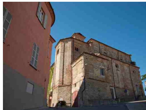
Il "corpo" della vecchia parrocchiale

Queste notizie sono state estratte dal Bollettino Numero Unico nella ricorrenza dell'inaugurazione della Nuova Parrocchiale il primo maggio 1931.