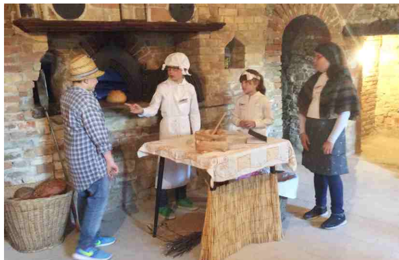
Gli alunni in scena al "Forn 'd Narcis"