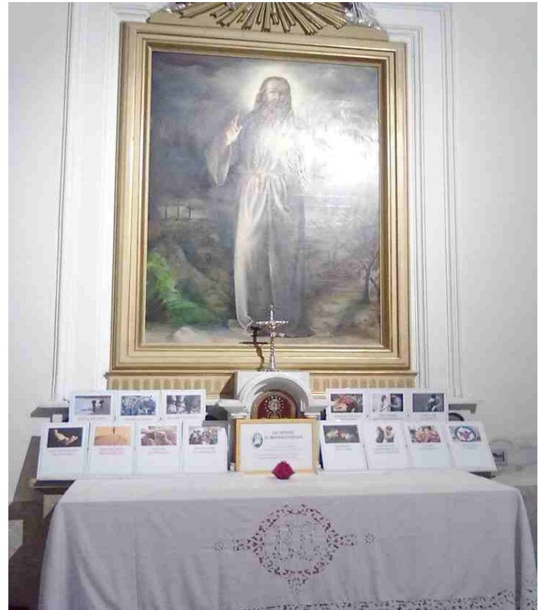
Allestimento dedicato alla Misericordia

Ad aprile c'è stata anche la Festa di Maria Madre del Buon Consiglio preceduta dalla novena e culminata nella solenne giornata del 26, svoltasi col favore del tempo e la presenza delle autorità.