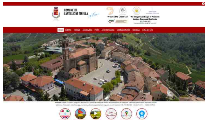
La home page del sito comunale

davvero suggestive del nostro paese. Sul sito appaiono poi i loghi delle due App che contengono informazioni dettagliate su Castiglione Tinella: la "Langhe Wine Truffle Tour" e la "Trip City Map". L'ultimo strumento collocato è la webcam che fissa senza interruzioni il panorama del paese che appare dalla alta collina di San Carlo.