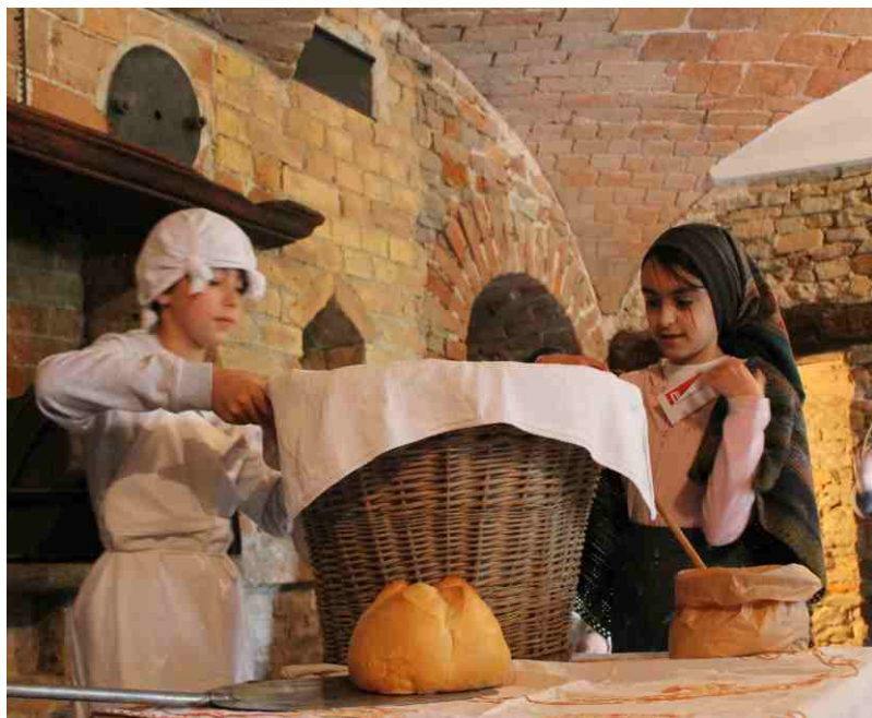
Gli alunni in scena al "Forn 'd Narcis"