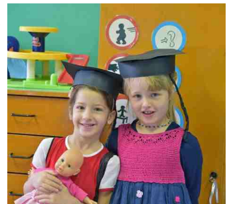
Le due "remigine"

I bambini della scuola dell'infanzia hanno invece portato avanti il progetto dell'orto che quest'anno è diventato "Orto Aromatico": questa iniziativa si è svolta in collaborazione con la casa di riposo S. Andrea ed è stata accolta positivamente dalla direttrice della struttura e dai genitori degli alunni. I piccoli dell'Infanzia hanno avuto altresì alcuni momenti di continuità con gli alunni della scuola primaria nel corso dell'anno. Alla cena di fine anno si sono salutate le due "remigine" alla presenza del sindaco che ha rivolto a tutti i genitori un cordiale saluto. Lunedì 20 giugno i bambini hanno assistito a uno spettacolo teatrale curato dagli attori del progetto "Ludorì" e prima della fine di questo anno scolastico, per i piccoli alunni ci sarà ancora una sorpresa: un picnic con gli amici della scuola di Mango preceduto da un simpatico momento di gioco con gli ospiti della nostra casa di riposo. E poi... Buone vacanze a tutti!