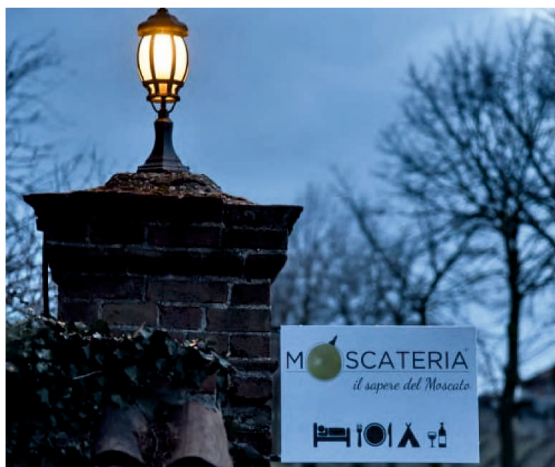
Il nuovo marchio della "Moscateria"