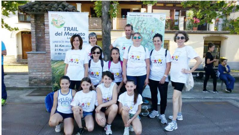
La partecipazione della Fidas alla corsa