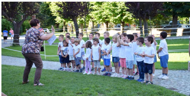
Gli alunni dell'Infanzia al Santuario