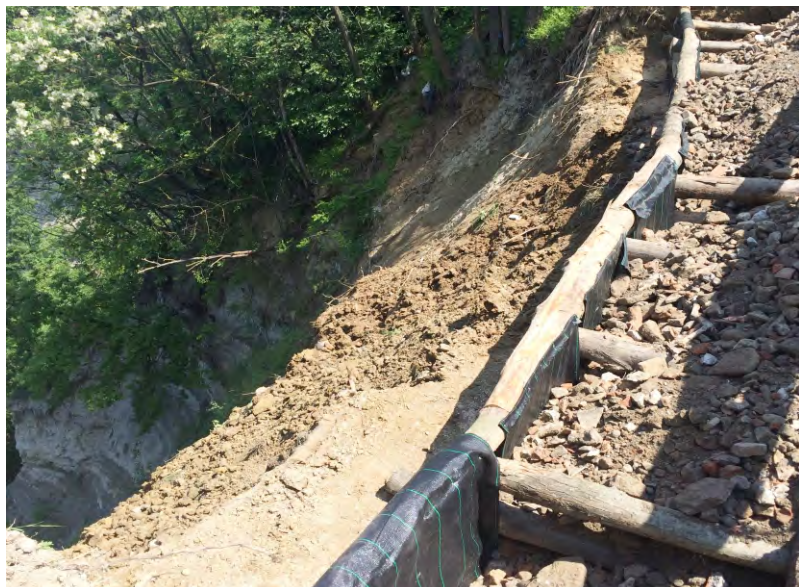
Intervento sulle rocche a San Carlo