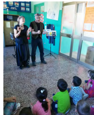
Le letture animate a scuola