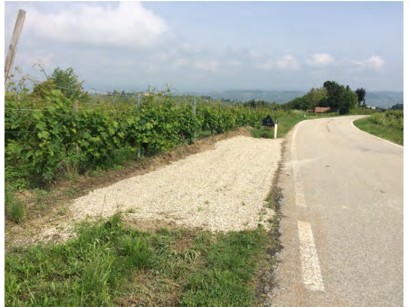
Lavori alle fermate dei bus a San Carlo (2)

l'altra zona di fermata, posta più in basso verso il paese, si è steso uno strato di ghiaia.