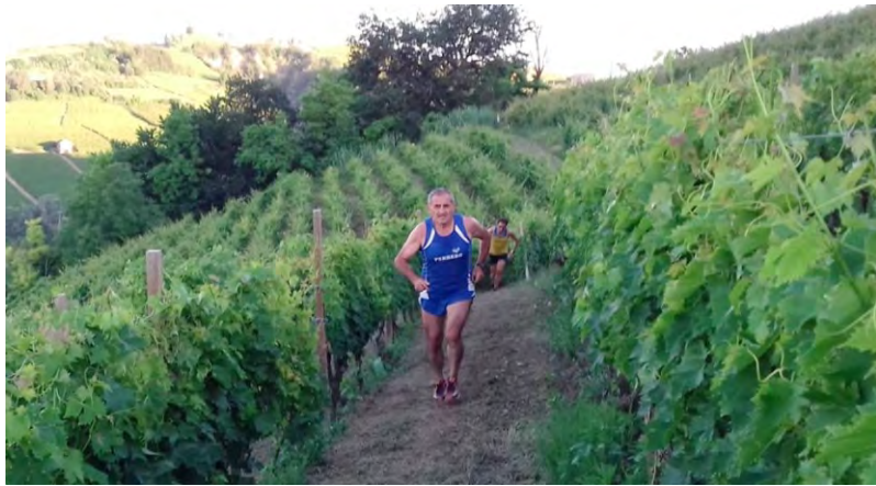
Di corsa tra le vigne