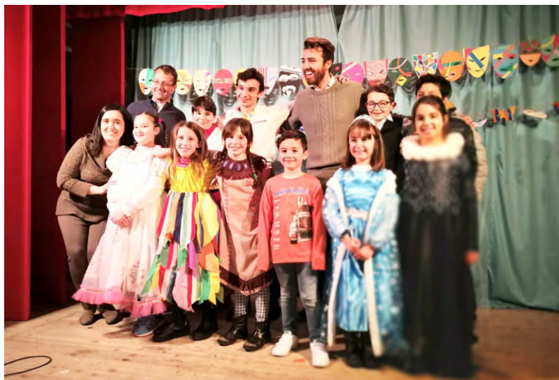
Foto di gruppo del corso di teatro

Domenica 27 maggio ha collaborato con l'Associazione Famigliarmente per la giornata diocesana delle famiglie. Nel suo piccolo il Circolo vorrebbe diventare sempre di più un luogo di incontro, di proposte e di confronto dove tutti, giovani e adulti, possano trovare uno spazio per stare insieme in amicizia. Aspettiamo quindi idee fresche e nuove, soprattutto dai nostri giovani, ai quali possiamo offrire uno spazio adeguato e pronto per tante nuove occasioni.