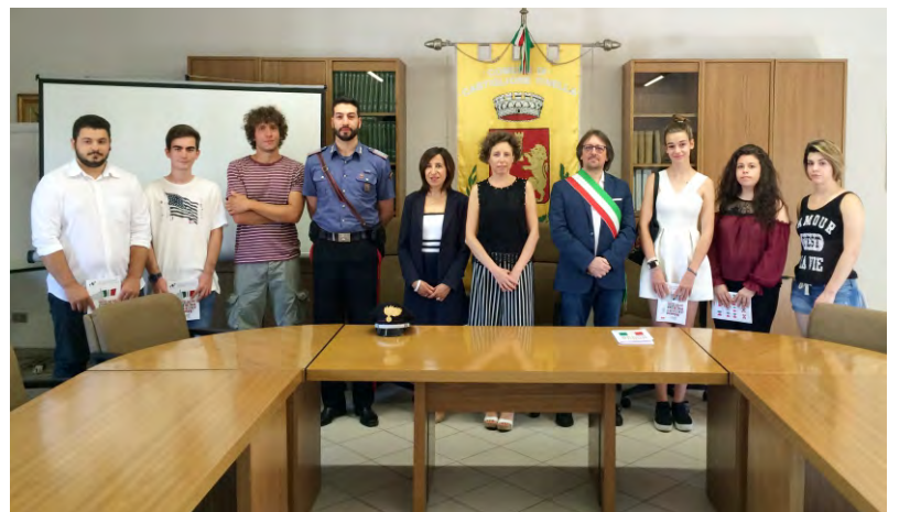
I ragazzi della leva 2000 hanno ricevuto copia della Costituzione