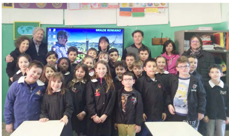
La nuova lavagna elettronica