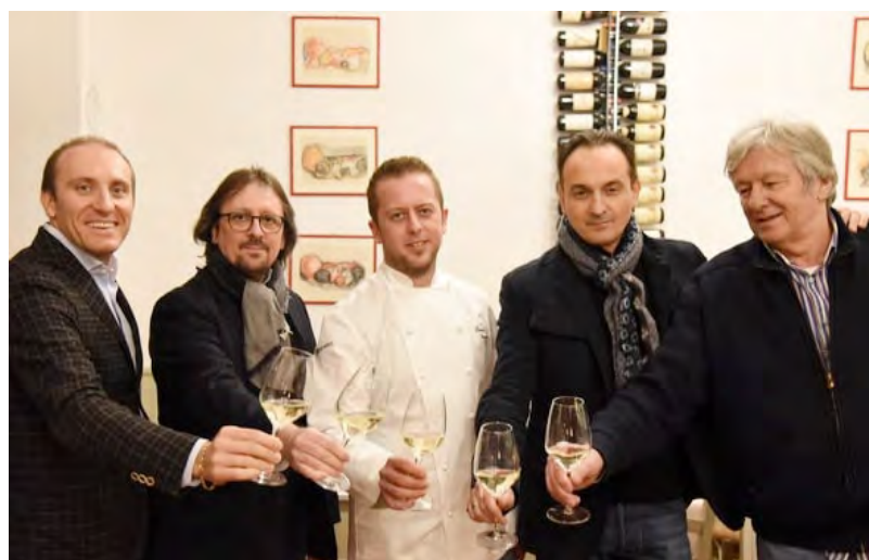
Il brindisi al nuovo progetto