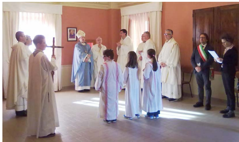
La cerimonia di inaugurazione della sala