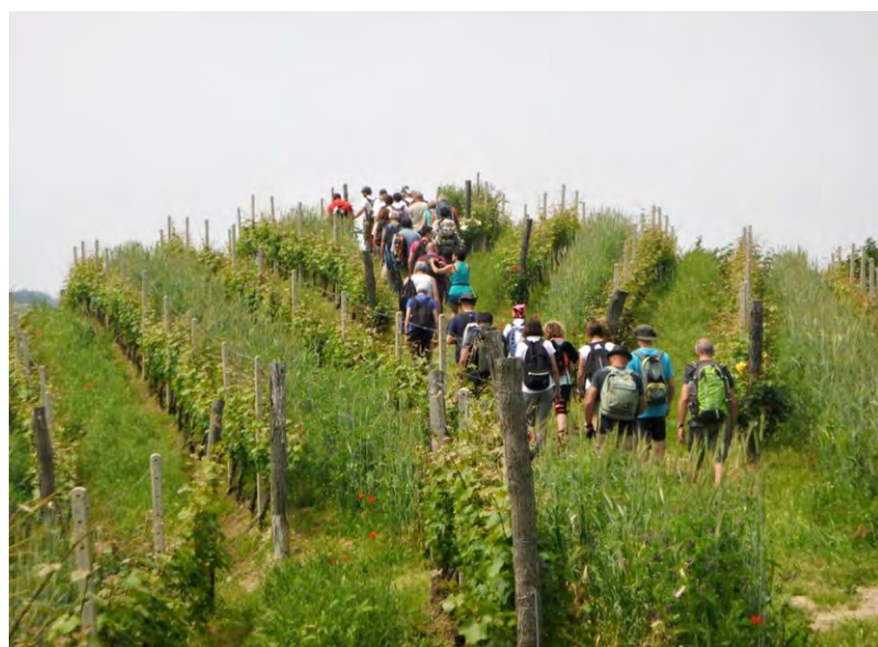
In cammino tra i filari