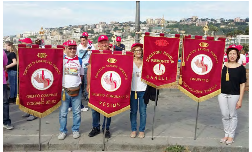
Il raduno nazionale a Napoli

PROSSIME DONAZIONI | DOMENICA 23 SETTEMBRE 2018 presso salone Casa di riposo Sant' Andrea | DOMENICA 23 DICEMBRE 2018