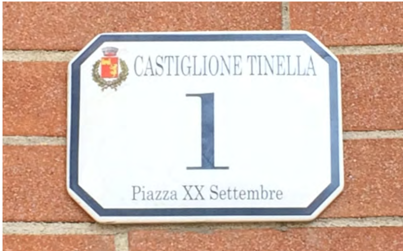
La nuova piastra dei numeri civici

Il sindaco e gli uffici comunali rimangono a disposizione per ogni ulteriore informazione.