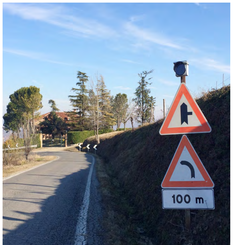
Nuova segnaletica sulla collina dei Brosia