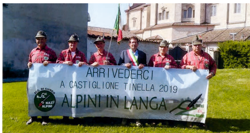
I nostri alpini a Cherasco