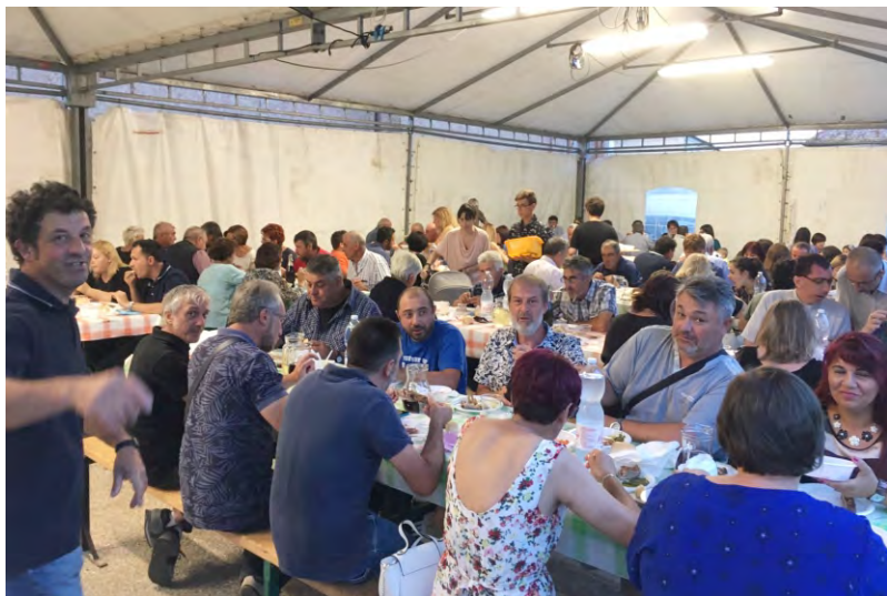
La cena della patronale