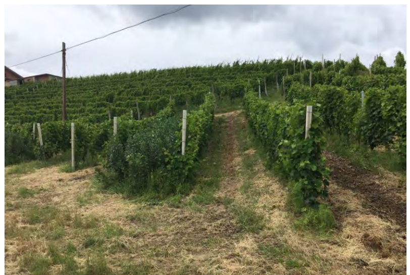
Esempio della pratica del Sovescio

rullate, e quindi interrate. Senza interramento dopo il taglio non si parla di sovescio ma di inerbimento temporaneo: anche in questo caso sarebbe comunque preferibile il taglio "lungo" o la rullatura alla trinciatura, per rallentare la mineralizzazione della sostanza organica e ridurre l'evaporazione dal suolo. Le problematiche che si possono affrontare e risolvere con questa pratica sono molteplici: il denominatore comune è il miglioramento del terreno attraverso la riattivazione dello stesso, quindi maggior vita microbica, con conseguente miglioramento dell'attività radicale, maggior presenza di aria nel suolo, fattore quasi sempre carente a causa del compattamento dovuto all'utilizzo di macchinari, maggior presenza di humus e sostanza organica, fattori essenziali per produzioni di buona qualità. Inoltre altri benefici ormai ben noti e descritti che si possono ottenere con un sovescio sono: contenimento dell'erosione superficiale, contenimento delle malerbe, contenimento di nematodi e funghi patogeni.