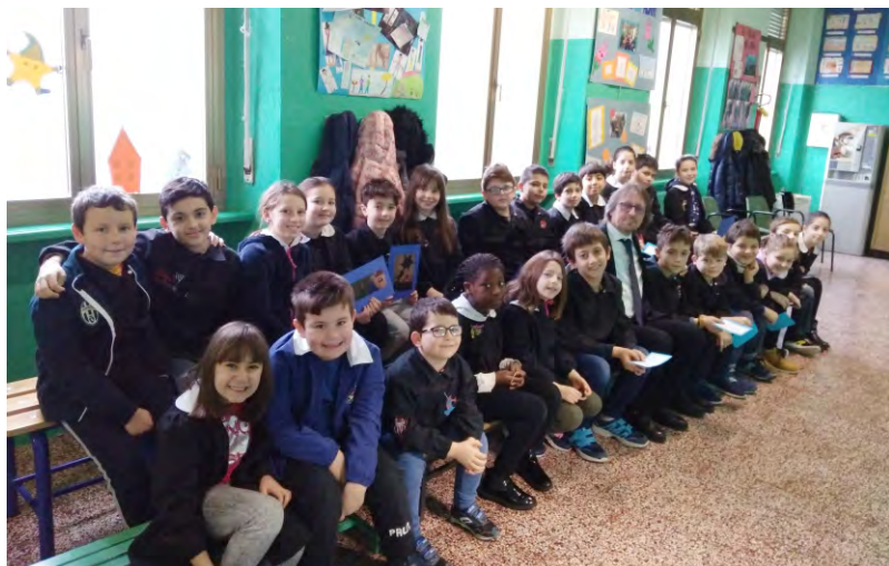
L'appuntamento nel Giorno della Memoria

Proviamo di seguito a delineare, in linea teorica, la giornata tipo del CAM: alle ore 12.45 i bambini raggiungeranno l'educatore nello spazio destinato al