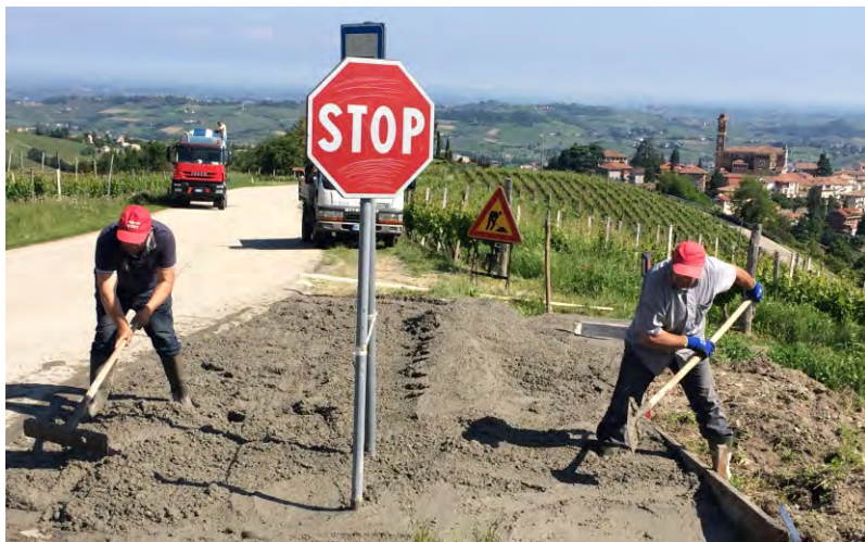
Lavori alle fermate dei bus a San Carlo (1)

Sono state le condizioni meteorologiche che hanno caratterizzato l'inverno e la primavera, la causa dei rallentamenti ai lavori che l'amministrazione comunale ha previsto a San Carlo, per poter mantenere e riposizionare le due aree di fermata del bus sulla strada provinciale. Alla fine però si è riusciti a concludere. Ora le fermate, una sull'andata e una sul ritorno della linea che collega il nostro paese con Alba, sono posizionate in punti visibili, per la sicurezza del servizio. Per le due aree si sono eseguiti lavori approfonditi che hanno contemplato la posa di tubazioni portanti e di altri elementi per la gestione dell'acqua di scorrimento, con una situazione particolarmente delicata in prossimità dell'incrocio tra la strada provinciale 51 e la strada comunale Marini. L'area corrispondente a quest'ultima posizione è stata anche cementata per mantenere stabile il fondo, mentre per