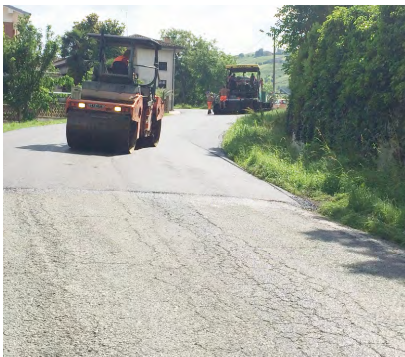
Nuovi asfalti in fraz. Balbi