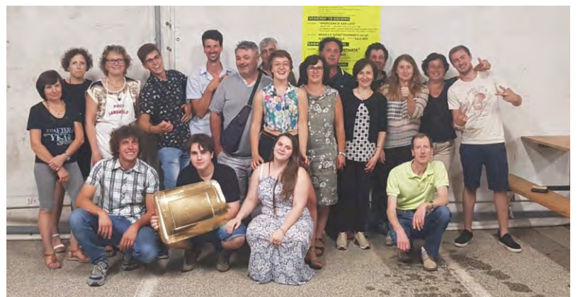
Foto di gruppo

un'ottima serata. Notiamo con piacere la presenza dei giovani di Castiglione. Sabato è ancora di scena la gastronomia con la costinata, una vera delizia per il palato, accompagnata da altre bontà e inaffiata dal buon vino, e bismiamo le presenze di venerdì. In più le serate mangerecce hanno avuto il valore aggiunto della birra artigianale made in Castiglione di "Rolio beer". Il programma della domenica inizia con la consegna della Costituzione ai ragazzi della leva 2000, continua con la Messa in onore del patrono San Luigi e l'aperilonga serale curato dal Don Castillo Café con tanto di musica e ballo libero, che non è andato affatto male. In quest'annata dove tutto è veloce, seppure della durata di quattro giorni, la festa è passata in fretta offrendo molteplici occasioni di aggregazione che, pensiamo, meritavano di essere sfruttate di più. Il nostro gruppo ha lavorato non poco, come sempre coadiuvato dai volontari aggiunti, è stato comunque contento e si è anche divertito.