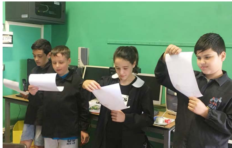
Letture degli alunni della Primaria

L'attivazione del CAM sarà anche un'occasione per creare sinergie e collaborazioni tra i diversi enti territoriali, un'occasione per i ragazzi di un primo contatto con le associazioni presenti sul proprio territorio di residenza con l'obiettivo di accrescere la conoscenza di queste ultime in vista di una futura fruizione. Riteniamo infatti fondamentale, soprattutto all'interno dei piccoli paesi, sensibilizzare i giovani sul rispetto per il territorio di appartenenza, sulla valorizzazione delle proprie radici, in quanto saranno proprio loro "i cittadini di domani".