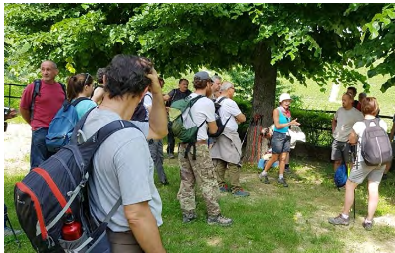
Il gruppo di Terre Alte al Santuario

Domenica 27 maggio l'Associazione Terre Alte di Cortemilia ha organizzato una escursione sui nostri sentieri naturalistici, toccando il Bosco delle Badie, il punto panoramico San Carlo e il Santuario del Buon Consiglio. Alla camminata hanno partecipato una trentina di persone provenienti da diverse parti del Piemonte. A fine giornata, il gruppo ha visitato la mostra fotografica dedicata alla nostra Contessa ed infine ha apprezzato la nostra gastronomia con una merenda sinoira presso la sede della Bottega del vino Moscato.