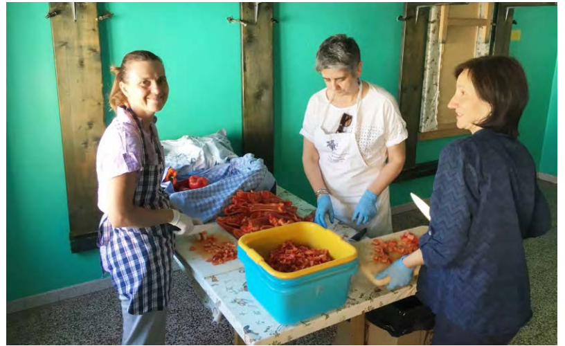
Al lavoro in cucina (1)