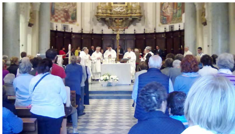
La S. Messa del 26 Aprile

Il Santuario è tuttora in pieno giubileo speciale per i 200 anni dalla posa della prima pietra (1817) che si concluderà domenica 2 settembre 2018. E' un'occasione rara e speciale di riflessione e rinnovamento spirituale offerta a tutti, con la possibilità di attraversare la porta della Misericordia e ottenere l'Indulgenza plenaria. Si fanno incontri di preghiera ogni mercoledì sera e il primo sabato di ogni mese, si accolgono numerosi pellegrinaggi. Vi si trovano pubblicazioni storico-religiose quali "Memoria e profezia" di Padre Emilio, "Ritrova la gioia della fede" e "Il senso di ogni cosa" di Don Filippo. Sono documenti che guidano alla scoperta del luogo e offrono argomenti di riflessione.