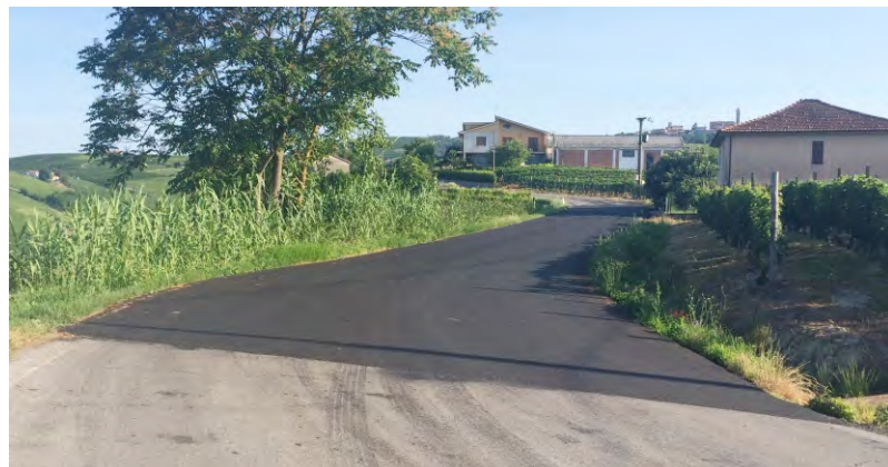
Nuovi asfalti presso la "curva dei Ghiga"