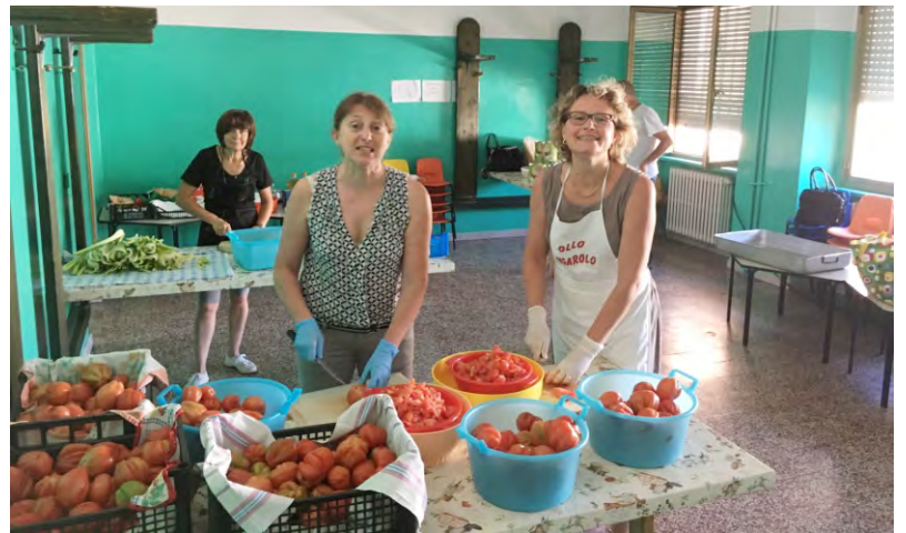
Al lavoro in cucina (2)