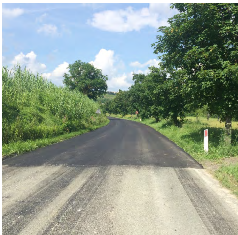
Nuovi asfalti in verso la Valle Tinella