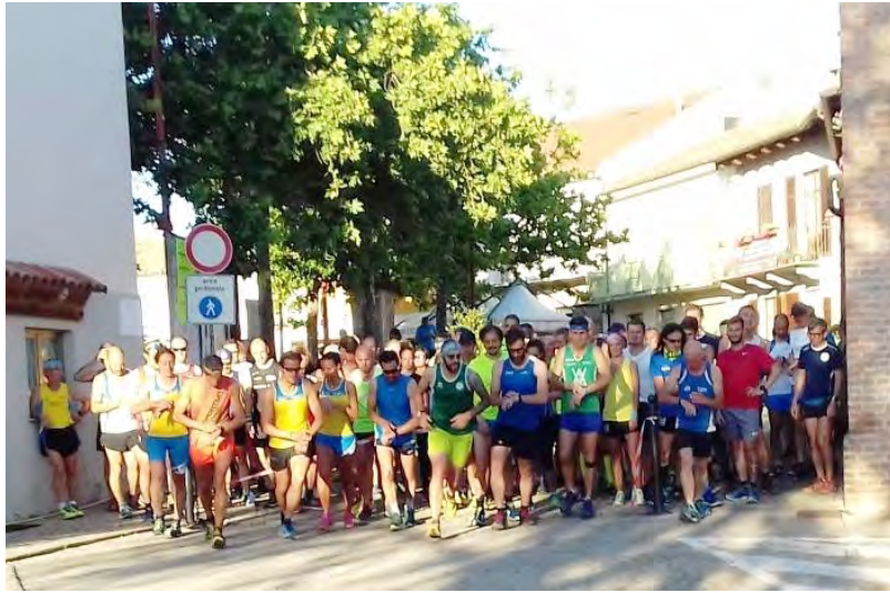
La partenza della gara podistica

Ecco alcune fotografie dei diversi appuntamenti della Festa Patronale di San Luigi che si è svolta dal 14 al 17 giugno.