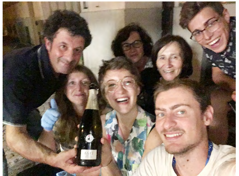
I ragazzi dell'associazione Contessa