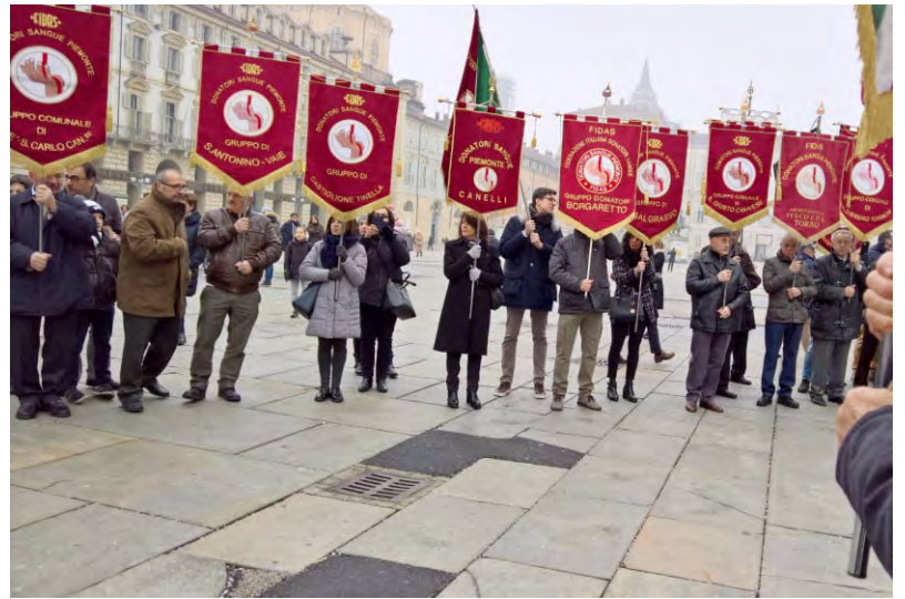
La festa a Torino

E' prevista invece, per il prossimo 22 luglio, la terza edizione di "APERICENA DI MEZZA ESTATE": vi aspettiamo numerosi!