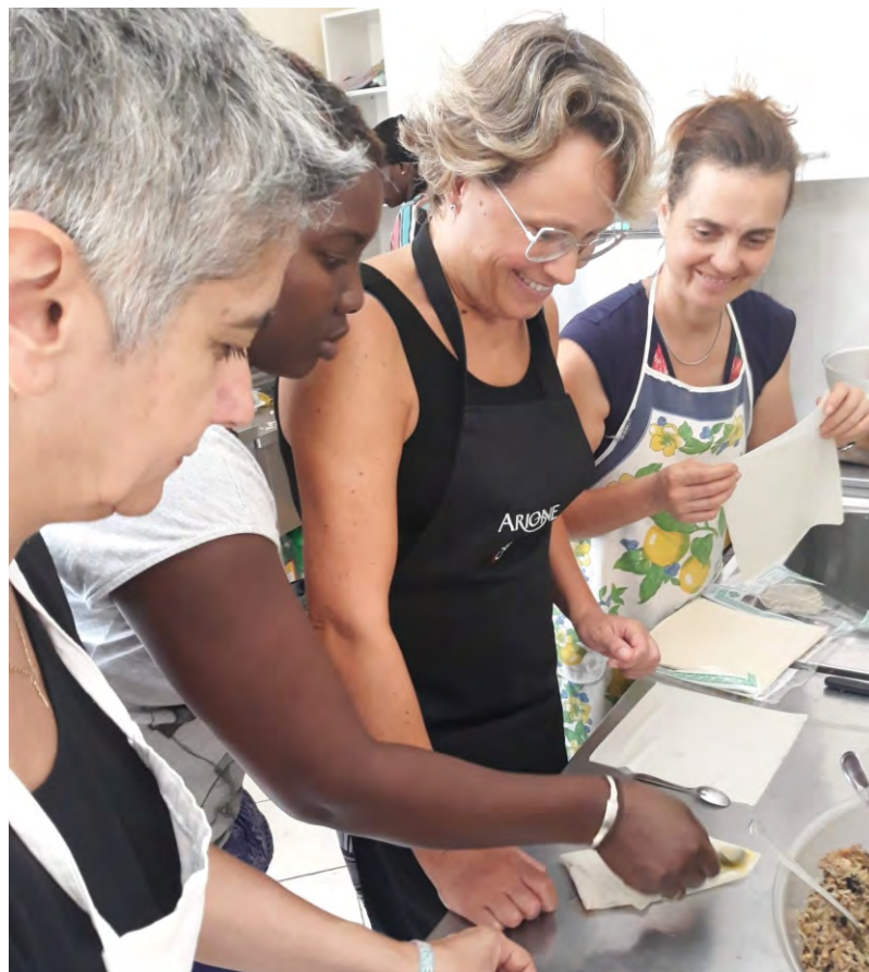
Preparativi della cena senegalese

sostengono, e tutti coloro che si rendono disponibili in vari modi a dare aiuto e supporto per la buona riuscita delle iniziative e per le aperture domenicali. Ricordiamo inoltre che presso il circolo si raccolgono le adesioni per il tesseramento soci 2020, importante per poter partecipare a tutte le iniziative.