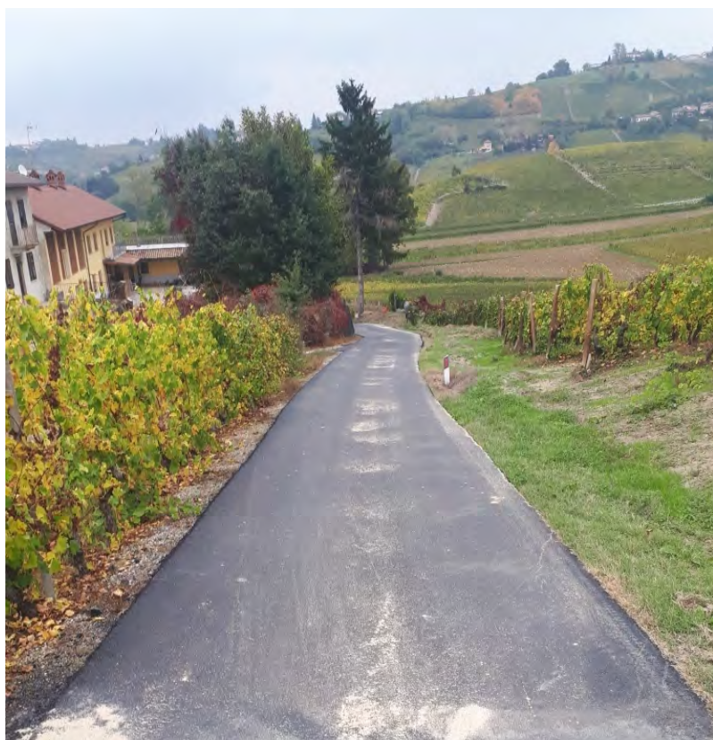
Nuovo asfalto in via Ghiga