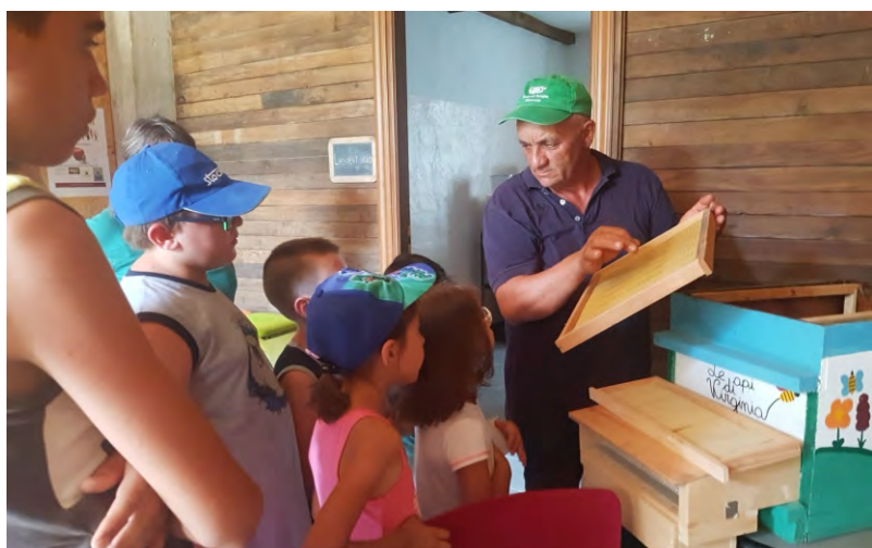
I bambini di estate ragazzi a "Le Api di Virginia"

L'estate dei nostri bambini e ragazzi è stata animata da una bella iniziativa organizzata dal comune in collaborazione con l'associazione RDR (che già gestisce il doposcuola). Dal 9 giugno e per 5 settimane è stato messo a disposizione delle famiglie un servizio di estate ragazzi, durante il quale educatrici qualificate organizzavano attività ricreative ed aiutavano i bambini con lo svolgimento dei compiti delle vacanze. Tante e molto varie sono state le attività svolte nel corso di questo periodo. Ogni settimana aveva un suo tema che veniva approfondito collaborando con le realtà locali, i bambini hanno imparato a seminare e a far crescere pianticelle, con la collaborazione di un prezioso