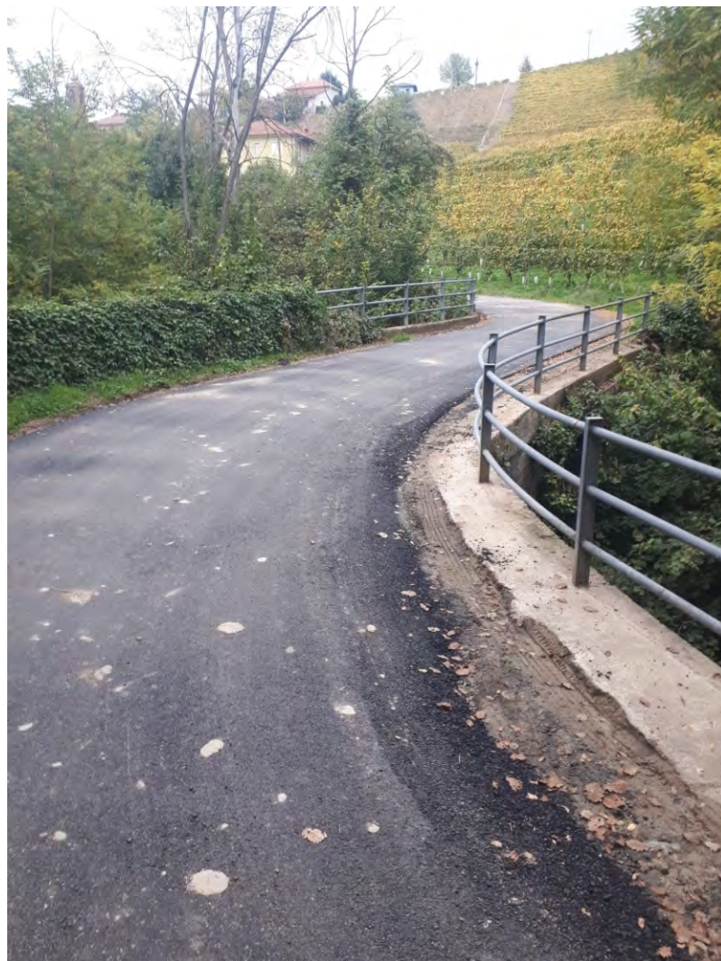
Nuovo asfalto in via Rittano