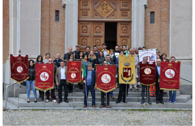
Foto di gruppo della festa sociale