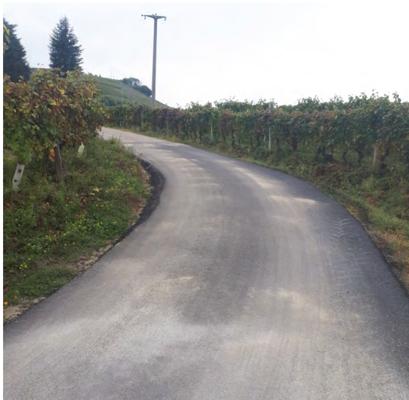
Nuovo asfalto in via Balbi

Come annunciato nei mesi scorsi, si sono infine compiuti diversi importanti interventi che hanno interessato la proprietà comunale. Grazie ai fondi ottenuti ed anche l'applicazione di una parte dell'avanzo di amministrazione, si sono stesi nuovi asfalti in diversi tratti di strada comunale, si sono ripristinate sponde e ripassati tutti i fossi, ed infine si già è potuto eliminare buona parte dell'amianto presente nelle coperture del nostro cimitero. Per quanto riguarda la videosorveglianza, in attesa del posizionamento del "varco" di San Bovo, è già stata installata una nuova telecamera di contesto destinata a monitorare la parte posteriore del palazzo comunale. Intanto nei nostri uffici si stanno sviluppando gli altri due grandi progetti in corso che interessano l'Area Balbi e l'antica parrocchiale. Per quanto riguarda, infine, l'operazione relativa alla numerazione civica e alla toponomastica, saranno presto posizionate le nuove indicazioni e, nell'ambito del completamento delle azioni burocratiche si ricorda qui a tutte le famiglie castiglionesi di comunicare al proprio gestore di energia elettrica il nuovo indirizzo assegnato.