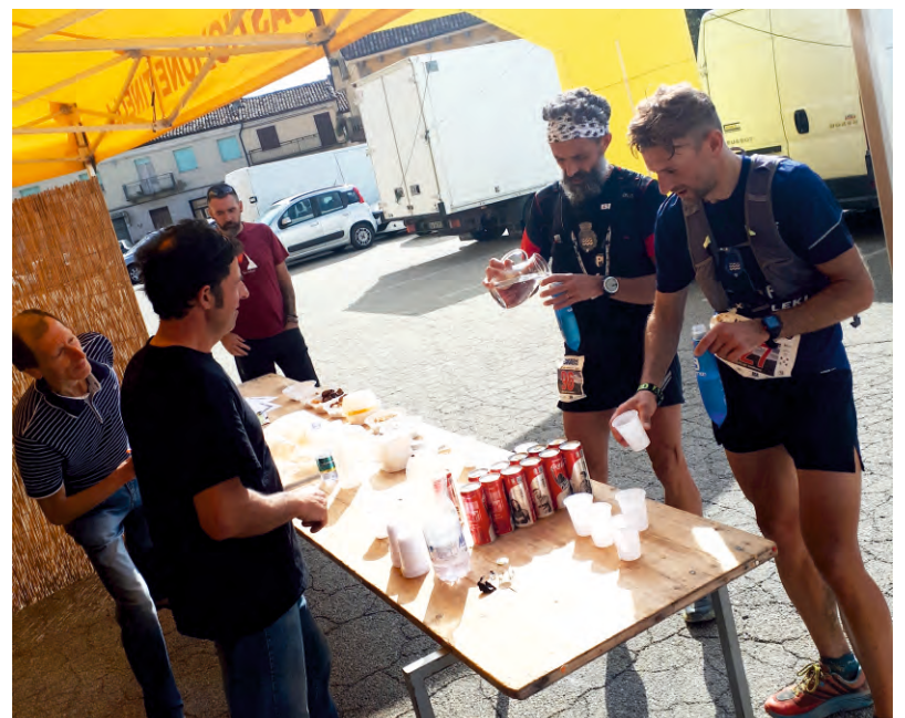
I ragazzi dell'Associazione al lavoro