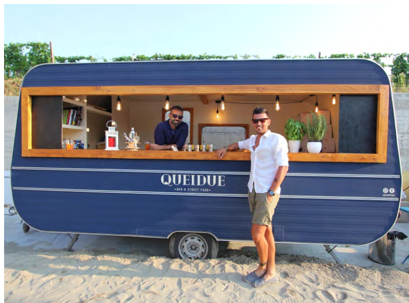
La prima uscita di "Queidue"