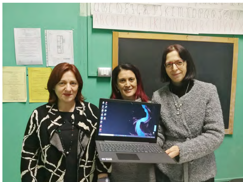
Le maestre con il nuovo computer