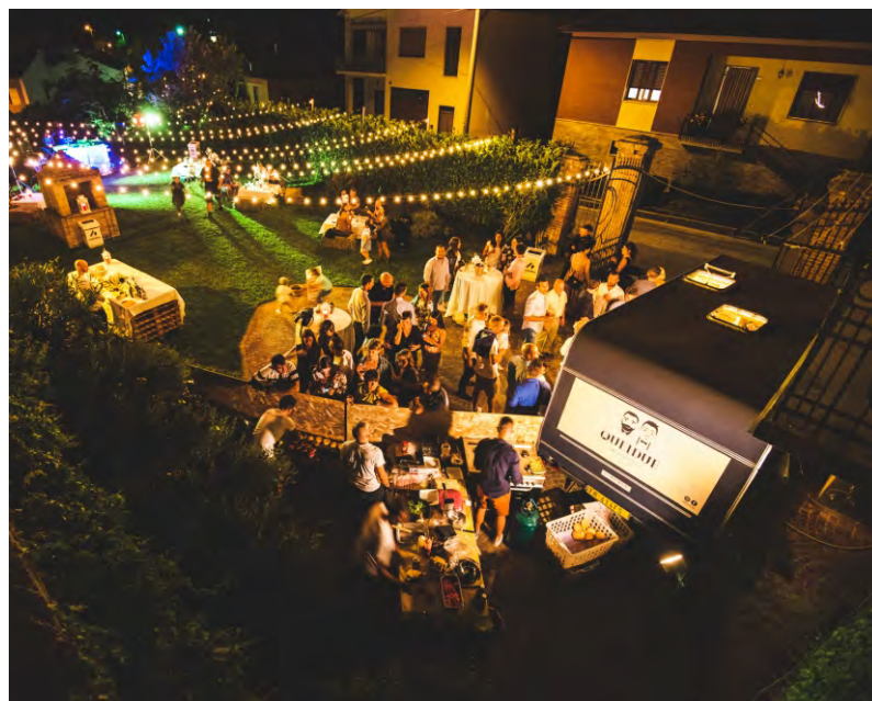
"Queidue" in festa