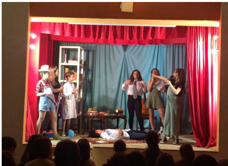
Spettacolo teatrale organizzato dagli educatori di estate ragazzi