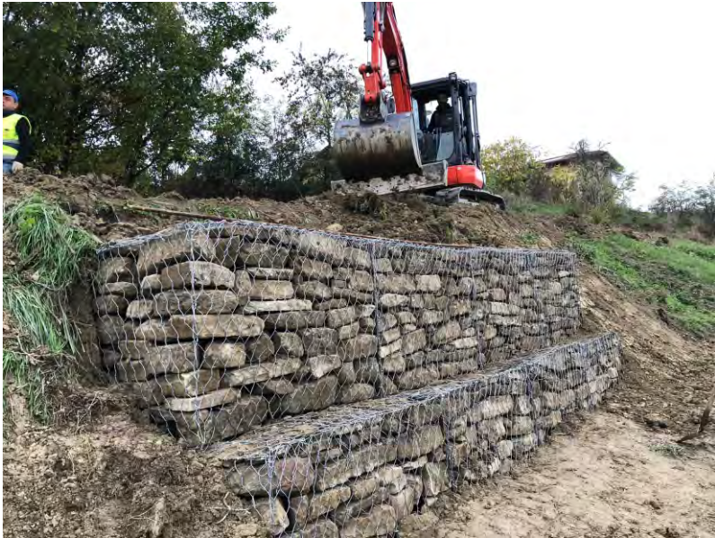
Massiccata in Via Manzotti