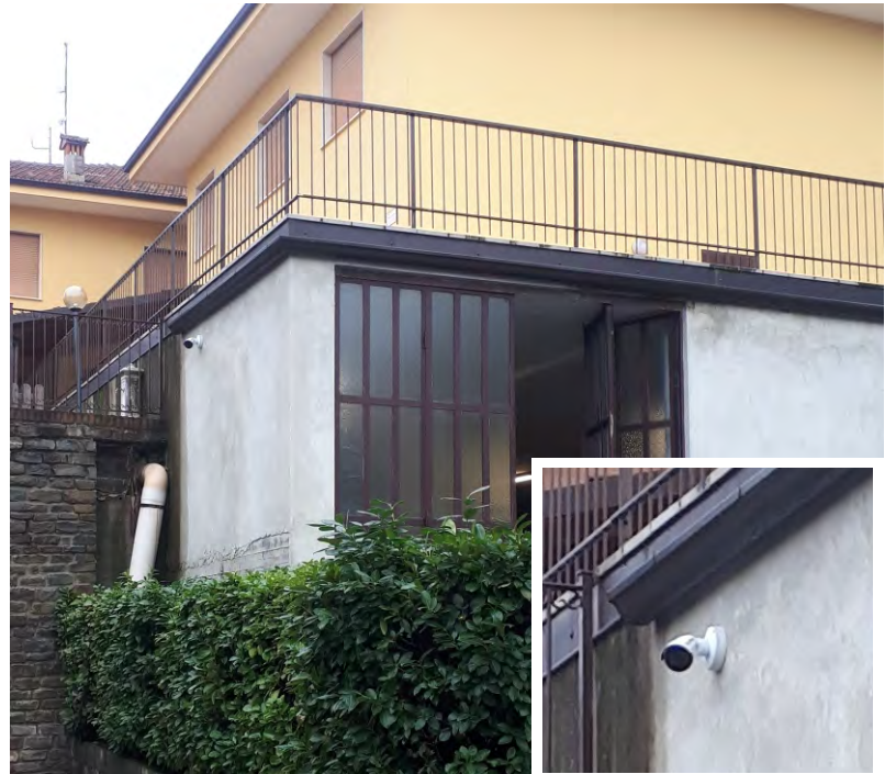
Nuova telecamera di contesto