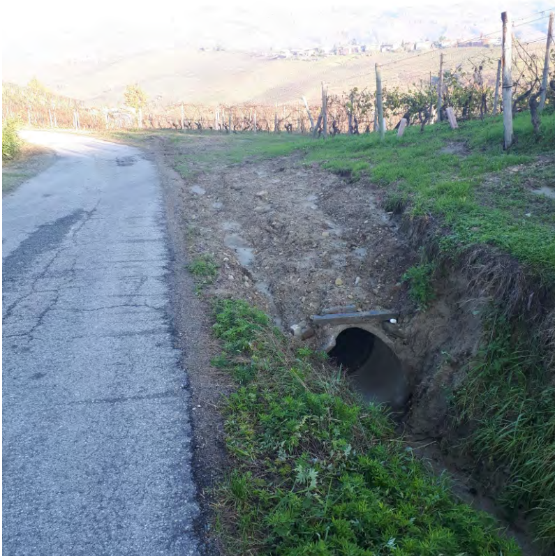
Nuova tubazione in Via Balbo