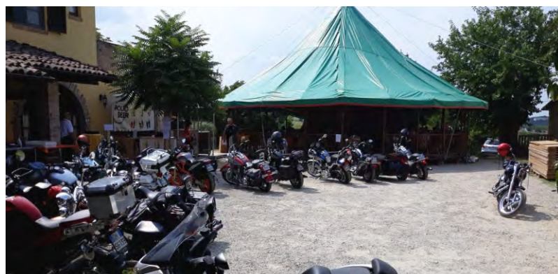
Il ballo a palchetto di festa San Martino