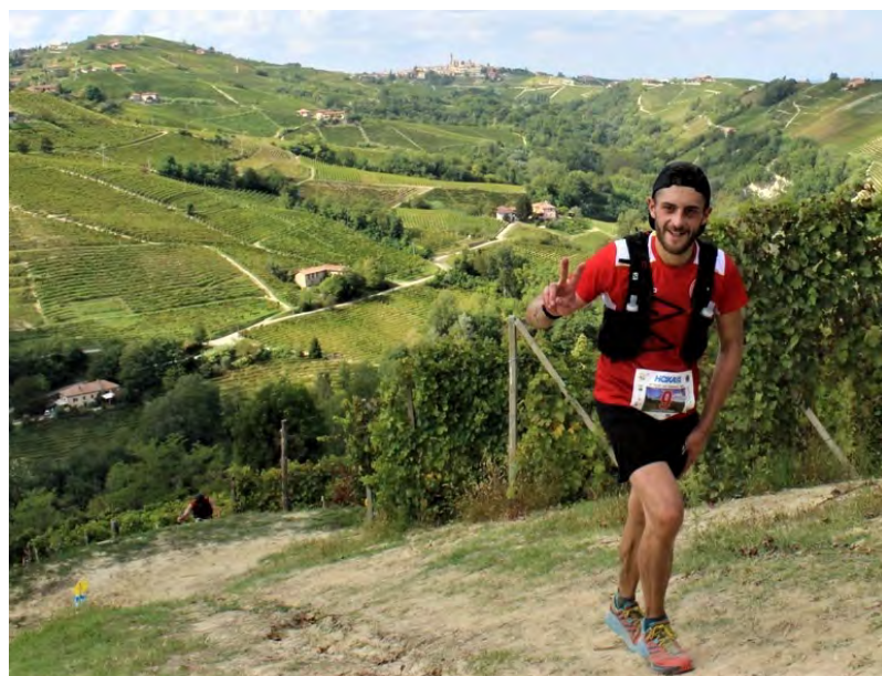
Momenti dal Trail del Moscato