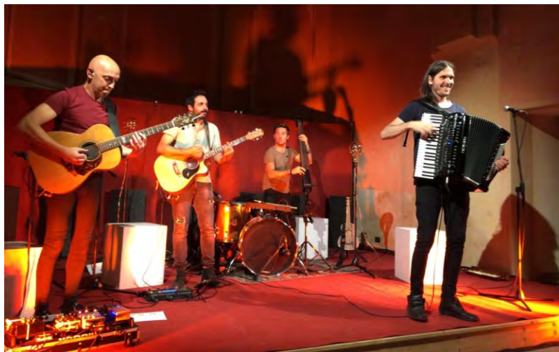
Magasin du Cafè

Anche l'estate di quest'anno è stata animata dagli appuntamenti sempre attesi da un numeroso pubblico. La rassegna Un Palco tra le Vigne ha offerto la grande musica dei Magasin du Café, dell'Alter Echo String Quartet e degli Amemanera.