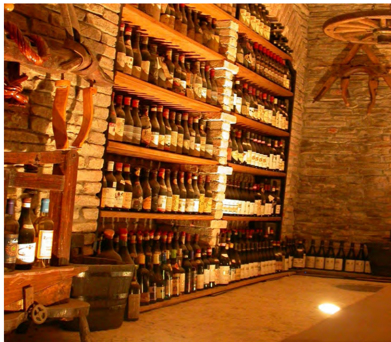
Piccolo museo cantina Arfinengo