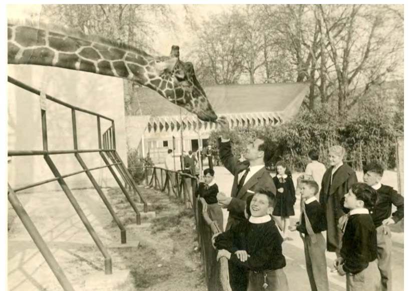
Foto ricordo della visita allo zoo

Questo scritto è dedicato agli scolari della frazione Brosia, ora papà e nonni - AUGURI