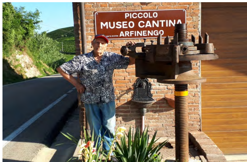
La nuova insegna

Il Piccolo Museo-Cantina Arfinengo ha il suo nuovo cartello indicatorio, installato sui due lati della strada provinciale che ci lega al territorio di Valdivilla. La famiglia Arfinengo ha voluto così facilitare l'indicazione alla visita di questo storico e curioso allestimento che fa parte dell'offerta rivolta ai visitatori che ci raggiungono, già spesso ricercato dai turisti ed interessante elemento di valorizzazione della nostra terra.