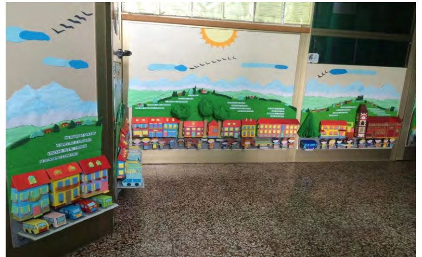
Plastico verticale della piazza creato dalla maestra Giovanna Manzo