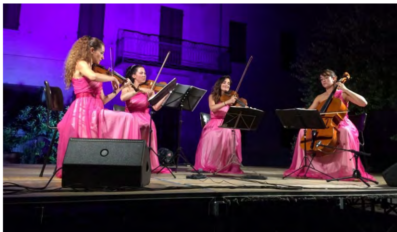
Alter Echo String Quartet