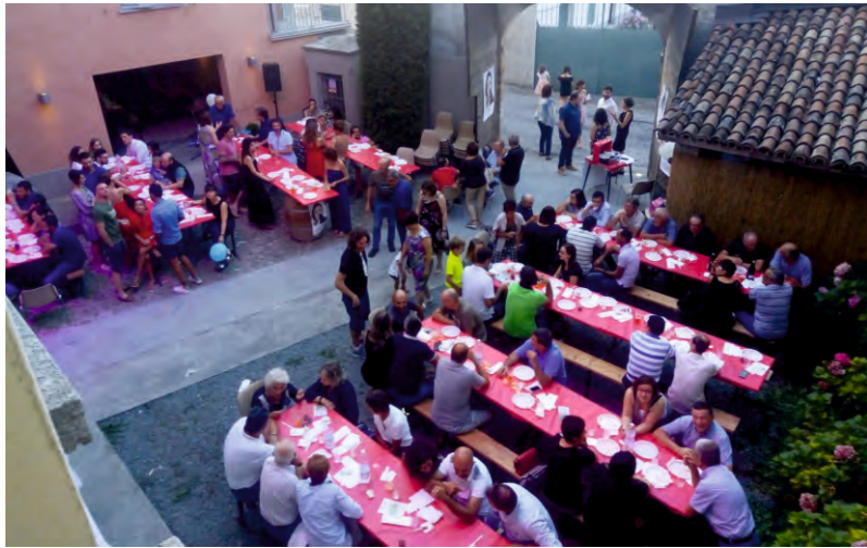
Apericena di mezza estate