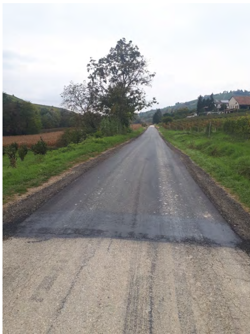
Nuovo asfalto in via Valle Bera