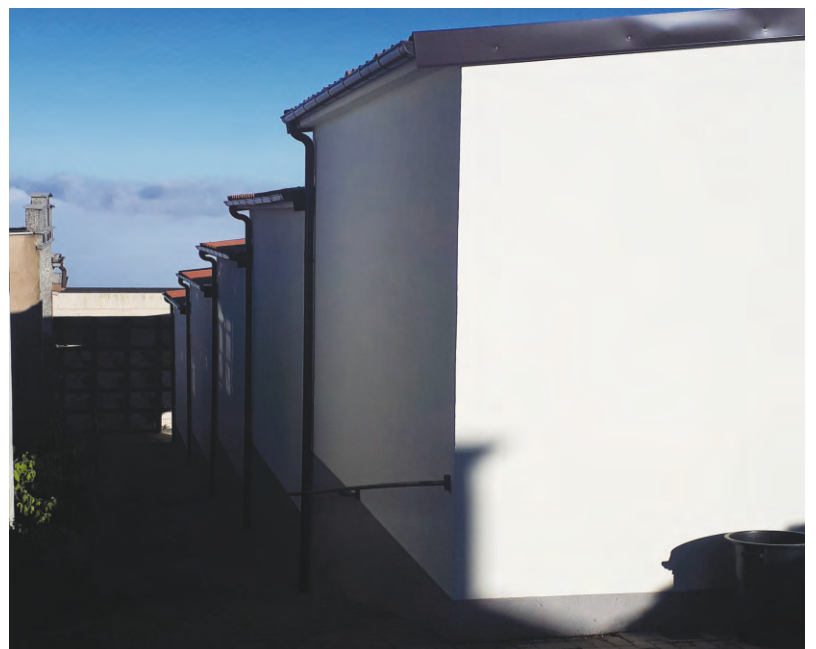
Nuovi faldali al cimitero