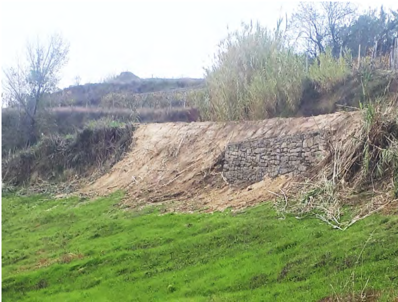
Massiccata in Via Marini