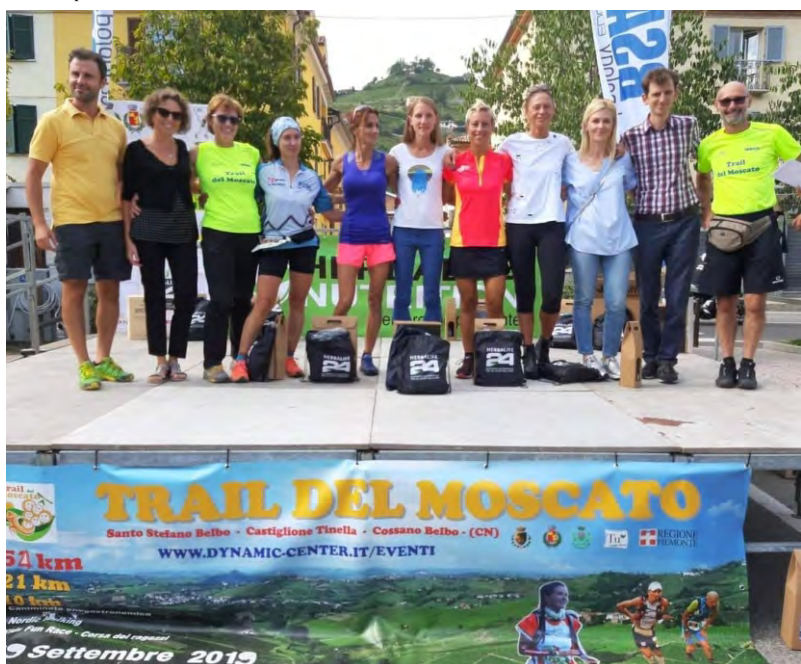
Premiazione Trail del Moscato