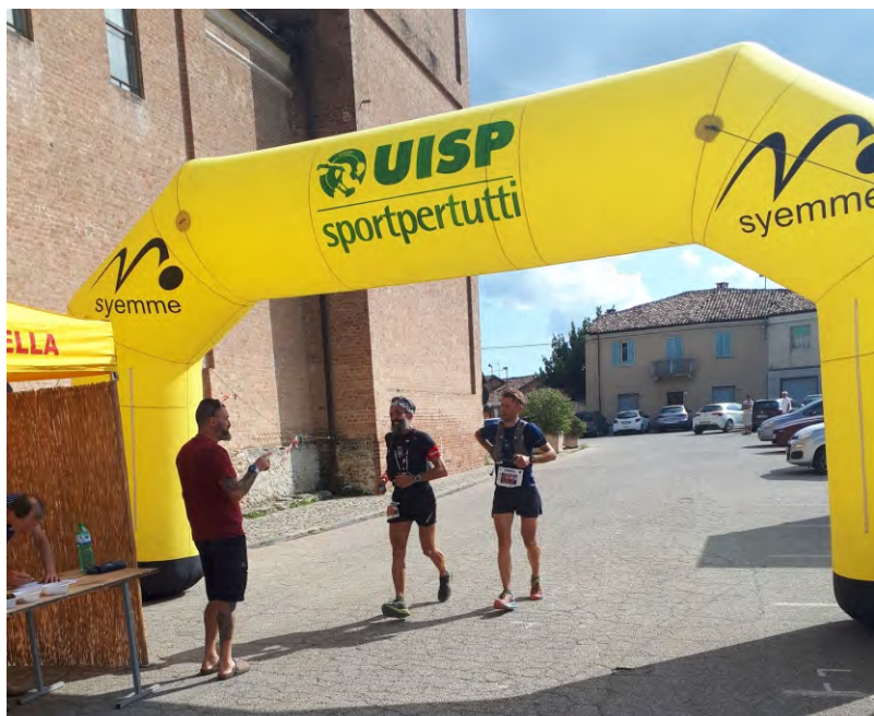
Partecipanti alla corsa