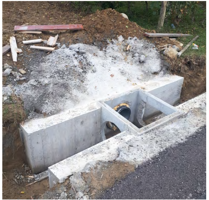
Nuova tubazione realizzata da privati in Valle Bera