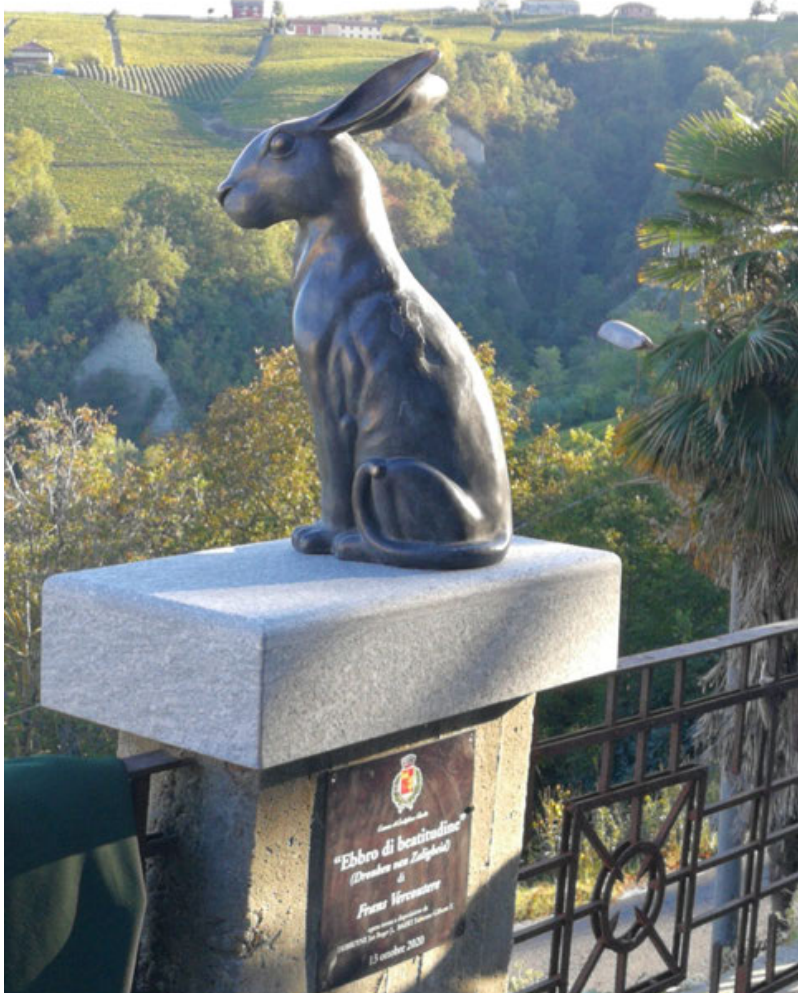
L'opera in via Cavour