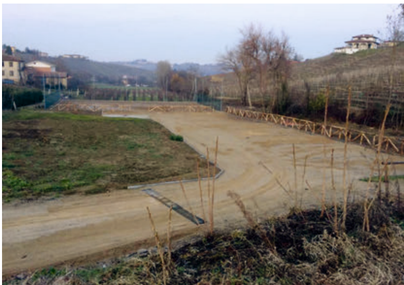
L'area turistico-sportiva ai Balbi