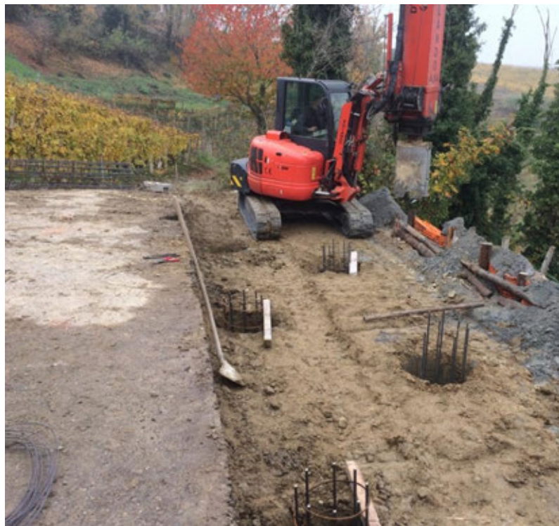
Lavori per la frana al cimitero

Gli impegni più prossimi riguardano la posa degli ultimi elementi della nuova segnaletica stradale, l'ulteriore sviluppo del progetto di videosorveglianza con l'installazione di una telecamera ad alta definizione a San Carlo (8.000 euro dalle casse comunali), il ripristino della frana presente su via Valle Bera con un contributo regionale di 50.000 euro già stanziato e il progetto già approvato; la sostituzione degli infissi all'edificio delle ex scuole ai Balbi (oltre 19.000 euro dallo Stato) e la sistemazione di segnaletica promozionale dedicata al territorio del Moscato e al Consorzio di riferimento.