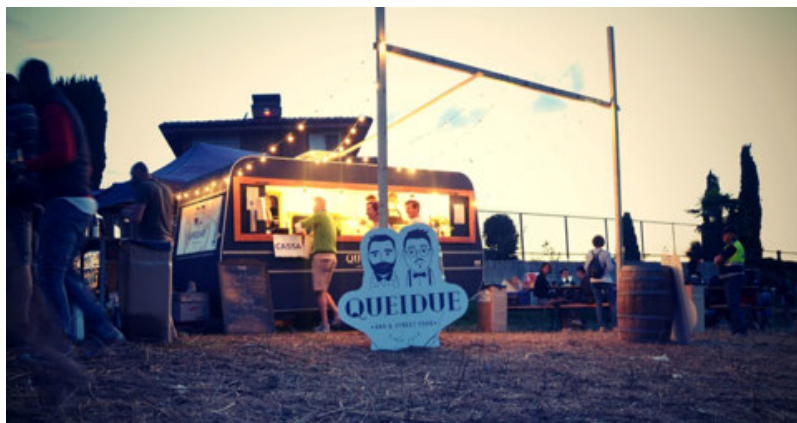
Il punto ristoro a "Crava"