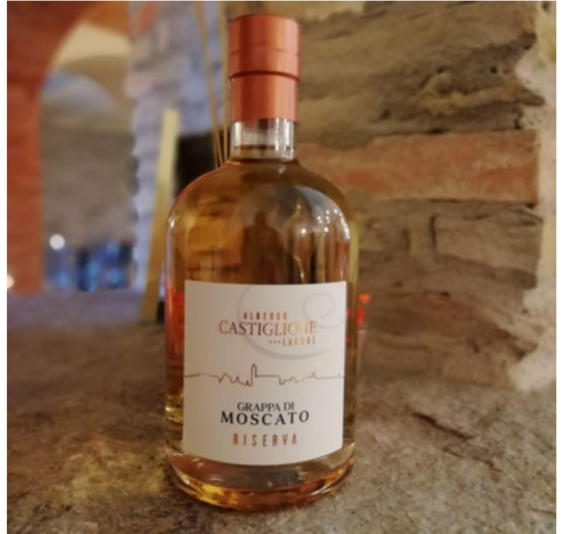
La bottiglia di grappa