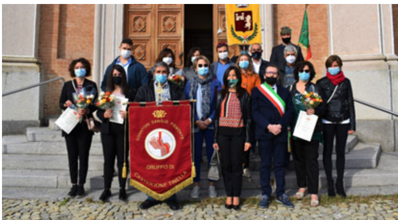
Foto di gruppo

PROSSIME DONAZIONI | DOMENICA 21 MARZO 2021 presso salone Casa di riposo Sant' Andrea | DOMENICA 20 GIUGNO 2021