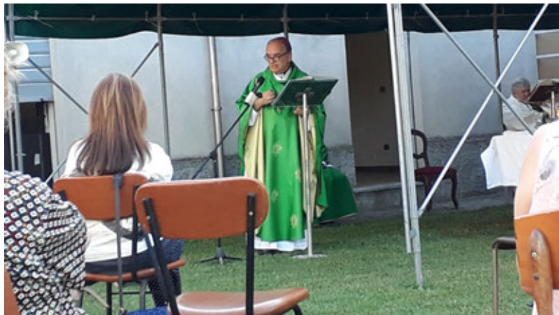
Il Vescovo Marco Brunetti

Nell'estate sono terminati i lavori di restauro conservativo dei pilastri e della volta. Dopo la necessaria pulizia straordinaria dei locali, sistemati i banchi, possiamo ammirare l'interno negli originali colori dell'ottocento, di pregevole semplicità e bellezza. I restauratori hanno semplicemente rimosso gli strati di pittura successivi e le superfici sembrano dipinte ieri. Prossimamente, dopo le feste natalizie, imprevisti e Covid permettendo, inizierà la seconda parte di interventi, già progettati e approvati, con i quali saranno realizzati i nuovi bagni nello spazio esterno lato Castiglione, e saranno rinnovati il teatro (che resterà teatro), il disimpegno vetrato, il salone e il negozio dei ricordini. Comprenderanno anche migliorie all'impianto di riscaldamento, dotazioni multimediali, laboratori attrezzati. Il nostro Santuario sarà più bello, più moderno, più funzionale e accogliente, per noi e per i pellegrini che da sempre lo frequentano. Almeno fino a quando le limitazioni agli spostamenti derivanti dall'epidemia di Covid-19 hanno sconvolto le relazioni tra gli uomini. Stiamo