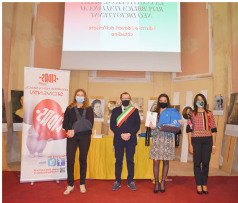
Un momento della consegna

Non è mancato neanche quest'anno il momento istituzionale della consegna di una copia della Costituzione Italiana ai nuovi diciottenni castiglionesi. Vista la mancata occasione della Festa Patronale di San Luigi, annullata a causa della pandemia, come tutti gli altri tradizionali eventi, si è trovato il giusto momento all'interno della Festa Sociale del nostro Gruppo Fidas, avvenuta domenica 11 ottobre, considerando che anche che lo stesso direttivo Fidas offre sempre un dono ai giovani ragazzi: uno zaino che contiene tra le altre cose anche il messaggio di sensibilizzazione alla donazione del sangue. Elettraservice ha curato per l'occasione la presentazione video che ha proposto anche le parole di Piero Calamandrei, uno dei Padri fondatori.