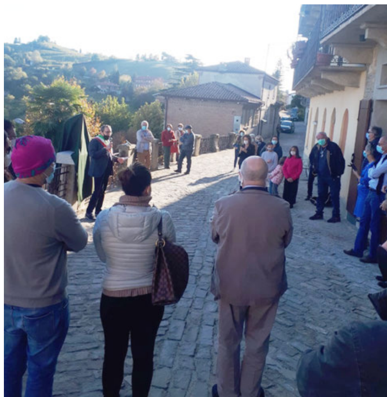
Un momento dell'inaugurazione