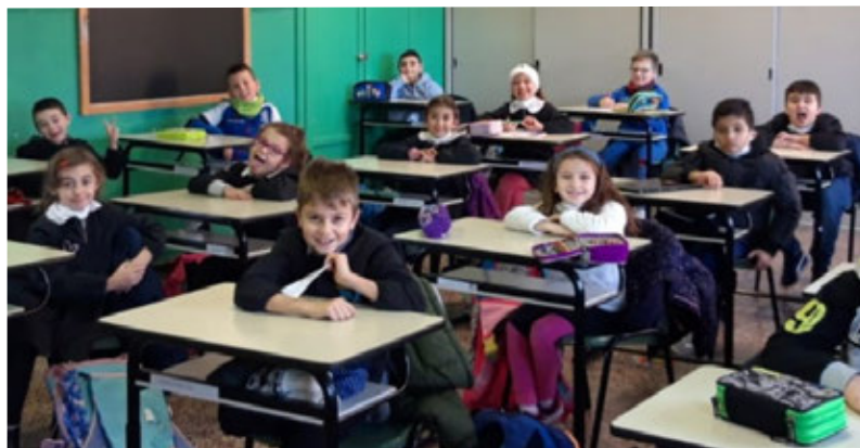
Gli alunni in aula

Un'altra grande novità dal mondo della scuola è legata al cambiamento della ditta che gestisce la mensa. Purtroppo, a causa di norme stringenti legate all'emergenza sanitaria, non abbiamo potuto mantenere la collaborazione con il gruppo GMR. È subentrato un nuovo fornitore: la ditta GMI RISTORAZIONE, col quale speriamo di poter avere una collaborazione altrettanto proficua.