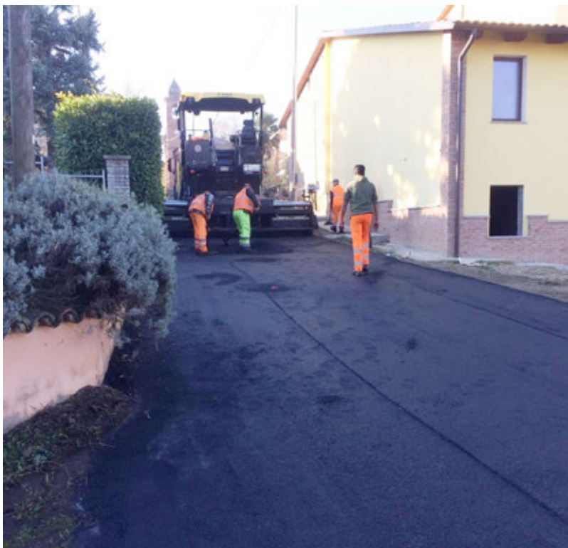
Nuovi asfalti a San Martino