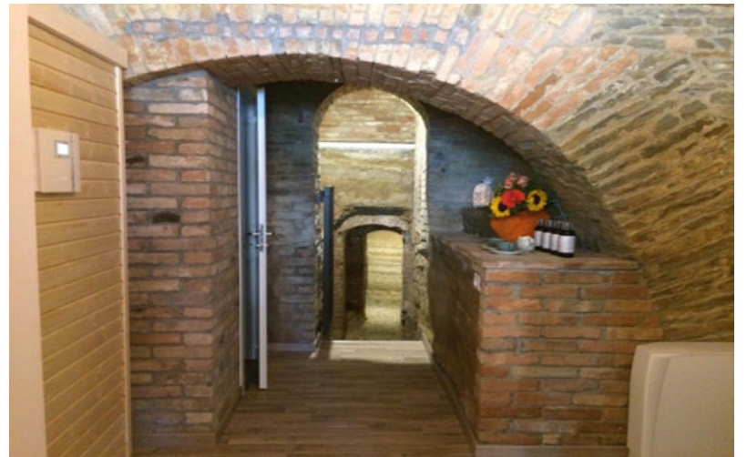
Particolare del centro benessere

buon lavoro e di grande successo, con la speranza che al più presto possano lavorare in serenità. Su richiesta viene anche fornito servizio a domicilio. Info: tel. 349.2239671 - su Facebook Benessere in Langa.