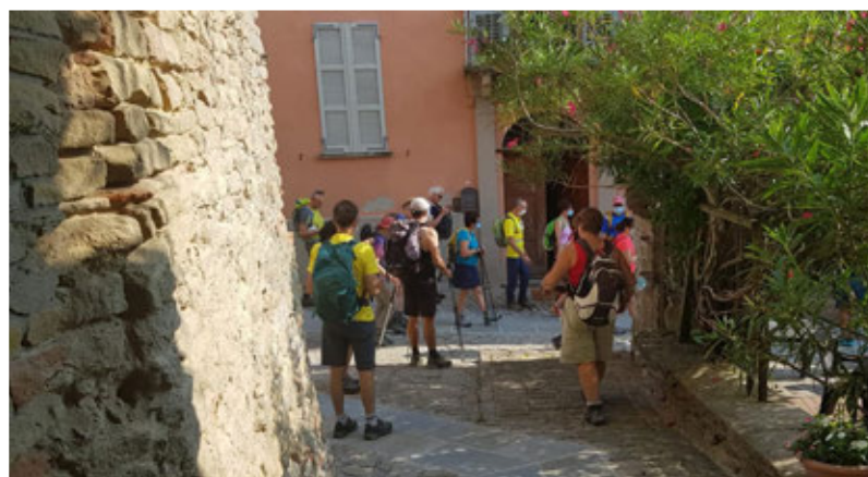
I camminatori all'Osteria Verderame

panoramici del territorio, citato dalle prestigiose guide del Touring Club: la chiesetta di San Carlo. Al termine dell'escursione, è stata prevista una merenda presso l'Osteria Verderame. L'escursione si è svolta secondo i termini di legge per la sicurezza Covid-19. Ogni partecipante aveva - da utilizzare nei momenti opportuni - le mascherine, gel disinfettante e una biro per la firma del modulo.