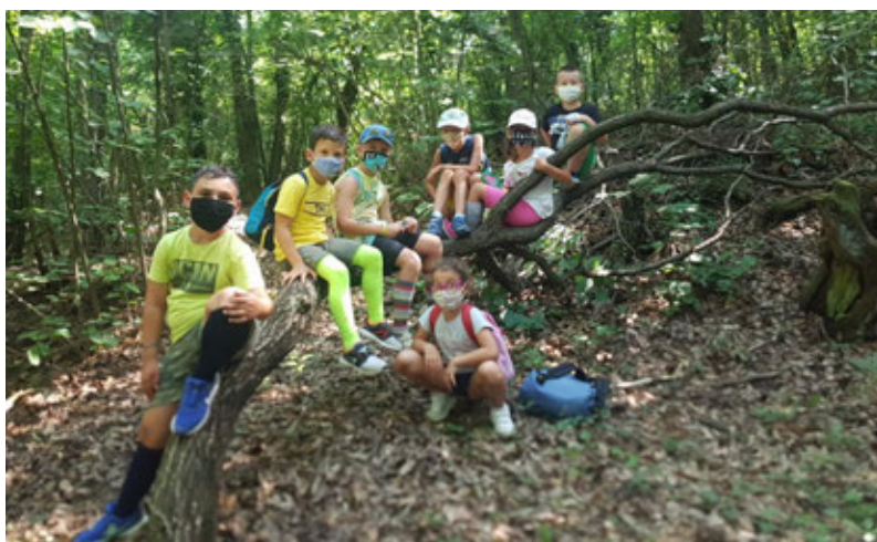
I bambini nel Bosco delle Badie