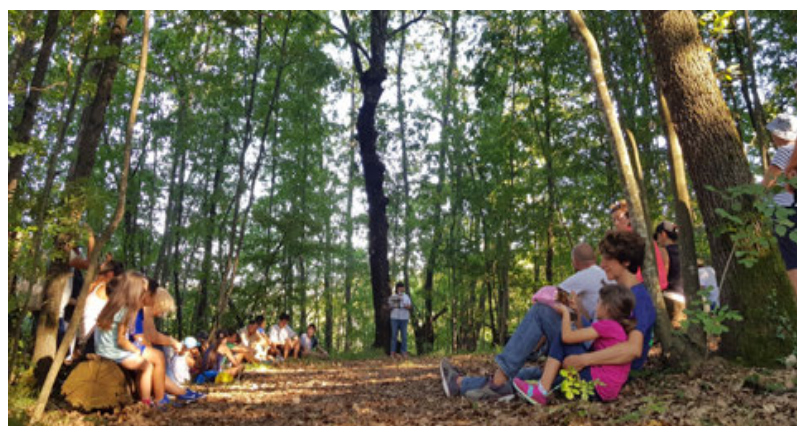
La camminata nel bosco