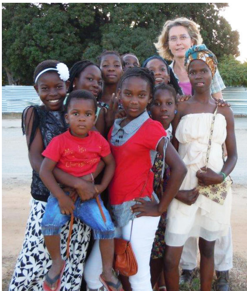
Piera in terra d'Africa