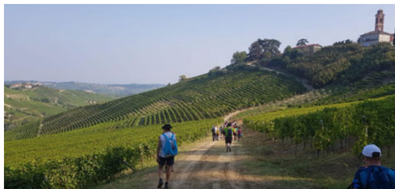
In cammino tra i vigneti

panoramici del territorio, citato dalle prestigiose guide del Touring Club: la chiesetta di San Carlo. Al termine dell'escursione, è stata prevista una merenda presso l'Osteria Verderame. L'escursione si è svolta secondo i termini di legge per la sicurezza Covid-19. Ogni partecipante aveva - da utilizzare nei momenti opportuni - le mascherine, gel disinfettante e una biro per la firma del modulo.