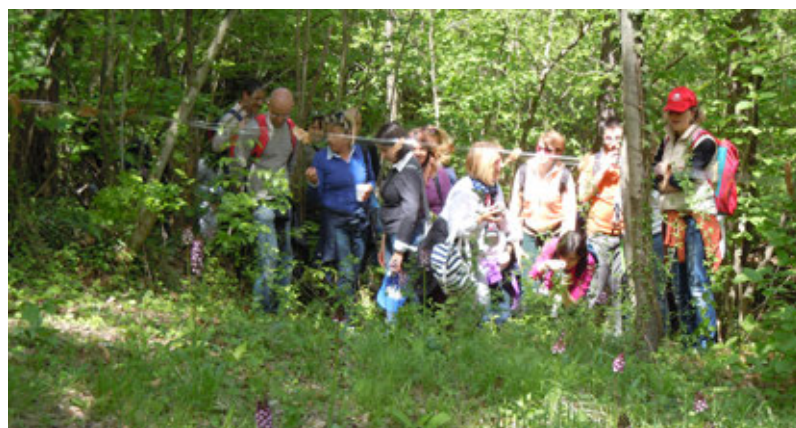
La visita al sito

questi splendidi fiori di cui sappiamo che le Langhe ospitano più di quaranta specie. Il progetto europeo LIFEorchids, cofinanziato dall'Unione Europea nell'ambito del programma Life Natura, è coordinato dall'Università di Torino e ha come partner l'Università di Genova, il Parco di Portofino, il Parco del Po vercellese-alessandrino, il CREA-OF di Sanremo, la Czech Union for Nature Conservation (CSOP) e la Legambiente Lombardia. Lo scopo del progetto LIFEorchids è quello di contrastare l'attuale declino di orchidee spontanee, tipiche di praterie che mantengono le loro caratteristiche di biodiversità solo se gestite dall'uomo, ad esempio attraverso lo sfalcio e il pascolo. In assenza di tali cure l'habitat è destinato a scomparire, perché prendono il sopravvento specie arbustive ed arboree che escludono le orchidee. Il nostro Comune non poteva rimanere indifferente di fronte a questa iniziativa, considerando che da diversi anni si occupa già, insieme a Associazione Contessa di Castiglione e Bottega del vino Moscato, di promuovere queste bellezze naturali attraverso l'evento annuale "Il Giorno delle Orchidee"; inoltre, il percorso del nostro sentiero verde Bruno Arione attraversa il Bosco delle Badie, dove è presente una importante concentrazione di Orchis Purpurea, diventando un bellissimo strumento per raggiungere il sito, dove si deve però agire anche per la tutela e la conservazione di questi fiori.