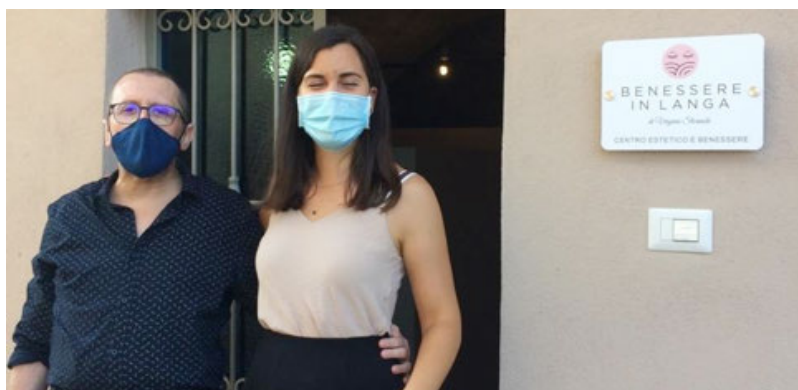
Virginia con il sindaco il giorno dell'inaugurazione