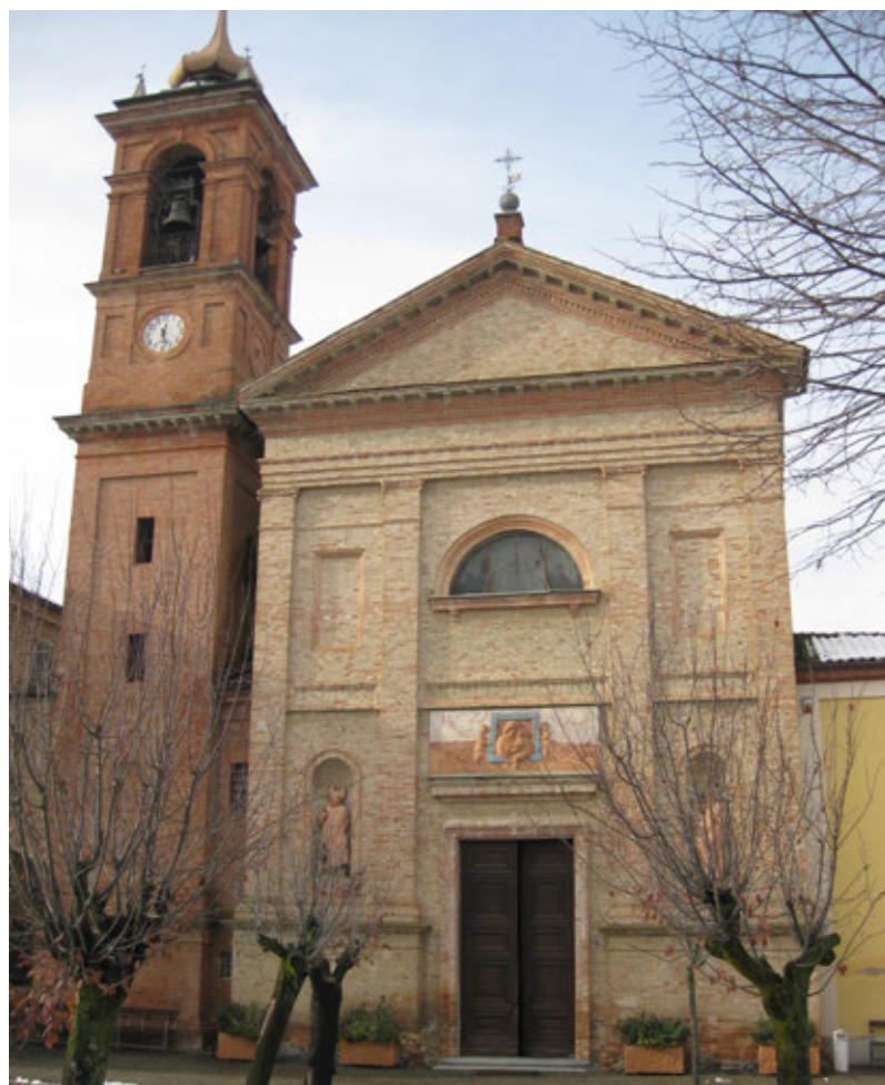
La facciata del Santuario

evidenziare: che i convenuti provenivano da diverse frazioni di Castiglione a dispetto del campanilismo passato; che la comunità ci tiene al Santuario ed è presente anche curandone il decoro; che nonostante il momento si va avanti, le cose si fanno, lentamente, ma si fanno.