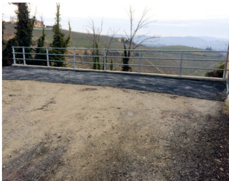
Il ripristino terminato