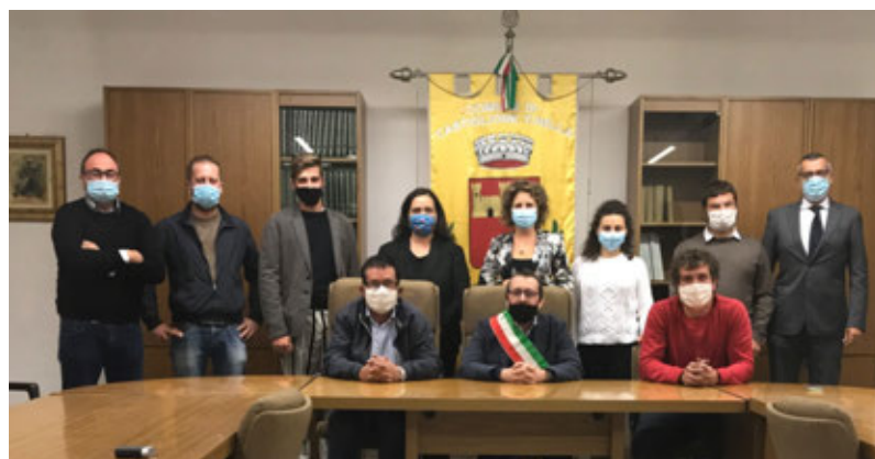
La nuova amministrazione