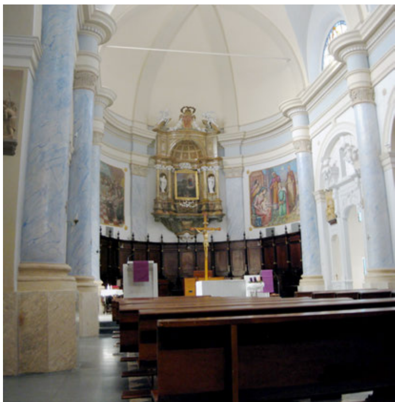
I nuovi colori del Santuario

Secondo: a novembre i soliti volontari hanno rimosso le foglie autunnali attorno alla chiesa restituendone un sito pulito e dignitoso. Di questo lavoro vogliamo