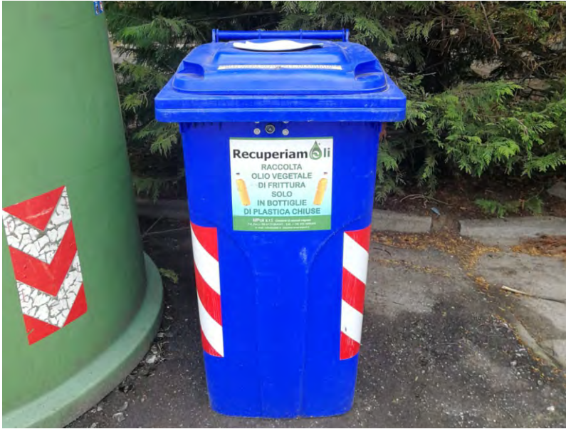
Il nuovo cassonetto per l'olio

Presso l'isola ecologica situata dietro il palazzo comunale, è stato aggiunto il contenitore per la raccolta differenziata degli oli ALIMENTARI. Questa nuova raccolta va a soddisfare le esigenze e le richieste dei castiglionesi, che spesso hanno difficoltà a smaltire questo tipo di prodotto. L'azione, allestita in collaborazione con il COABSER, rappresenta un passo in avanti verso l'ulteriore miglioramento della raccolta differenziata, che a Castiglione presenta già numeri molto positivi, con una percentuale di raccolta in costante aumento. L'olio smaltito dovrà essere posto all'interno di bottiglie di plastica, che andranno inserite nell'apposito cassonetto. Questo nuovo servizio si è ottenuto senza dover aumentare i costi di raccolta e di smaltimento.