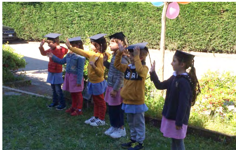
La Festa dei Remigini 1