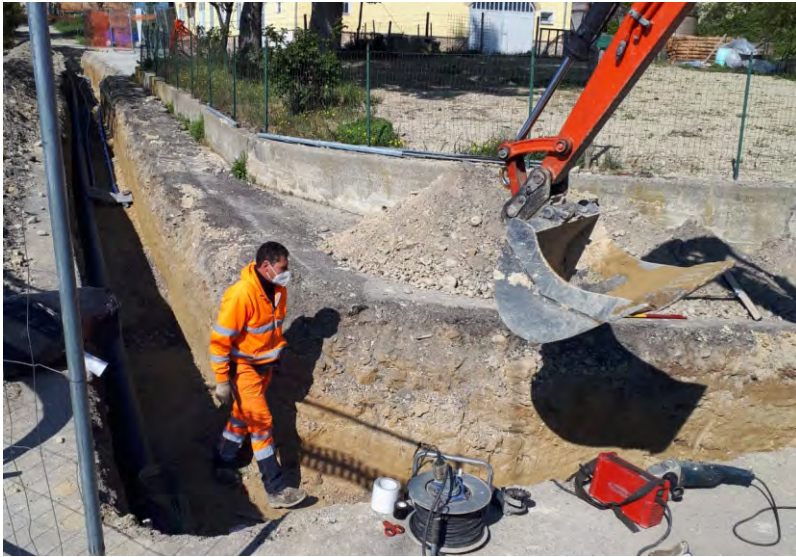
Lavori in Via San Carlo

La Tecnoedil ha lavorato nei mesi scorsi in due diversi cantieri per ottimizzare la rete che porta l'acqua potabile in tutte le abitazioni di Castiglione Tinella. In particolare, ha operato in località San Carlo, nelle vicinanze della chiesetta che accoglie il punto panoramico più alto del territorio castiglionesse: obiettivo dell'intervento è stato la riqualificazione del sistema acquedottistico con l'alimentazione della rete idrica da un serbatoio di volumetria nettamente superiore all'attuale e in grado di fornire maggiori garanzie di continuità nell'eventualità di un'interruzione prolungata della fornitura a monte. Il progetto ha come obiettivo la demolizione del serbatoio esistente e la riqualificazione dell'area a favore di un rilancio in rete a pressione costante da realizzarsi nel serbatoio di volumetria maggiore posto a qualche centinaia di metri. I lavori hanno interessato la realizzazione di due nuove condotte aventi un'estensione di circa 200 metri l'una, mentre il nuovo impianto di pressurizzazione sarà in grado di mantenere una pressione costante della portata anche in caso di avaria o di assenza di energia elettrica. Il secondo cantiere ha riguardato la zona di via Forti con la sostituzione delle vecchie tubazioni. In questo modo l'antica borgata è ora servita nel migliore dei modi. L'importo totale dei lavori supera i 150.000 euro.