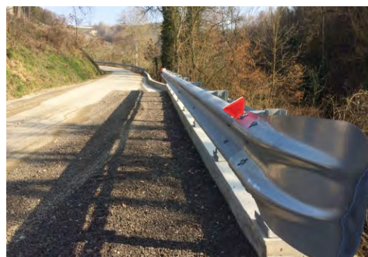
Il tratto di strada ricostruito

Nella parte bassa di via Valle Bera, è stata ripristinata la scarpata che era franata con l'evento alluvionale del novembre 2019; l'opera di sostegno, realizzata dalla ditta Colombano di Rocchetta Belbo, ha previsto la costruzione di un muro di sottoripa in calcestruzzo, completato con cunette alla francese, guard-rail e rifacimento