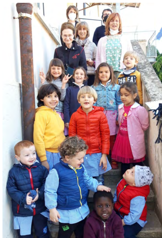
La Festa dei Remigini 2