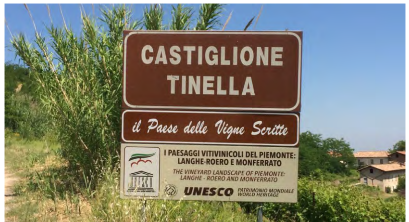
La nuova indicazione dedicata al parco

Mentre si sta completando la posa delle ultime indicazioni relative alla nuova numerazione civica, si stanno anche posizionando nuovi cartelli indicatori sulle nostre strade; in particolare, su tutte le colline castiglionesi che confinano con Comuni limitrofi, comparirà l'indicazione CASTIGLIONE TINELLA, nel punto in cui si entra nel nostro territorio comunale. Oltre a questo, i tre cartelli che indicano il nostro Comune sulle direttrici principali, che sono strade provinciali, si sono arricchiti dell'indicazione IL PAESE DELLE VIGNE SCRITTE, che annuncia l'ingresso sul territorio che ospita il nostro parco panoramico-letterario Versi in Vigna. E ancora, su alcune strade comunali si stanno posizionando cartelli che invitano a rispettare il limite di velocità di 30 km/h, oltre a dossi con la relativa segnaletica; la velocità sostenuta, che viene segnalata dai residenti su diversi tratti abitati del nostro territorio, rappresenta un grave pericolo. Il Comune valuta ognuno di questi casi, provvedendo ad azioni mirate a risolvere il problema, ma l'invito per tutti deve essere quello di procedere sempre con bassa velocità e attenzione, perché le nostre strade sono spesso strette, hanno poca visibilità e sono comunque sempre limitrofe alle nostre abitazioni.