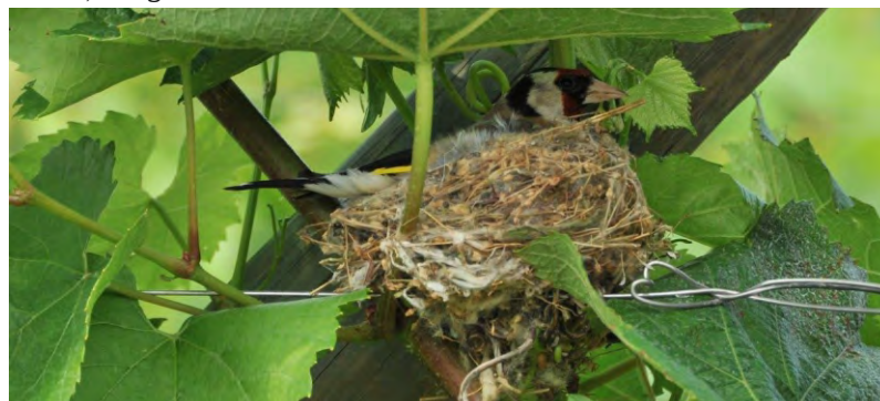
Il cardellino nel suo nido

appositamente per alcune specie hanno avuto la loro fortuna. Se si trova un nido in un filare di vigna sappiate che il responsabile di quella costruzione così solida e con soffice pavimentazione è opera di un Pigliamosche ( Muscicapa striata ) oppure di uno Zigolo nero ( Emberiza cirulus ) o di uno Zigolo giallo ( Emberiza citrinella ). Può capitare però che altre specie approfittino della infinita offerta che viene data dai nostri vigneti a perdita d'occhio. E' il caso ad esempio di una coppia di Cardellini ( Carduelis carduelis ) - specie oggi ormai piuttosto rara da noi - che ha scelto il filare per questo nido, dove la femmina ha depositato le sue uova (fotografia di Franco Bello - giugno 2021). Il dialetto piemontese di queste colline ha, già tanto tempo fa, assunto un nome dato dai contadini per questi uccelli che hanno casa nel corpo del filare di vigna: Lijavi, in italiano "lega la vite", o "legato alla vite".