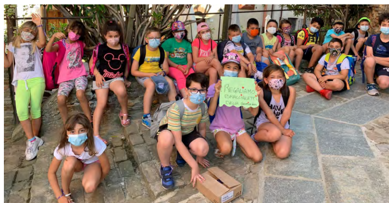
Il gruppo dei bambini 2