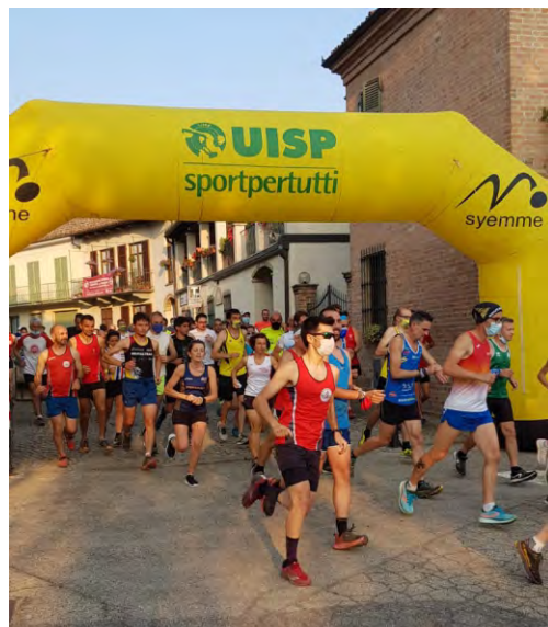
La partenza della corsa

Come tutti sappiamo, nel corso del 2020 e anche in questi primi sei mesi del 2021 abbiamo subito una condizione particolare a causa dell'emergenza Coronavirus; sono state annullate diverse manifestazioni, tra cui anche "Il Giorno delle Orchidee" nonostante la ricca fioritura dei mesi scorsi; ma il gruppo dell'Associazione Contessa non si è sconsigliato e nel mese di giugno, come tradizione vuole, è stata organizzata la corsa non competitiva "Aspettando il Trail del Moscato": un mini trail immerso completamente tra i vigneti e alla scoperta delle Vigne Scritte, al quale hanno partecipato 120 atleti. Per questo