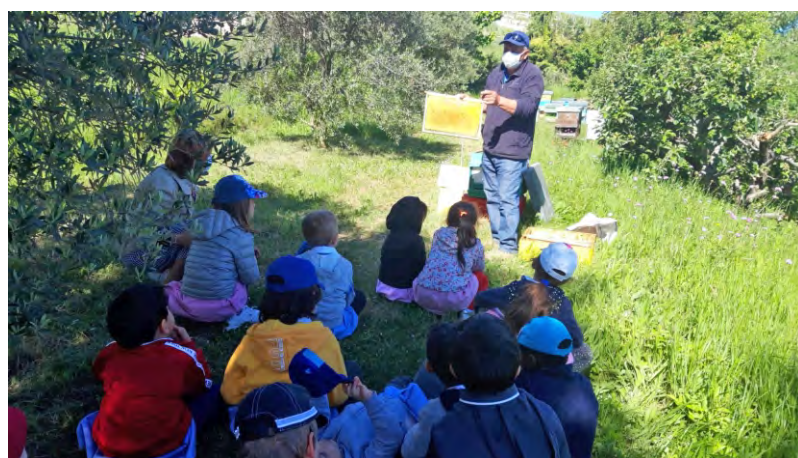
I bambini scoprono le api