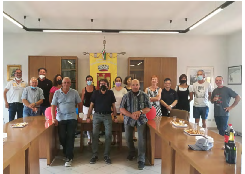
Il momento di festa e di saluto