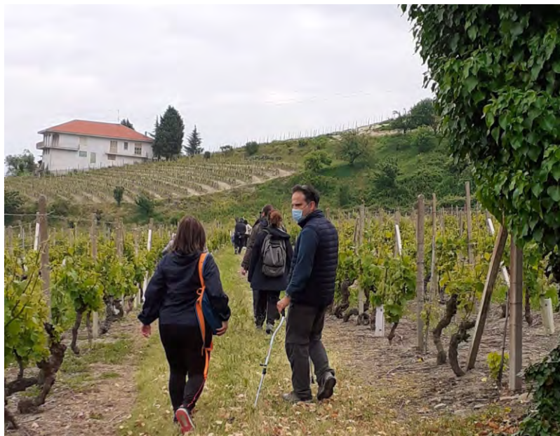
La camminata del 16 maggio

Terminati i lavori di restauro conservativo all'interno della chiesa nel luglio 2020, il progetto "Santuari e comunità" (finanziato dalla fondazione CRT e assegnatoci dal Vescovo Brunetti) non è affatto finito. Si tratta di un'azione volta a recuperare e valorizzare i Santuari del Piemonte e della Valle d'Aosta, che si articola in tre anime: interventi di restauro e recupero, iniziative di inclusione e aggregazione sociale, azioni di promozione culturale e turistica. A settembre inizieranno i lavori edili nei locali al piano terra della canonica per rinnovarli e trasformarli in un nuovo punto informazioni, un nuovo teatro e nuovi servizi igienici, affinché vi siano strutture moderne e adeguate per l'accoglienza dei visitatori e le esigenze della comunità. Parallelamente, sono state organizzate iniziative e ve ne saranno altre, per coinvolgere le persone della comunità. Ricordiamo il "Trekking sui sentieri e visita al Santuario" di domenica 16 maggio e il concerto del quartetto d'archi "The Random String Quartet" del 20 giugno: questo, oltre a un'occasione di incontro sociale, è stato un piacevole momento culturale guidato dall'ascolto di tre bei pezzi di musica da camera, due di Mozart, che è considerato uno dei massimi geni della musica occidentale, e uno di Haydn, considerato il padre del quartetto d'archi e della sinfonia.