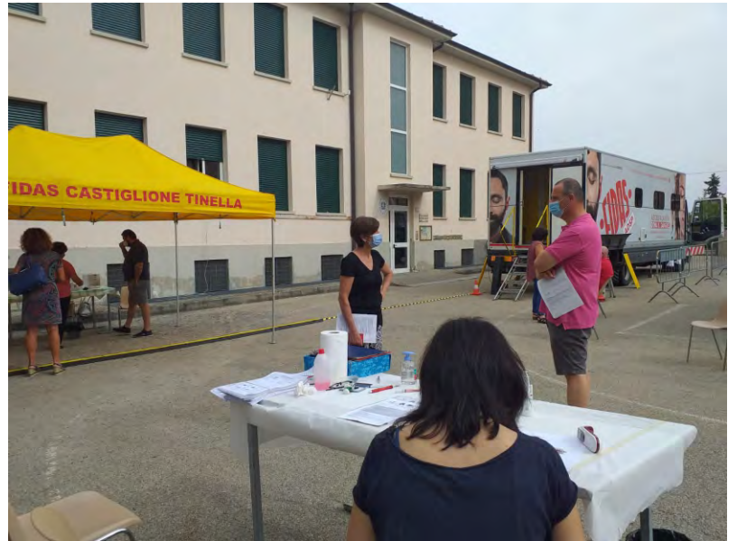
Giorno di donazione