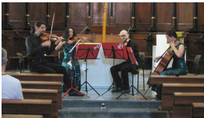
Il concerto in Santuario