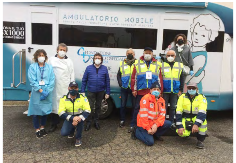
Il camper della Fondazione Nuovo Ospedale