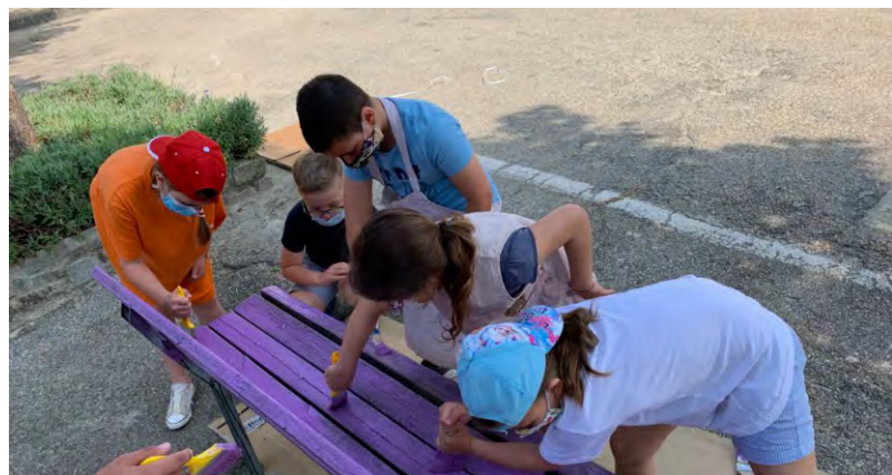
Le panchine pitturate

Inoltre per valorizzare il tema che contraddistingue l'edizione di quest'anno, una attività centrale sarà sicuramente la "creazione delle PANCHINE VIOLA DELLA GENTILEZZA". I ragazzi, seguiti dagli animatori, verniceranno con il colore viola alcune delle panchine presenti sul territorio comunale. La prima panchina viola è stata creata alcuni anni fa in un comune del torinese, ed è stata ideata per diffondere il valore della gentilezza tra i bambini e i ragazzi, ma non solo... Da allora, in Italia, ne sono nate molte altre fino a renderla un simbolo riconosciuto, e proprio nella settimana Nazionale delle Panchine Viola (21-27 giugno 2021) i bambini di ESTATE RAGAZZI porteranno la PANCHINA DELLA GENTILEZZA anche nel nostro paese.