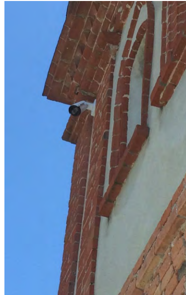
Telecamera alla chiesa di San Carlo

In questo modo il numero delle telecamere presenti sul nostro territorio salirà a dieci, per una spesa totale che supera i 50.000 euro.