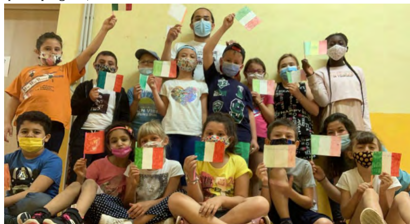
Il gruppo dei bambini 1

Non per ultimo è importante segnalare che le quote di iscrizione, anche quest'anno molto elevate a causa dei maggiori costi richiesti per l'adeguamento del servizio alle linee guida, non saranno completamente a carico delle famiglie. Il Comune infatti integrerà una importante parte della retta. A questo punto non ci resta che ringraziare tutti coloro che hanno permesso la realizzazione di questo progetto, e BUONA ESTATE A TUTTI!