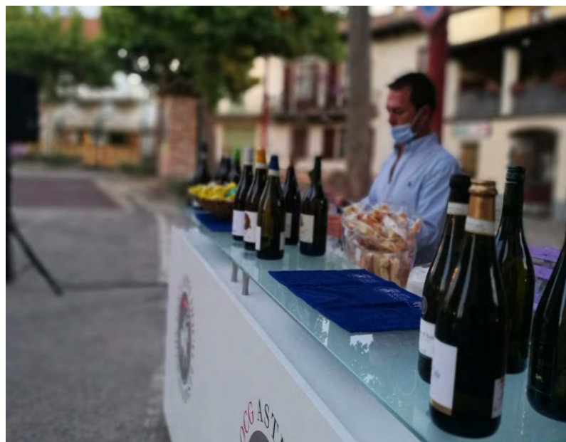
Il bancone di degustazione