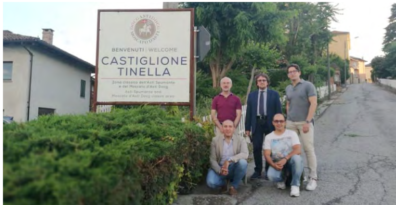
Il sindaco e i rappresentanti del Consorzio di Tutela dal nuovo cartello