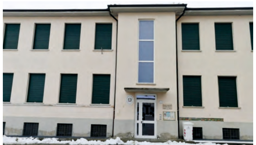
Le nuove finestre della scuola

A inizio anno si sono conclusi i lavori che hanno riguardato l'edificio scolastico di piazza XX Settembre. Il progetto, che si è sviluppato a partire dai mesi autunnali del 2020, ha compreso la necessaria sostituzione della caldaia, che offre il riscaldamento alle scuole ma anche al palazzo comunale, e la completa sostituzione dei serramenti del grande edificio che ospita il plesso scolastico intitolato al Cav. Grato Gandolfo; nuove e moderne finestre e nuove tapparelle in alluminio contribuiscono ora in modo positivo ad una buon utilizzo dell'impianto di riscaldamento, senza alcuna dispersione, e consentendo varie soluzioni di apertura, offrendo inoltre una bella soluzione estetica. Un pacchetto-lavori da 175.000 euro, di cui 89.000 euro da un contributo GSE, 50.000 euro da un contributo statale e il rimanente a carico del Comune. L'edificio sarà presto oggetto di un altro importante intervento che prevede la realizzazione di un "cappotto" sulle mura perimetrali, di un consolidamento alle strutture del tetto e di una ritinteggiatura finale interna ed esterna: un altro pacchetto da 160.000 euro.