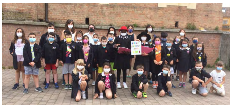
Festa di fine anno della primaria