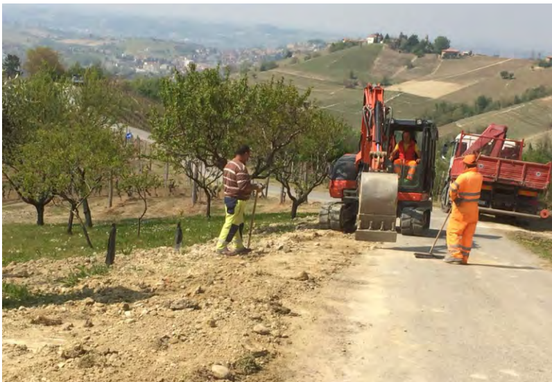
Lavori in Via Forti