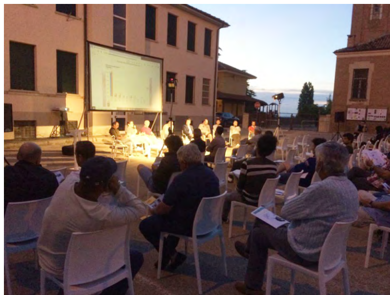
Il pubblico alla serata