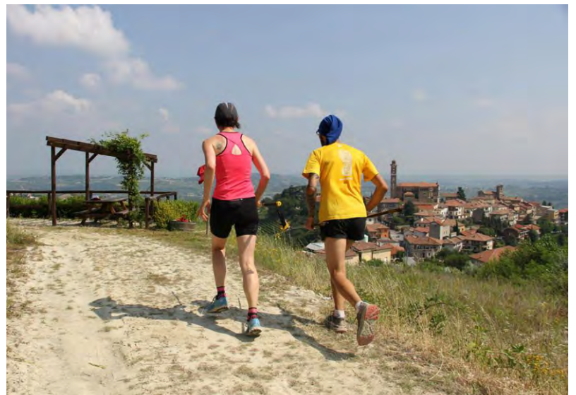
Atleti sui sentieri

Domenica 25 luglio è in programma invece il "Virginia Day": torna quindi l'evento dedicato alla nostra Contessa con un programma in corso di definizione che avrà diversi contenuti.