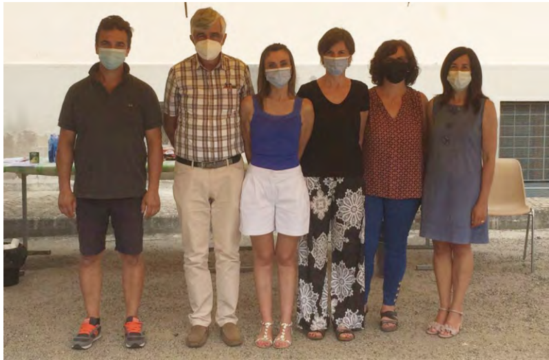
Alcuni componenti del direttivo Fidas

La pandemia ci ha costretti a limitare le nostre attività sociali che speriamo di riprendere nei prossimi mesi, comunque i prelievi continuano: a dicembre presso il centro prelievi di S. Stefano Belbo, mentre quello di marzo è stato effettuato con l'ausilio dell'autoemoteca in piazza a Castiglione, così come quello di giugno. Questo efficiente mezzo purtroppo ha il limite di trenta sacche; avendo avuto a marzo un cospicuo numero di prenotazioni, siamo stati costretti ad aggiungerci la domenica successiva al prelievo del gruppo Fidas di Santo Stefano Belbo per accontentare tutti i donatori. Con le vigenti norme anti COVID consigliamo vivamente di effettuare sempre la prenotazione prima del prelievo, per evitare assembramenti e gestire al meglio le sacche che ci vengono fornite da FIDAS ADSP.