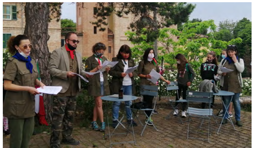
Un momento di lettura

Per essere sempre informati sulle novità che presto il circolo proporrà, l'invito è di seguire la pagina Facebook oppure il Gruppo WhatsApp.