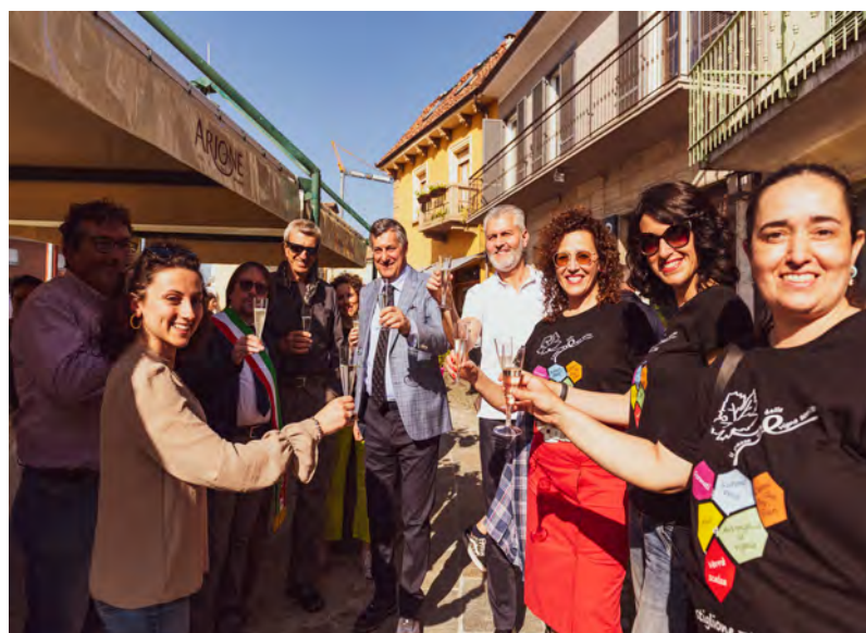
Il brindisi augurale