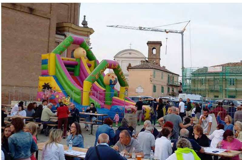
Animazioni in piazza