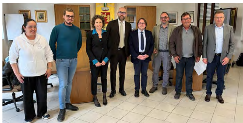
Il presidente provinciale ospite della nostra Amministrazione

Lo scorso 21 aprile nella sala consiliare l'Amministrazione comunale ha accolto la visita del presidente della Provincia di Cuneo, Luca Robaldo, giunto al nostro paese insieme a Massimo Antoniotti, responsabile della viabilità provinciale. Nel piacevole incontro si è avuto modo di presentare le realtà che ci distinguono e anche di affrontare insieme le argomentazioni che interessano i rapporti tra il nostro Comune e gli ambiti provinciali. Attraverso una serie di immagini preparate appositamente si è anche valutato, in modo particolare, lo stato delle strade provinciali che attraversano il nostro territorio e i necessari interventi di ripristino; nell'occasione si è parlato anche dei vecchi muretti a secco di via San Carlo, del viale alberato su via Circonvallazione ma anche delle questioni relative alle nostre scuole e ai bandi PNRR che la Provincia affronta anche per i Comuni.