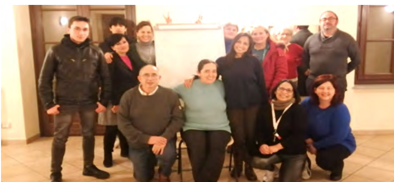
Il corso di inglese

Facendo il bilancio del nostro piccolo Circolo, ci possiamo ritenere soddisfatti grazie ai corsi, alla risposta dei soci, alle nostre sporadiche aperture domenicali e grazie anche alle iniziative pro-santuario e al Bonus Covid. Inizio quest'articolo ringraziando tutti i soci e i collaboratori che mi hanno aiutato e supportato in