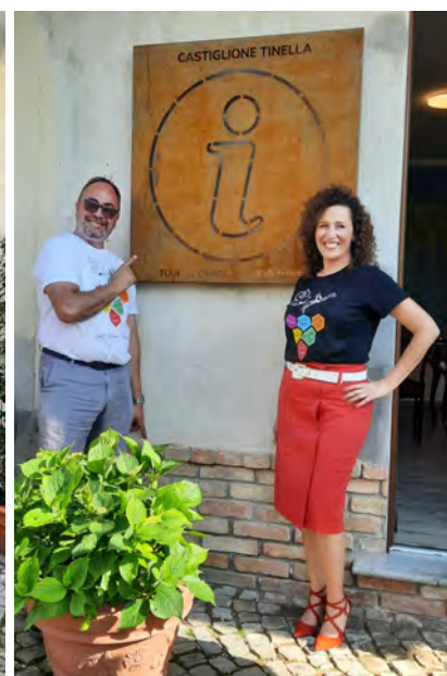
La nuova insegna