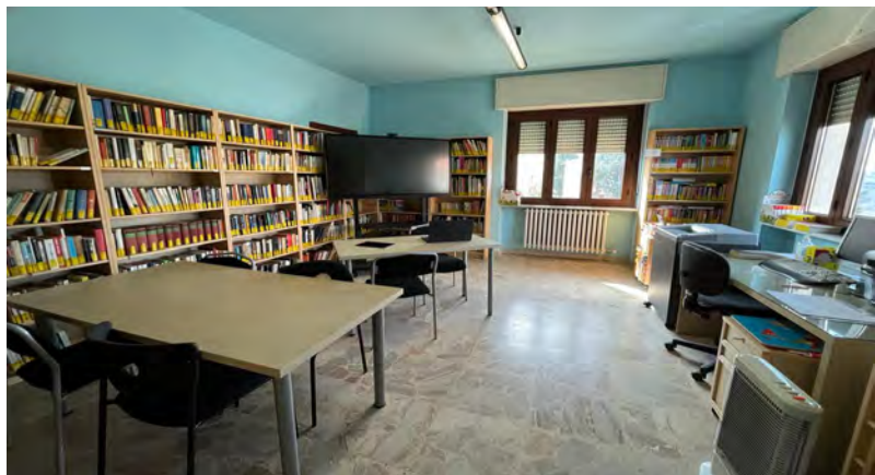
Gli spazi della biblioteca