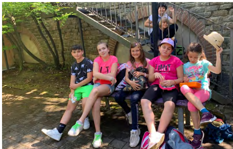
Estate ragazzi (1)

Pronti partenza via! È partita la nuova avventura di Estate Ragazzi! Anche quest'anno è stato attivato il servizio di Estate Ragazzi organizzato dal comune in collaborazione con l'associazione RDR. Le attività sono partite lunedì 12 giugno e accompagneranno i bambini per 8 settimane. A seguire i partecipanti ci saranno gli educatori qualificati dell'associazione RDR. Come ogni anno saranno organizzate attività molto divertenti ed interessanti come passeggiate ed escursioni, gite e giornate in piscina. Particolare attenzione sarà dedicata ad attività di pulizia, manutenzione e miglioramento di alcune aree pubbliche, un modo divertente per imparare l'educazione civica, il senso della comunità, dello stare insieme e l'importanza del rispetto per il bene pubblico. Non saranno poi dimenticati i compiti delle vacanze ai quali verrà riservato uno spazio dedicato. Non per ultimo è importante segnalare che le quote di iscrizione, anche quest'anno, non saranno completamente a carico delle famiglie. Il Comune infatti integrerà una parte della retta. A questo punto non ci resta che ringraziare tutti coloro che hanno permesso la realizzazione di questo progetto, e BUONA ESTATE A TUTTI!