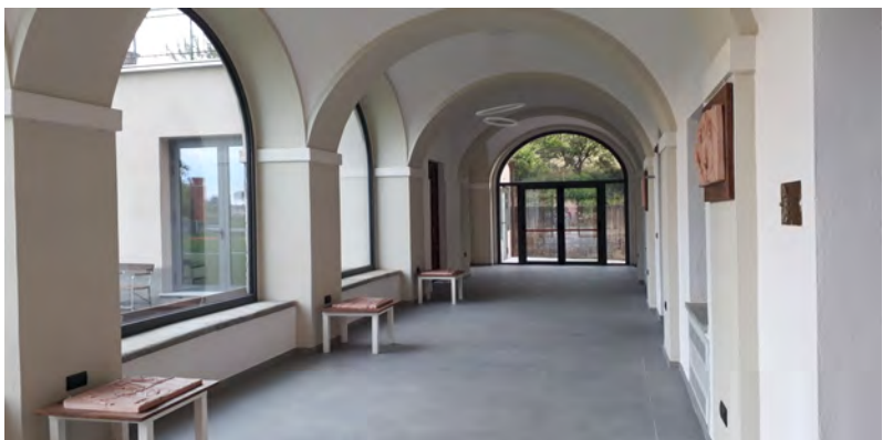
Lavori al Santuario (2)