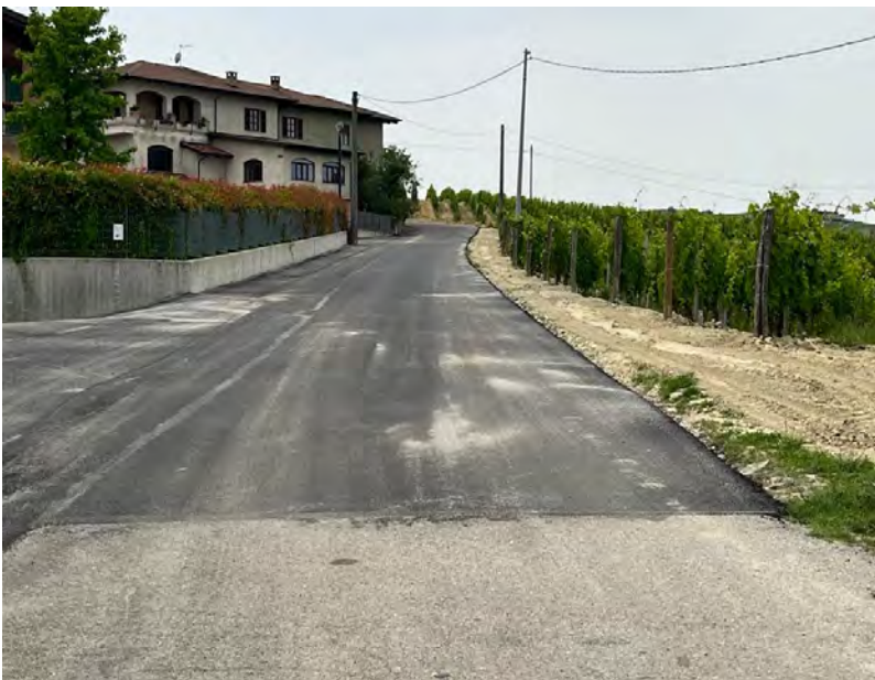
Nuovi asfalti in via San Martino

Già programmati nello scorso autunno e poi rinviati per condizioni stagionali sfavorevoli, sono stati infine realizzati alcuni tratti di nuovi asfalti in via San Martino, individuati come i punti dove la sede stradale pubblica era più malridotta e dove si è intervenuto per ricostituire anche il sottofondo. Si procederà ora con l'individuazione dei nuovi tratti per il prossimo intervento.