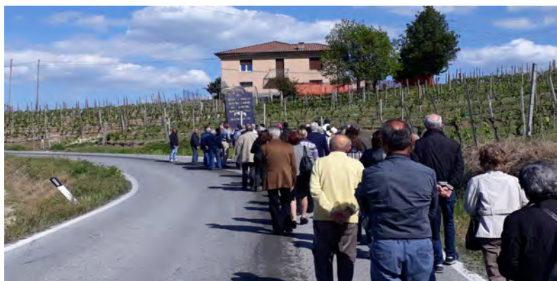
La processione di aprile