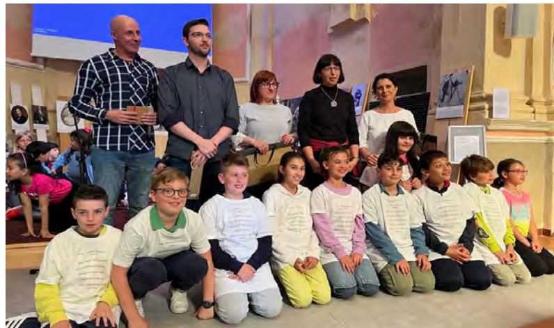
La festa della Primaria (2)