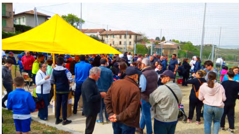
La folla all'inaugurazione