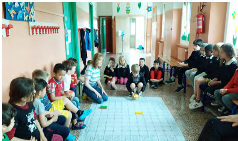
Attività a scuola