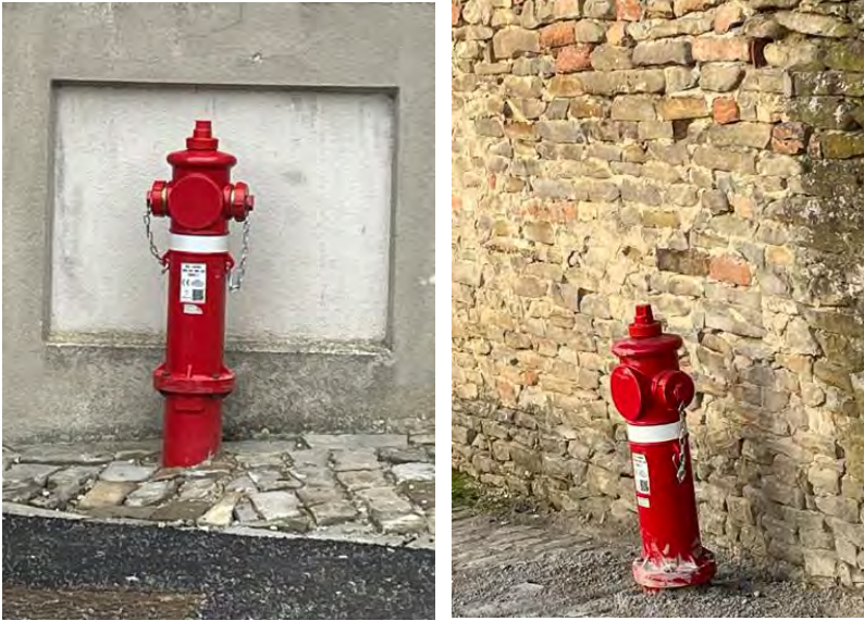
I nuovi idranti

verso l'edificio eventualmente colpito. Il Comune ha infine consegnato un estratto di mappa dei nuclei abitati con l'esatta posizione dei punti di rifornimento al comando provinciale dei VVF, e alle relative stazioni di Alba e Santo Stefano Belbo.