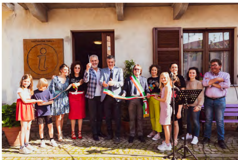
Il taglio del nastro