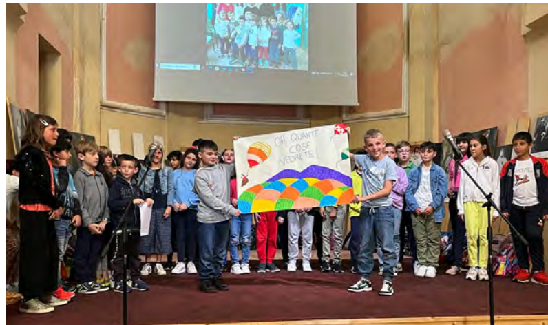
La festa della Primaria (1)