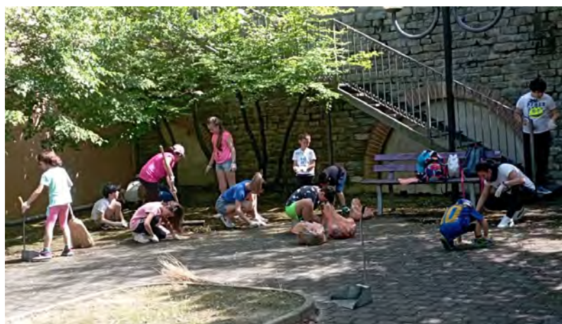
Estate ragazzi (2)