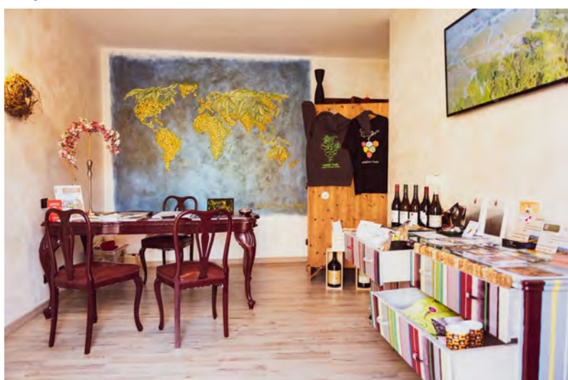
Gli interni dell'ufficio turistico