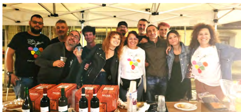
I ragazzi dell'Associazione