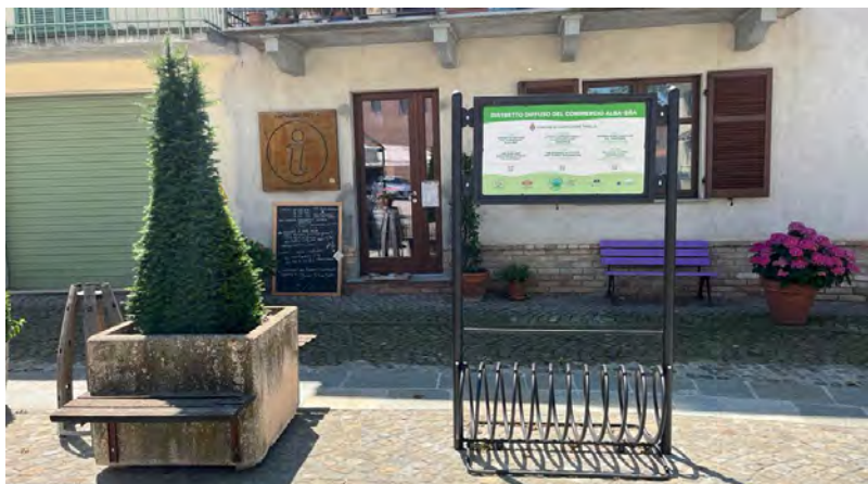
Il nuovo portabici

Tra i Distretti del Commercio del Piemonte, quello di Alba-Bra comprende la nostra area e si occupa di valorizzare le attività commerciali presenti sul territorio che, soprattutto nei piccoli Comuni come il nostro, rappresentano preziose e storiche realtà a servizio del tessuto sociale e anche del turismo. La nostra Amministrazione comunale ha avuto, su questo argomento, un dichiarato interesse espresso fin dall'inizio di questo mandato, e la costituzione del Distretto è andata quindi incontro alle volontà che si erano prefissate, volte a valorizzare e a sostenere questi esercizi. Nell'ambito delle prime attività, il Distretto ha consegnato a tutti i Comuni dell'area coinvolta un portabici, nel nostro caso posizionato nell'area pedonale vicino all'ingresso dell'ufficio di informazione turistica e che si aggiunge a un altro simile elemento collocato sulla piazza. Il Distretto si è poi rivolto alle piccole imprese commerciali e artigianali, comunicando la possibilità di accedere a un bando che disponeva contributi a fondo perduto per interventi di riqualificazione e modernizzazione degli esercizi.