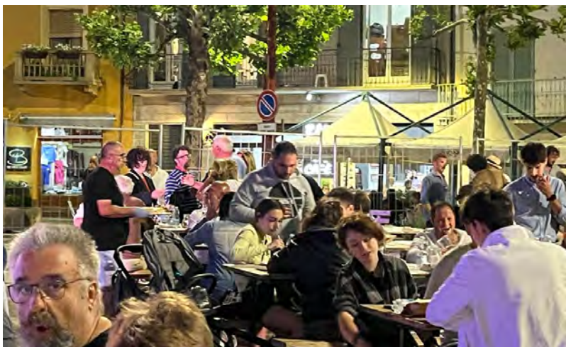
La Cena di San Luigi