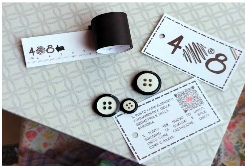
Elementi del marchio