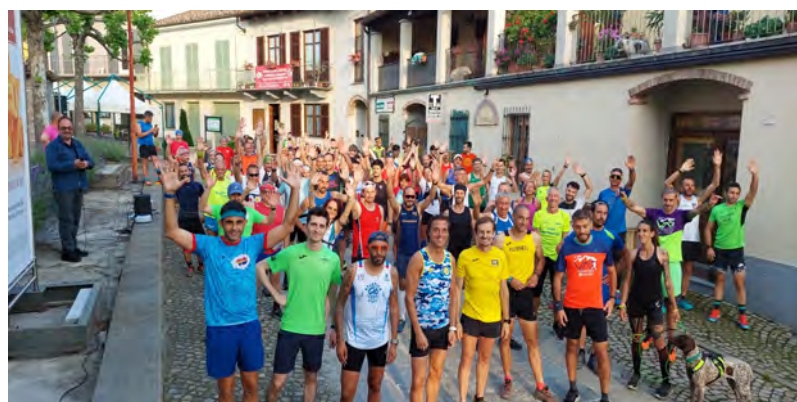
La corsa Campestre (1)

Una bella edizione per la Festa patronale di San Luigi, che ha animato il paese attraverso diversi eventi tra cui la tradizionale Corsa campestre non competitiva, la Festa della Leva, la Cena di San Luigi e altre iniziative. Ecco qui una carrellata fotografica dei giorni di festa: