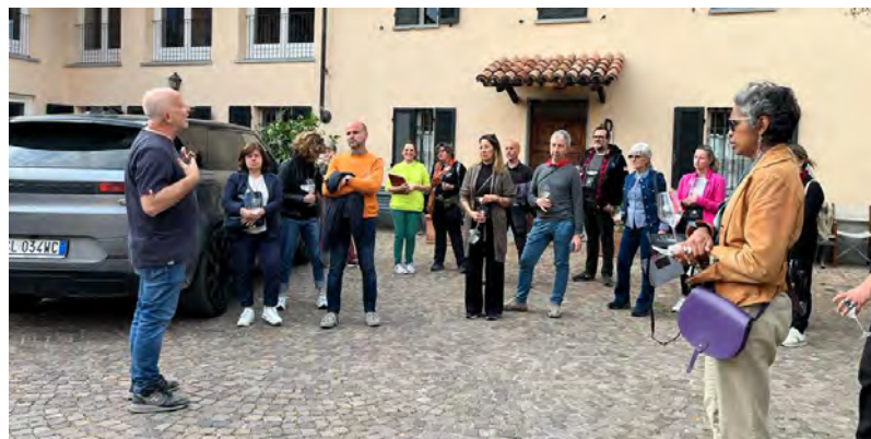
Alla cantina Saracco