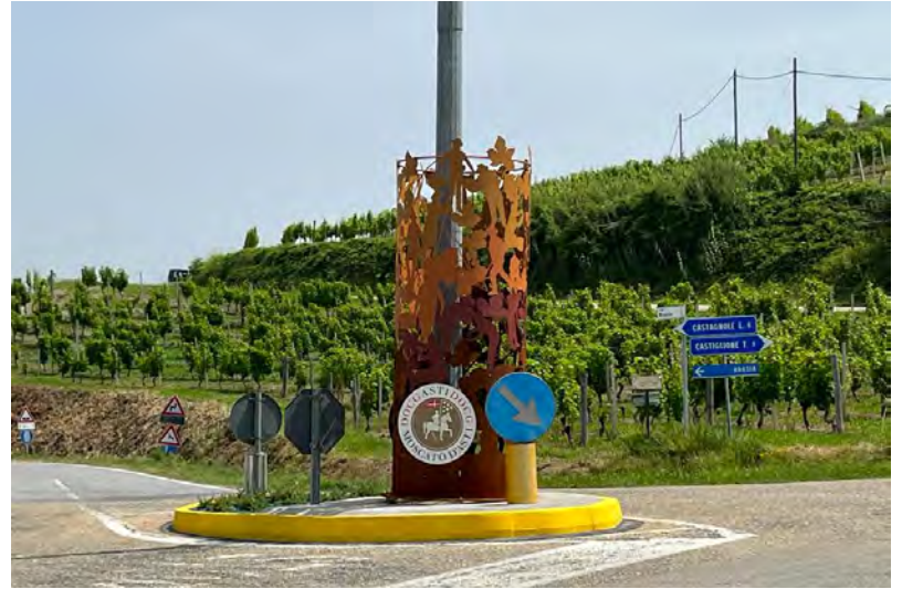
L'opera posizionata sullo spartitraffico