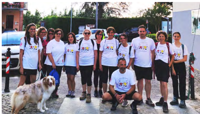
La Fidas alla corsa campestre