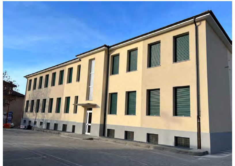
La foto dei lavori conclusi

Dopo aver seguito passo dopo passo i lunghi lavori realizzati, ecco il nostro edificio scolastico completamente rinnovato e con i colori scelti per la nuova tinteggiatura esterna. Ricordiamo l'importanza di questo edificio costruito quasi 75 anni fa e che oggi, oltre all'attività scolastica, ospita una sala polivalente utilizzata per molte e diverse occasioni, la sede della Taverna Alpina e i bagni pubblici. Gli spazi e la cucina delle scuole risultano inoltre sempre un importante appoggio nel corso dell'organizzazione di eventi.