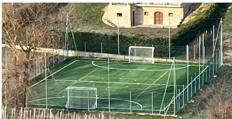
Il nuovo campo sportivo ai Balbi