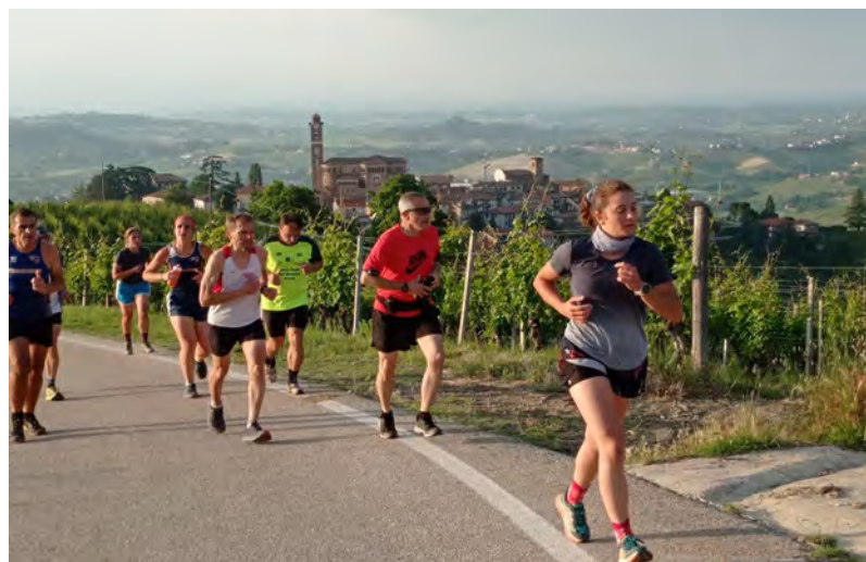
La corsa Campestre (2)