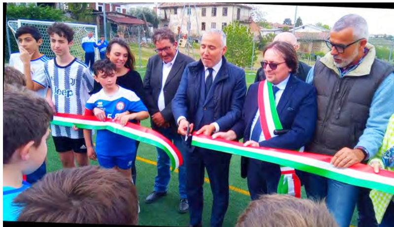
Il taglio del nastro