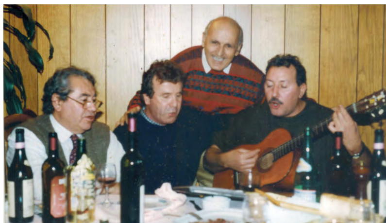
Armonizzazioni a tavola

Suona mezzanotte all'osteria, sono solo e senza compagnia, dico al cantiniere voglio bere, portatemi un quartino ed un bicchiere, ma l'ora è tarda mi mandano via, suona mezzanotte all'osteria. Voglio bere, per scordare un'illusion, voglio bere, per la dolce mia passion. M'han detto che laggiù nel casolare, si beve solo per dimenticare, m'han detto che laggiù nel casolare, si beve solo per dimenticare. Stasera sono triste e sconsolato, perché l'amore mio mi ha lasciato, bevo per dimenticare, sperando di vederla ritornare, bevo alla salute di Maria, suona mezzanotte all'osteria. Voglio bere, per scordare un'illusion, voglio bere, per la dolce mia passion. M'han detto che laggiù nel casolare, si beve solo per dimenticare, bevo alla salute di Maria, suona mezzanotte all'osteria.