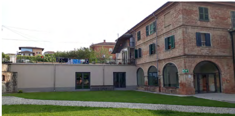
Lavori al Santuario (1)

Naturalmente anche l'impiantistica è stata rinnovata, adeguata e il tutto