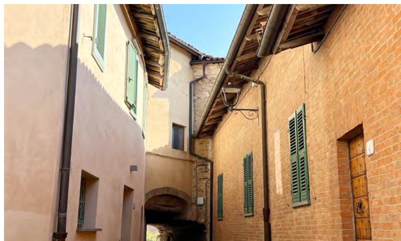
Le nuove lampade nel centro storico

Si è completato il progetto che ha previsto la sostituzione dei tradizionali lampioni con nuove lampade a led, nell'ambito delle azioni relative all'efficientamento energetico che permetteranno di ottenere un notevole risparmio sulla bolletta pubblica. Un lavoro importante, del valore di quasi 60 mila euro, realizzato grazie a un finanziamento della Regione Piemonte e alla collaborazione di Enel Sole, in cui il Comune è intervenuto cofinanziando in piccola parte. La sostituzione ha riguardato le lampade del centro storico, dove sono stati posizionati corpi illuminanti che richiamano le antiche lanterne ma in forma elegante e stilizzata, e il resto del territorio comunale con un altro tipo di lampade, più ordinarie; in entrambi i casi si è ottenuta anche una illuminazione più elevata, rispetto alla precedente, con un tono di colore piuttosto "caldo". In questo pacchetto di lavori è stata compresa anche l'illuminazione dell'area camper che si sta sviluppando in frazione Balbi, e anche un pannello informativo collocato sul palazzo comunale che segnala digitalmente i gradi di allerta meteo, oltre la temperatura esterna, l'umidità dell'aria e la misura del vento. Il prossimo intervento riguardo l'illuminazione pubblica, prevede l'allestimento di alcuni nuovi punti luce dove si è riscontrata la necessità.