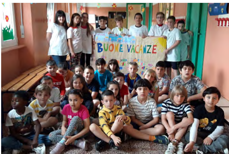
Foto di fine anno scolastico