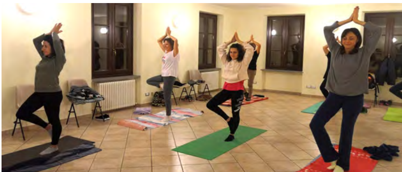
Il corso di yoga