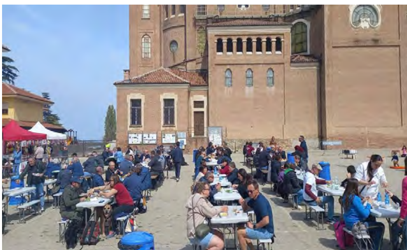
Pasquetta in piazza

Il 22 aprile presso la sede dell'associazione Artefora, che è anche l'abitazione