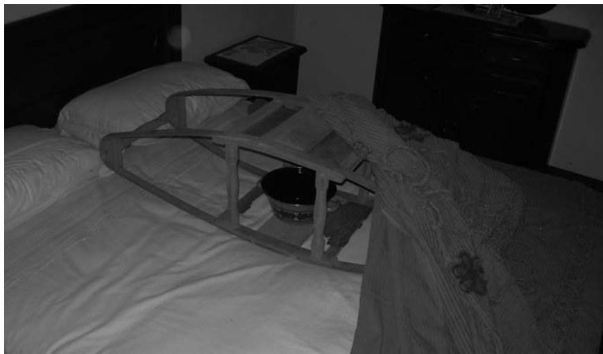
Il "frate" nel letto

(il torsolo delle pannocchie di granoturco). Le camere da letto non erano riscaldate, d'inverno le lenzuola erano umide e gelate; è allora che la nonna prendeva la brace ardente dalla stufa o dal caminetto, la metteva in un recipiente di terracotta (chiamato "cucu") o in mancanza di questo in una vecchia pentola bassa; il suddetto recipiente veniva collocato nel "Fra", fatto di legno ricurvo, della lunghezza di 1,50 metri circa.