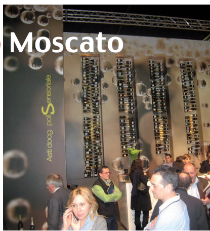
Lo stand del Consorzio dell'Asti

La prima al mondo per dimensioni, è andata assumendo nel tempo un rilievo sempre più importante anche a livello internazionale, aprendosi alle innovazioni e imponendosi all'attenzione degli operatori non solo come fiera commerciale, ma anche come vero e proprio "evento" imperdibile. Sono 92.325 i metri quadrati di superficie netta utilizzata; oltre 4200 espositori; oltre 152.000 visitatori, di cui circa 47.000 esteri (con un incremento del 4.4% rispetto al 2009) e 2.500 giornalisti accreditati. Numeri impressionanti che ben fanno sperare soprattutto per una marcata vivacità degli addetti ai mercati