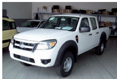
Il Ford Ranger Super Cab XL 5 posti 4WD

Il parco macchine comunale si arricchisce di un nuovo mezzo destinato alla protezione civile, acquistato tramite un finanziamento regionale di 20000,00 euro e con