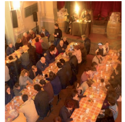
La tradizionale "China" di gennaio