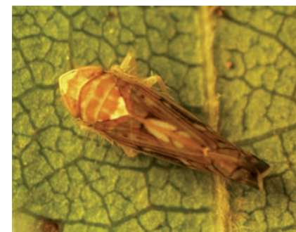
Scafoideus Titanus adulto

malate riscontrate lo scorso anno su varietà come il Moscato (notoriamente indicata come poco sensibile) soprattutto nei vigneti dove nel corso degli anni non si è praticata un'adeguata lotta contro lo Scafoideus titanus. Fondamentale per cui non allentare l'attenzione sul vettore, l'epidemia potrebbe riesplodere.