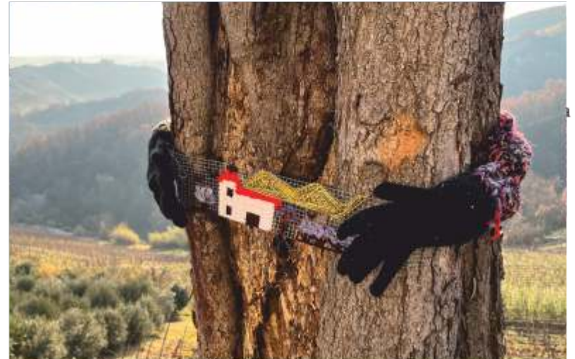
La Giornata degli Abbracci (1)