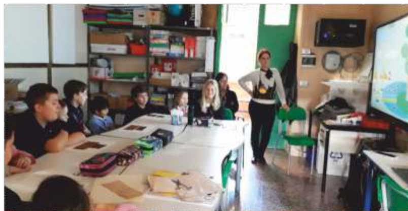
Progetto Continuità Infanzia - Primaria (1)