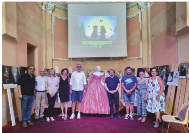
Foto di gruppo della presentazione