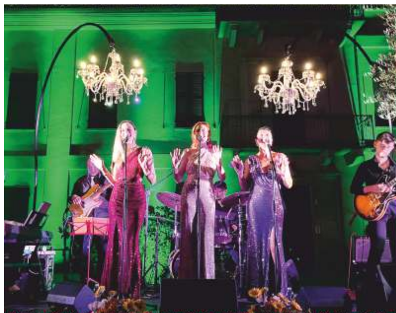
Le Blue Dolls

Successivamente, come annunciato dall'articolo della Associazione Contessa di Castiglione, anche il "Virginia Day" ha regalato un importante momento: quello della consegna del Premio al grande artista Guido Harari - che ha ricevuto anche la consueta tazza celebrativa realizzata da Davide Vaccaneo - insieme ad altri contenuti che hanno reso l'intero evento ricco e interessante.