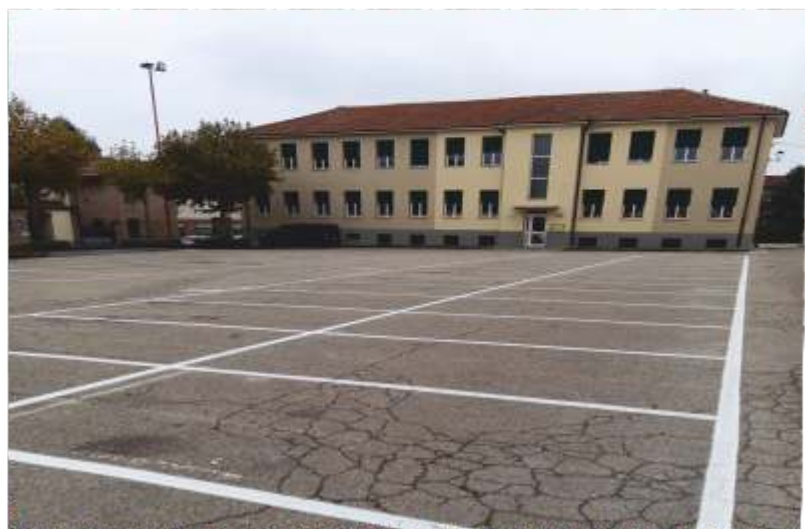
Rifatta la segnaletica orizzontale

Nell'ultimo periodo si è provveduto al rifacimento della segnaletica orizzontale, che ha interessato le nostre due piazze e tutte le strade comunali. In via Balbi e in via Ghiga è stato realizzato un dosso stradale per rallentare la velocità dei mezzi in transito mentre, per quanto riguarda le strade provinciali che attraversano il nostro territorio, sulla via Circonvallazione è stato installato un importate e