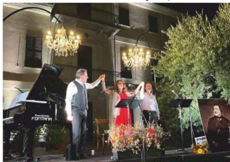
Il concerto lirico a Villa Fogliati