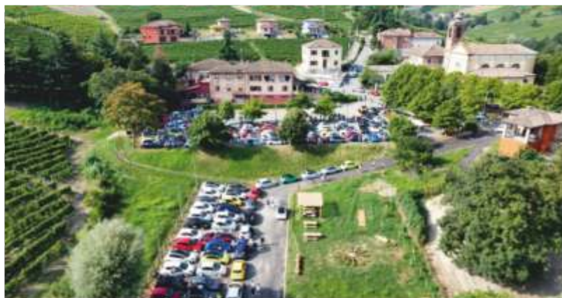
Il Raduno Abarth

Venerdì 15 novembre, nei locali del Santuario, è stato proiettato il film "Onde di terra", regia di Andrea Icardi con Erica Landolfi, Paolo Tibaldi e Lucio Aimasso. Molto apprezzato, anche dai protagonisti del film presenti alla prima castiglione, il servizio bevande e pop corn offerto dal Circolo all'ingresso del