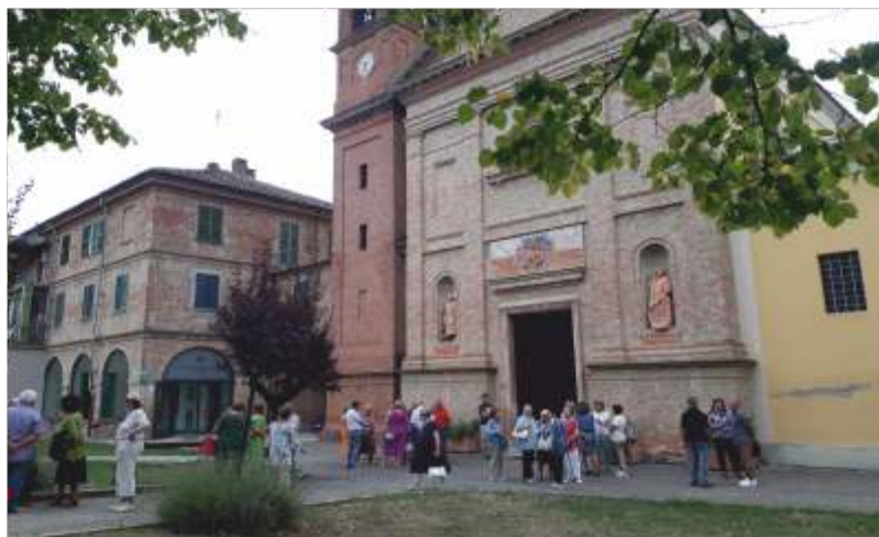
Fedeli al Santuario

Il 2025 sarà anche anno giubilare ordinario dedicato alla speranza e comincerà il 24/12/2025 con il rito dell'Apertura della Porta Santa della Basilica Papale di San Pietro per terminare il 06/01/2026. La diocesi sta organizzando un pellegrinaggio a Roma di tre giorni nei mesi estivi; anche per questo trovate indicazioni sul sito. Con dicembre è iniziato l'Avvento, non solo quello dei dolci Kinder; che la gente sappia avere un pensiero, un momento, uno spazio per le cose buone e positive, religiose e non, come si dovrebbe fare a Natale. Le luci, gli addobbi, i bei presepi che l'impegno dei volontari ha realizzato, non sono la festa, ma il suo gioioso annuncio. Ricordiamo la Novena, ogni sera alle 20.30 dal 16/12, e le Messe: il 24/12 alle 21.00 e il 31/12 alle 18.00 a Sant'Andrea, il 25/12 alle 11.15 e il 01/01 alle 17.00 al Santuario. Buone feste a tutti!