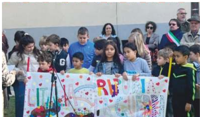
Commemorazione ai Caduti di tutte le guerre

ai nostri "nonnini" nella struttura socio-assistenziale "Casa Sant'Andrea", per portare gli auguri a tutti gli ospiti in occasione della Festa dei Nonni. Questo simpatico momento, abbellito da canti e balletti che tanto hanno emozionato e divertito tutti i presenti, ha dato l'avvio a un nuovo progetto didattico, che prevede anche nella scuola dell'Infanzia l'insegnamento dell'Educazione Civica ormai reso obbligatorio dalle nuove linee guida ministeriali. Si tratta del progetto "Esperienze emotivo-relazionali tra generazioni diverse" che consiste in una serie di incontri laboratoriali con scadenza quindicinale nel corso dell'intero