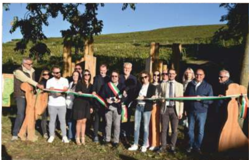
I due momenti inaugurati