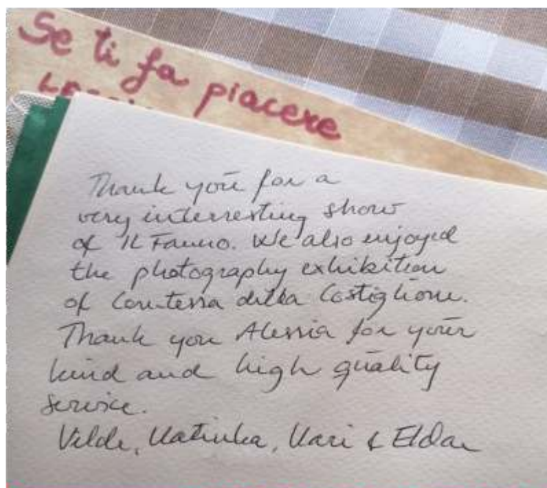
Uno dei tanti messaggi lasciati dai visitatori stranieri

ufficioturistico@comune.castiglionetinella.cn.it - Tel. +39 329 049 43 80