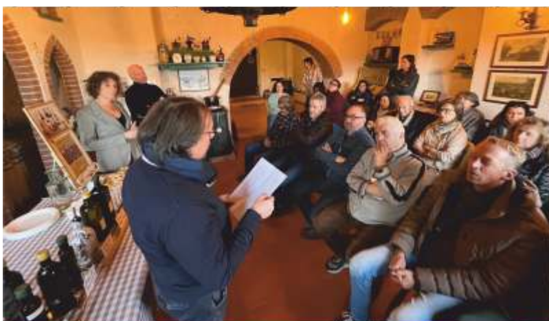
L'Olio di Castiglione