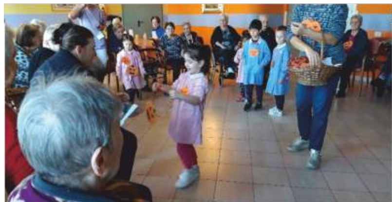
In visita ai "nonnini" a Casa Sant'Andrea