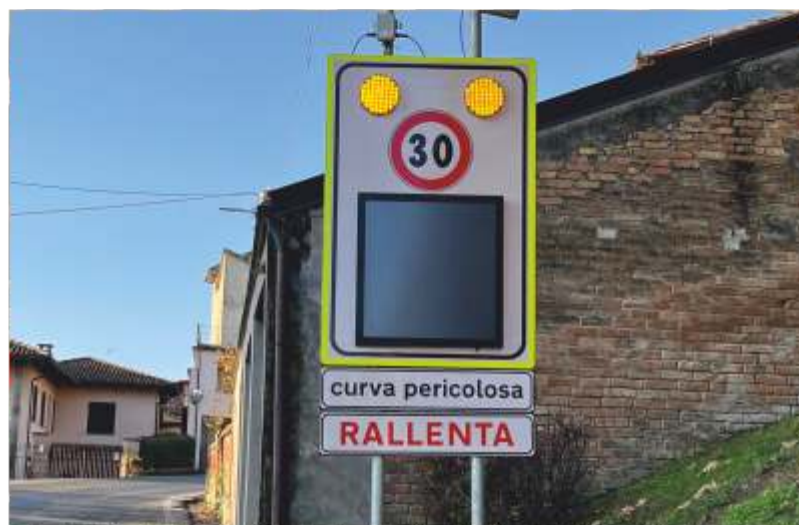
Nuovo cartello di rallentamento