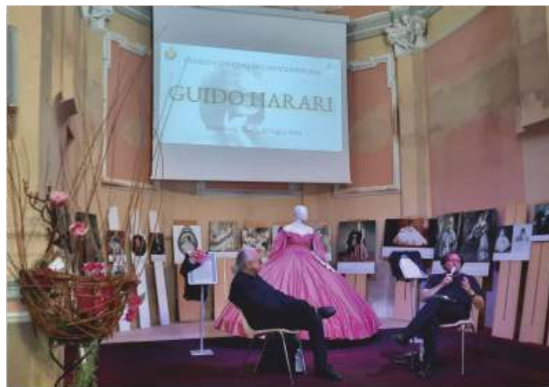
L'intervista a Guido Harari

Successivamente, come annunciato dall'articolo della Associazione Contessa di Castiglione, anche il "Virginia Day" ha regalato un importante momento: quello della consegna del Premio al grande artista Guido Harari - che ha ricevuto anche la consueta tazza celebrativa realizzata da Davide Vaccaneo - insieme ad altri contenuti che hanno reso l'intero evento ricco e interessante.