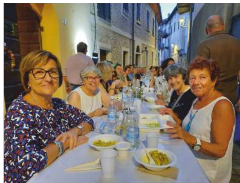
Il Banchetto In Contrada

seguono il tema dello Sguardo. Andando verso la fine di questo anno, la Pro Loco Contessa di Castiglione insieme al gruppo Alpini rivolgeranno gli auguri di Natale ai castiglionesi dopo la S. Messa prevista per la sera di martedì 24 dicembre in parrocchia: ai presenti verrà offerta cioccolata calda con il panettone. Non ci resta che, a nome mio e della Pro Loco Contessa, rivolgere a