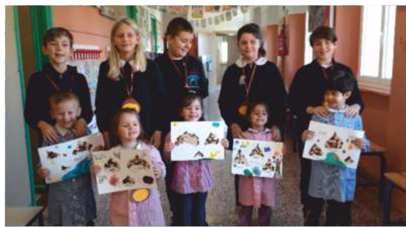
Progetto Continuità Infanzia - Primaria (2)