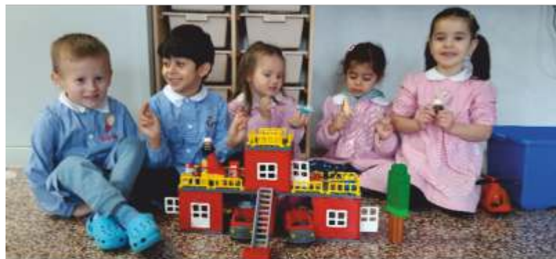
Attività di inserimento: il gioco libero insieme

Presso gli antichi Romani il loro complesso panorama mitologico affidava questo periodo dell'anno alla benevola protezione di una divinità particolare, poiché dotata di una singolare caratteristica fisica: la presenza di due volti orientati in direzioni opposte. Si tratta del dio Giano, da cui prende origine il nome del mese di gennaio. Giano bifronte, infatti, segnava lo spartiacque tra il vecchio e il nuovo anno, con uno sguardo rivolto al passato e l'altro già orientato verso il futuro. Questo ci porta a pensare come fin dall'antichità, con l'approssimarsi del nuovo anno, si è naturalmente portati a riflettere su ciò che si va concludendo, con il suo inevitabile bilancio fatto di valutazioni, critiche costruttive, apprezzamenti, forse qualche rimpianto misto a delusione, ma pur sempre ricco di lavoro e soddisfazioni, e poter così accogliere il nuovo cammino con rinnovata speranza. Quale ambiente migliore se non la scuola sa "tirare le fila" del passato per valutare questa prima parte di anno scolastico?