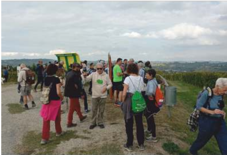
I visitatori alla panchina gigante del Moscato