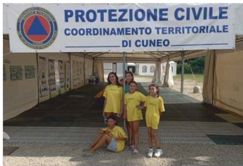
Le partecipanti al Campo Scuola