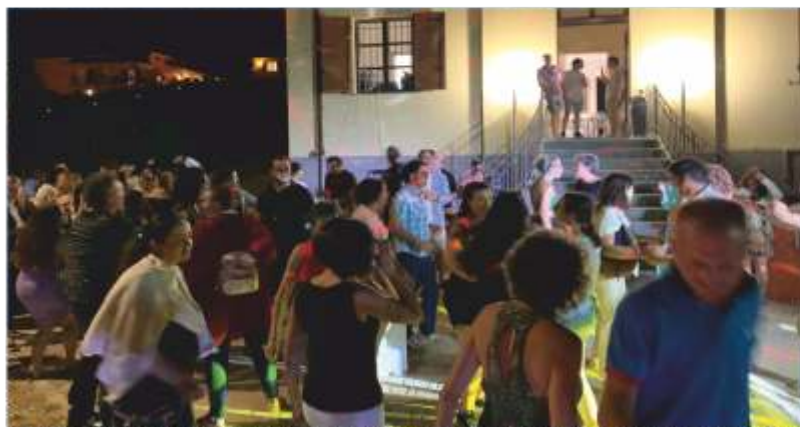
Momenti di festa al Circolo

Ricordiamo che le attività del Circolo sono fruibili previo tesseramento ACLI, e ringraziamo fin d'ora TUTTI i soci che continueranno a sostenerci rinnovando oppure acquistando una nuova tessera associativa.