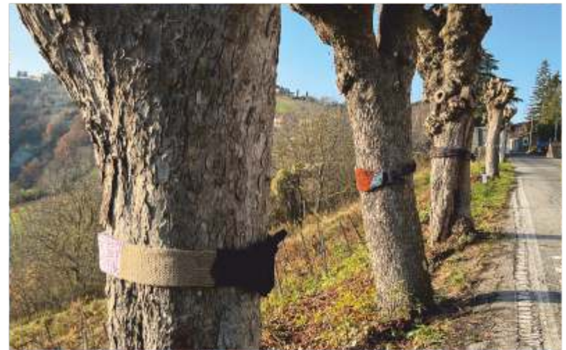
La Giornata degli Abbracci (2)