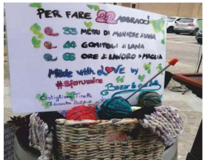
La Giornata degli Abbracci (3)