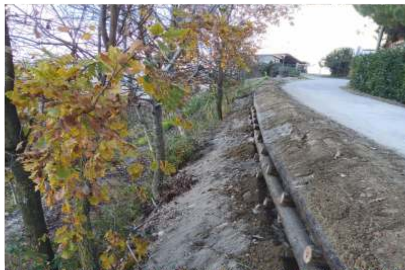
Lavori in via Manzotti