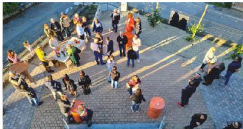
L'inaugurazione di ottobre