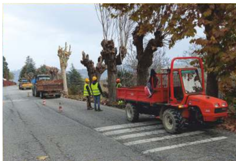
La potatura degli alberi

completo cartello segnaletico con display e rilevatore della velocità alimentato con pannello solare: un messaggio di attenzione richiesto dal Comune alla Provincia per la curva cieca sulla quale insistono anche l'attività dell'Albergo Castiglione Langhe e un'area panoramica. Su quest'ultima via e sulla via Santuario, è stata anche effettuata la potatura degli alberi, che ha interessato poi anche la piazza e gli altri spazi verdi comunali: gli interventi relativi alla strada provinciale e alla proprietà comunale sono stati condivisi dal Comune e dal personale della Provincia, che ha anche messo a disposizione i mezzi; per il Comune, il lavoro è stato compiuto dalla cooperativa Castion insieme anche al nostro operatore esterno Roberto Arione. Sul tema della viabilità si sono anche compiuti lavori in via Manzotti, dove è stata realizzata una palizzata per sostenere un tratto di sponda in movimento lungo la strada; i lavori sono stati eseguiti dalla ditta Colombano SRL che nello stesso periodo ha operato anche sotto la Strada del Solito, sotto il paese, dove sono state rifatte le tubazioni per le acque bianche comunali oltre al posizionamento di un nuovo tombino. I due interventi sono stati realizzati con fondi comunali per 27.000,00 euro.