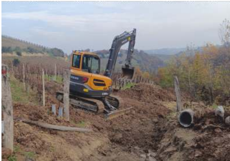
Lavori sotto la strada del Solito